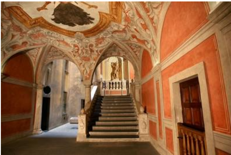
Grand vestibule d'entrée du palais Lascaris avec l'escalier monumental