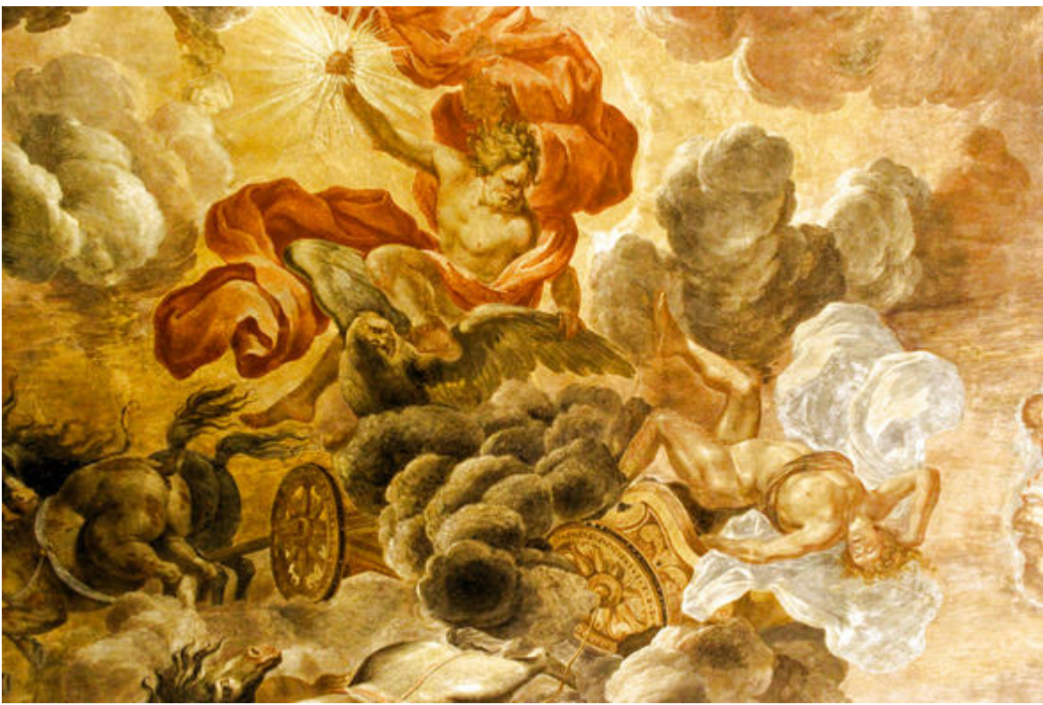
Le Palais Lascaris, vue de la scène principale du décor plafonnant du grand salon figurant le « Mythe de Phaéton »