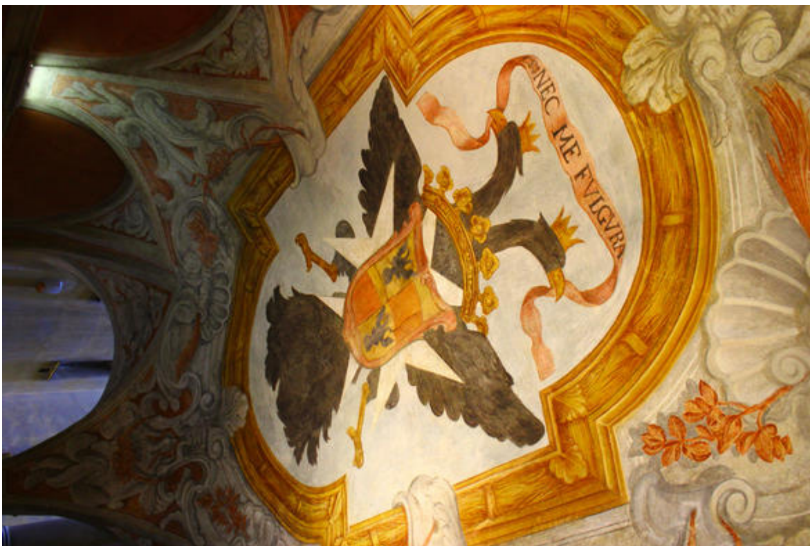
Vue du plafond du vestibule d'entrée du palais avec le cartouche figurant les armoiries de la famille Lascaris Vintimille avec leur devise « Nec me fulgura »