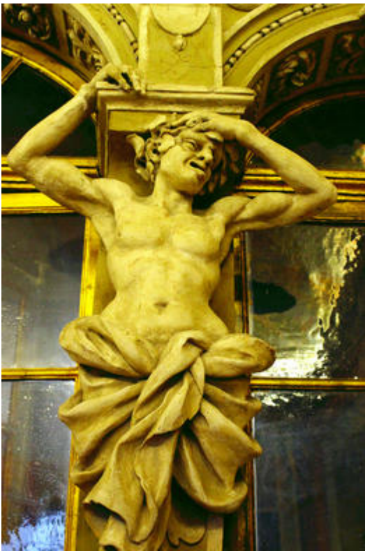
Le Palais Lascaris, détails d'un atlante en stuc de la chambre d' apparat