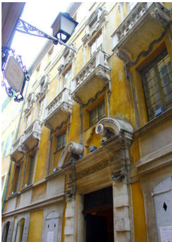
Vue de la façade principale du Palais Lascaris donnant sur la rue Droite