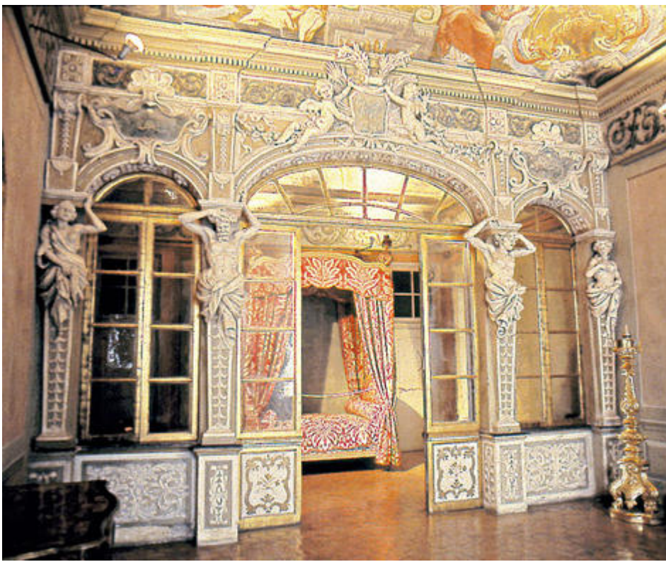
Le Palais Lascaris, vue de la chambre d' apparat et de la grande cloison vitrée formant un arc de triomphe