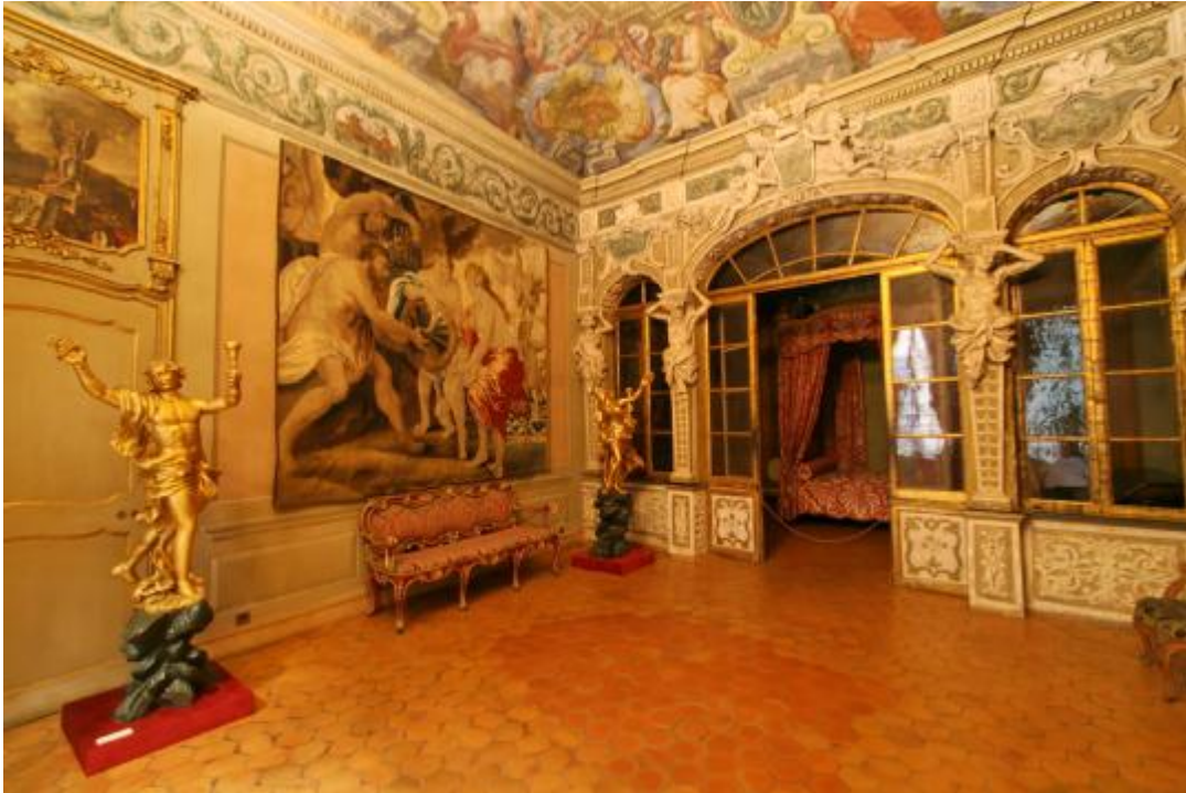
Le Palais Lascaris, vue de la chambre d' apparat

Le Palais Lascaris est une ancienne demeure aristocratique, située au cœur de la vieille ville niçoise. Classé au titre des Monuments Historiques depuis 1946, le palais Lascaris est un exemple brillant de l'architecture civile à l'époque baroque . Transformé en musée à partir de 1963, il abrite une des plus importantes collections d'instruments de musique anciens de France.