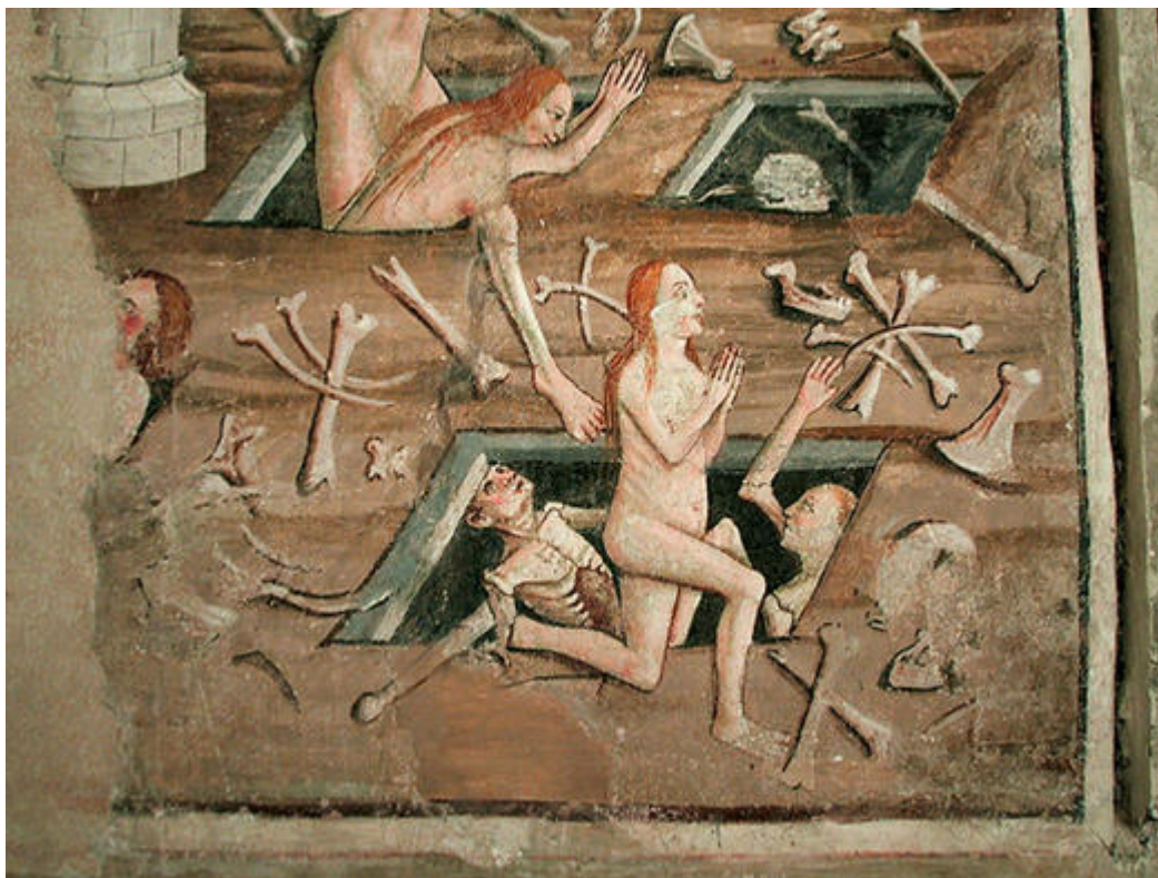
Les morts sortent de leurs tombeaux, détail du Jugement Dernier