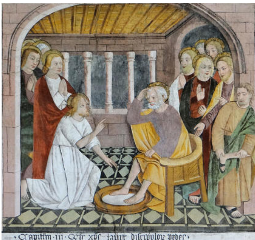
Scène du lavement des pieds, détail du cycle de la Passion