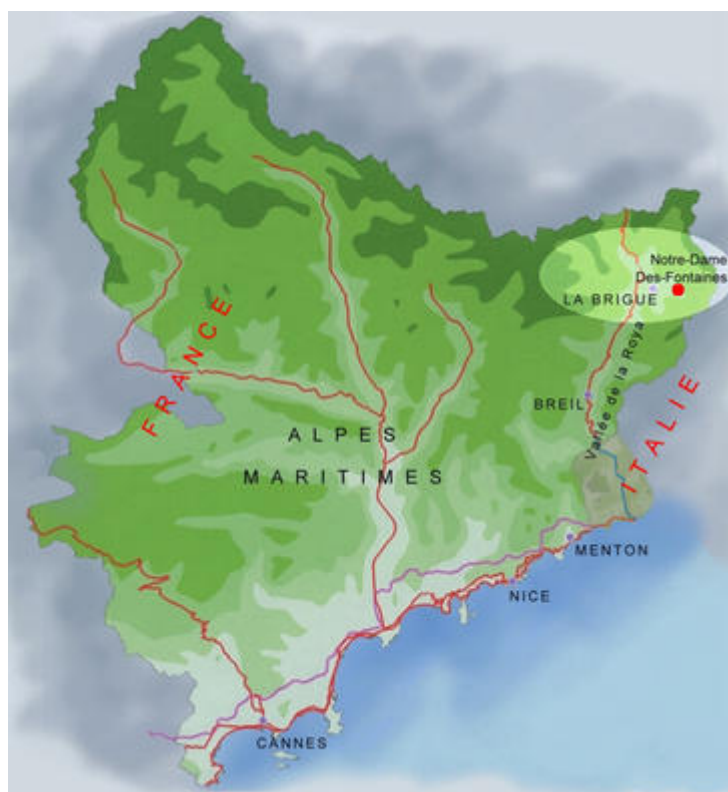
Carte des Alpes-Maritimes situant La Brigue et Notre-Dame-des-Fontaines