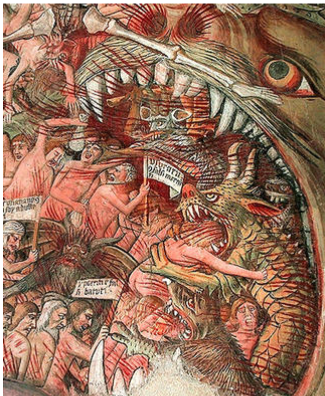
Le Léviathan , détail de la scène du Jugement Dernier