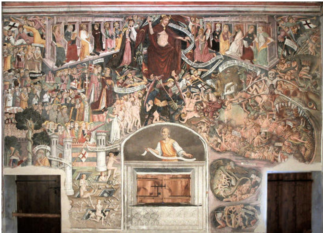
La scène du Jugement Dernier