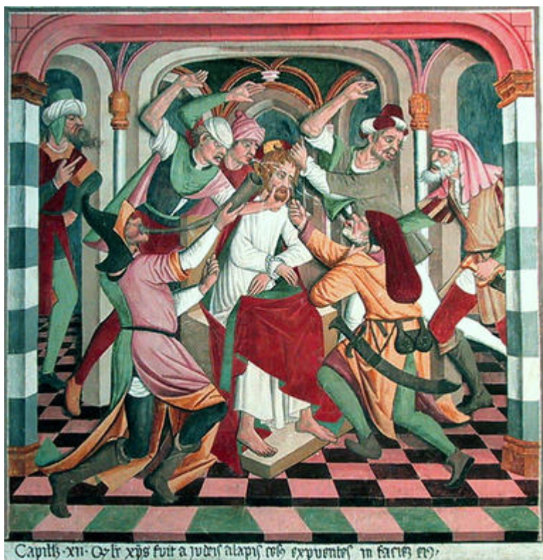
Le Christ aux outrages, scène du cycle de la Passion