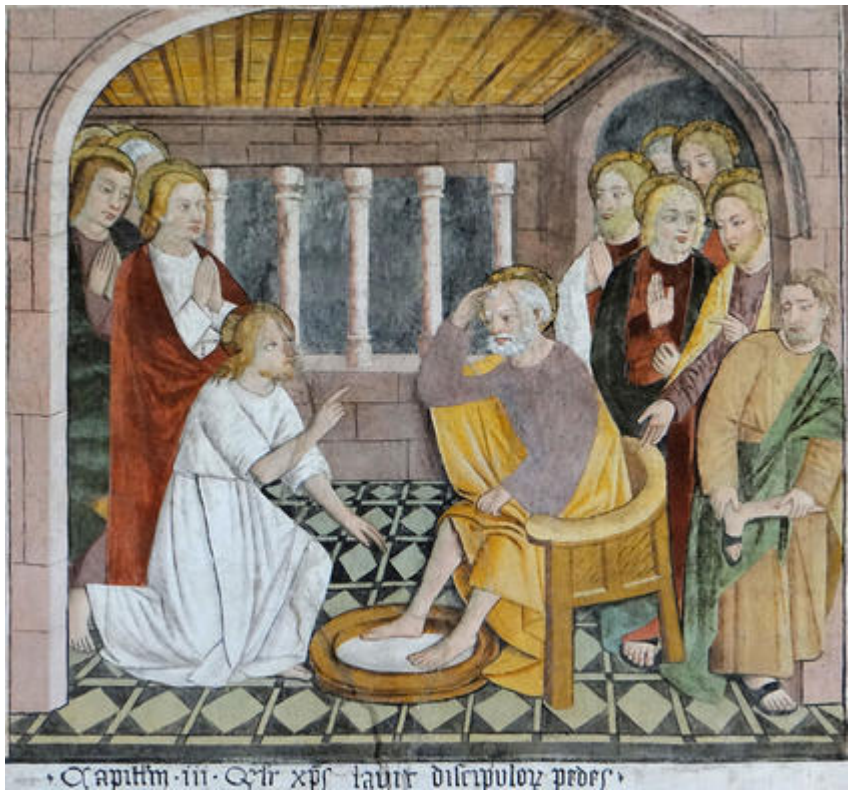
Scène du lavement des pieds, détail du cycle de la Passion