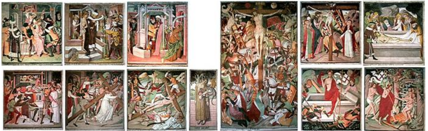
Panneaux de gauche du cycle de la Passion de la chapelle Notre-Dame-des-Fontaines