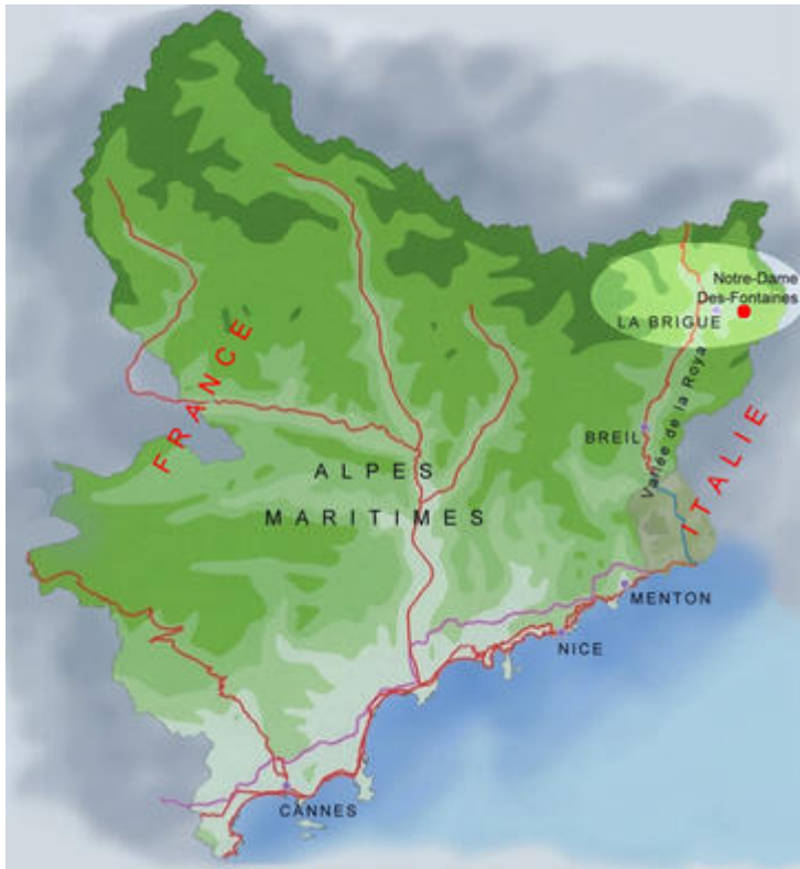
Carte des Alpes-Maritimes situant La Brigue et Notre-Dame-des-Fontaines