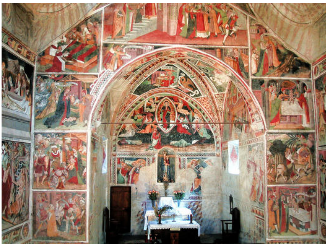
Vue d'ensemble des peintures du chœur de la chapelle de Notre-Dame-des-Fontaines