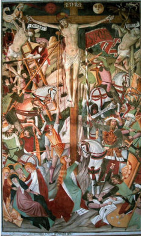
Scène de la crucifixion (détail du cycle de la Passion )

Notre-Dame-des-Fontaines est une chapelle située à La Brigue, dans la haute-Roya. L'intérieur de la chapelle est décoré de peintures murales réalisées par Giovanni Canavesio et Giovanni Baleison. Les peintures envahissent tous les murs et plongent le visiteur au cœur de multiples récits picturaux.