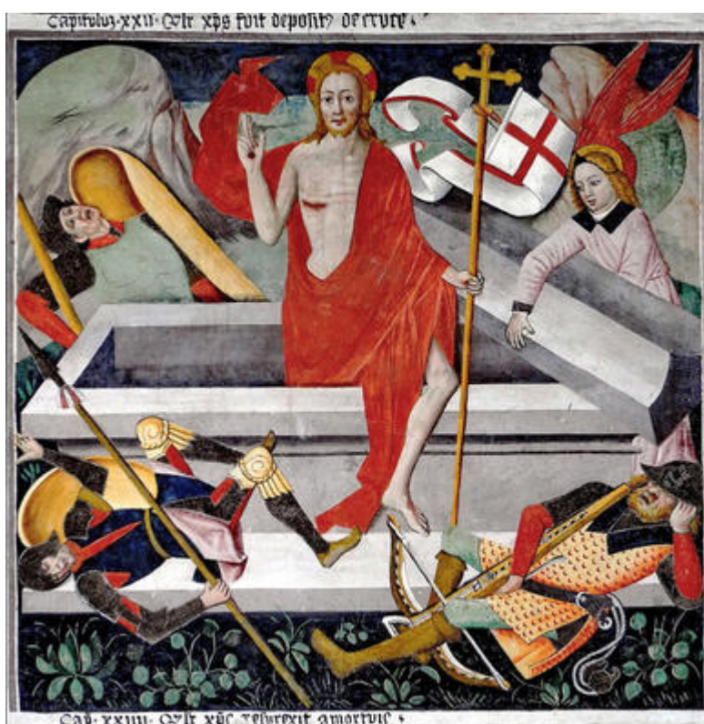
Scène de la résurrection du Christ (détail du cycle de la Passion )