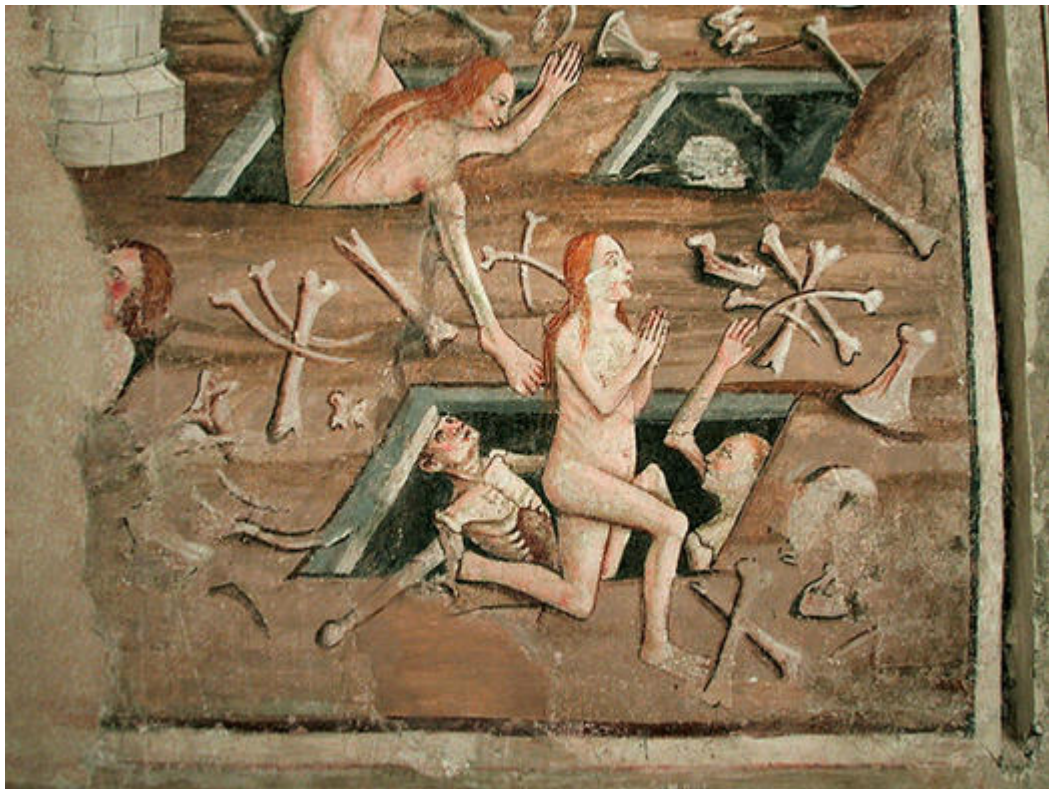
Les morts sortent de leurs tombeaux, détail du Jugement Dernier