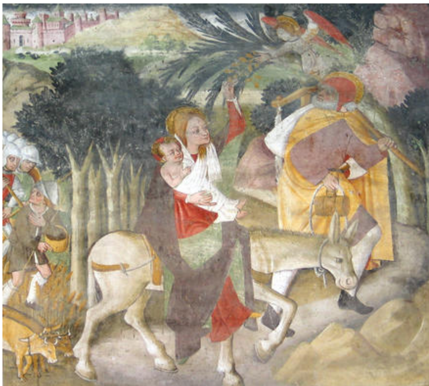
Vie de Marie et enfance de Jésus : La fuite en Egypte (scène du cycle de la Passion )