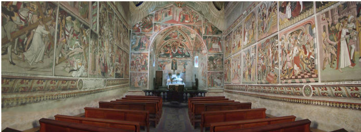
Notre-Dame-des-Fontaines, vue d'ensemble de l'intérieur de la chapelle