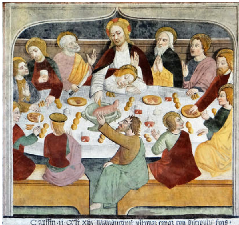
La Cène, dernier repas de Jésus avec les douze apôtres