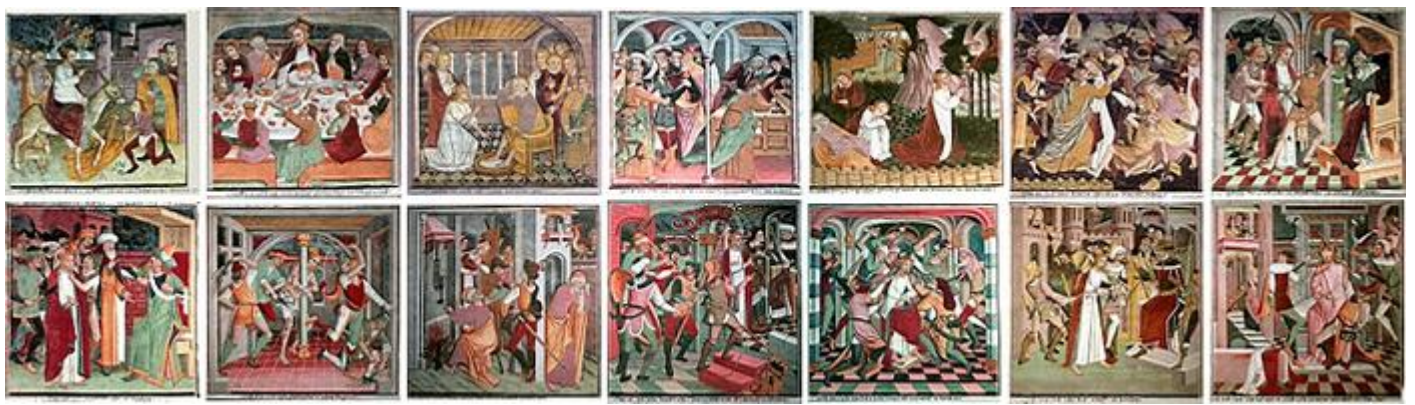
Panneaux de droite du cycle de la Passion dans la chapelle de Notre-Dame-des-Fontaines