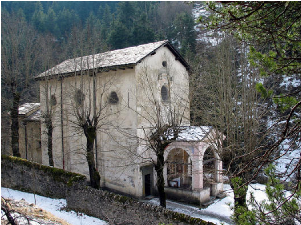
Vue extérieure du sanctuaire de Notre-Dame-des-Fontaines à La Brigue