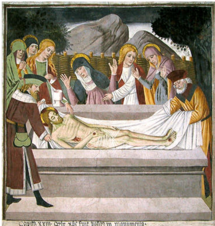
Scène de la mise au tombeau (détail du cycle de la Passion )