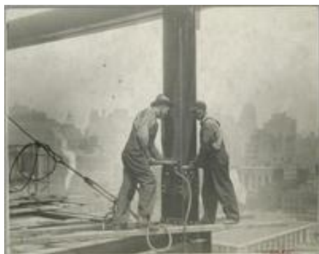
Construction de l'Empire State Building à New-York, 1930-1931,