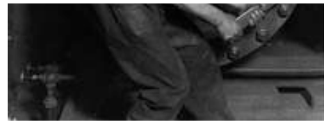
Power House mechanic working on steam pump, (mécanicien travaillant sur la pompe à vapeur), 1920, Photo de Lewis Hine

Construction de l'Empire State Building à New-York, 1930-1931, Photo de Lewis Hine