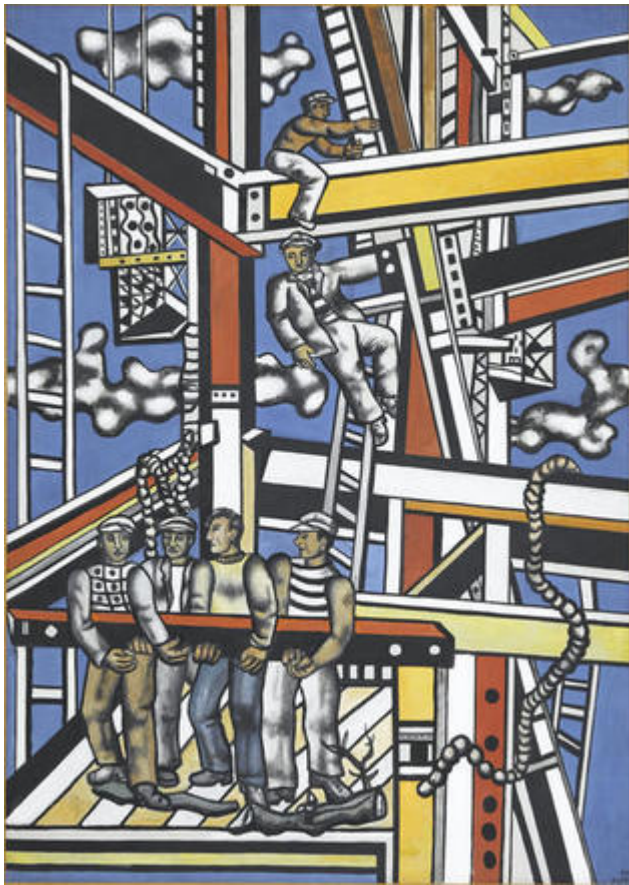
Les Constructeurs , 1950, Fernand Léger, Huile sur toile, 3,00 m x 2,28 m

Une très grande toile de 3 mètres de largeur sur 2,20 de hauteur, un ciel bleu absolu, sur lequel se détache un assemblage de poutres métalliques en train d'être assemblées par les constructeurs . La toile présente violente tension entre les hautes poutres de fer et les ouvriers minuscules plaqués sur le bleu cru du ciel.