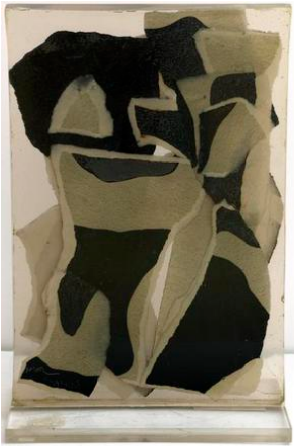
inclusion, Arman et André Verdet, 1965, 60 x 40 x 4 cm, collection du CIAC de Carros

Cette œuvre synthétise les préoccupations des deux artistes dans les années 1960 : les papiers déchirés, piégés dans la résine, proviennent d'une œuvre d'André Verdet, probablement d'une de ses séries intitulée Idoles , sortes de divinités solaires et nocturnes inspirées des rochers de sa Provence. Quant à la résine synthétique qu'utilise Arman, elle lui permet de concrétiser ses interrogations sur l'objet et les rapports qu'entretiennent les sociétés modernes avec lui grâce, notamment, à ses Accumulations .