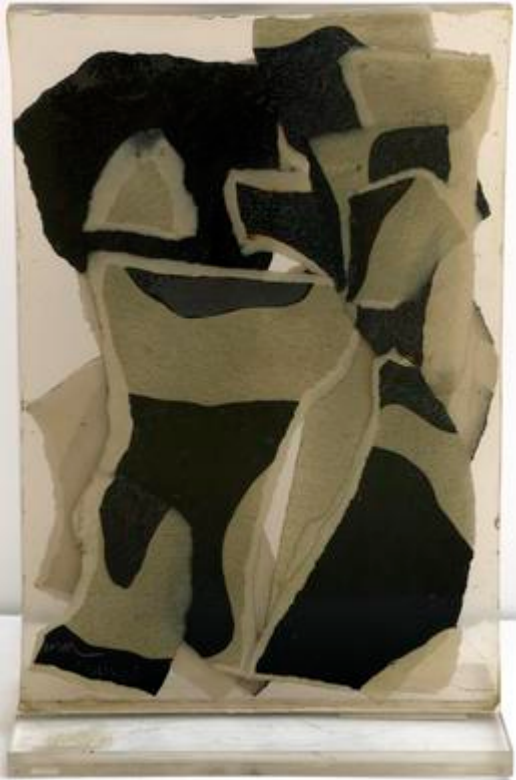
inclusion, Arman et André Verdet, 1965, 60 x 40 x 4 cm, collection du CIAC de Carros

André Verdet (Nice 1913- Saint-Paul 2004) était un poète, écrivain et artiste saint-paulois. Grand Prix des Poètes 2002 de la SACEM.