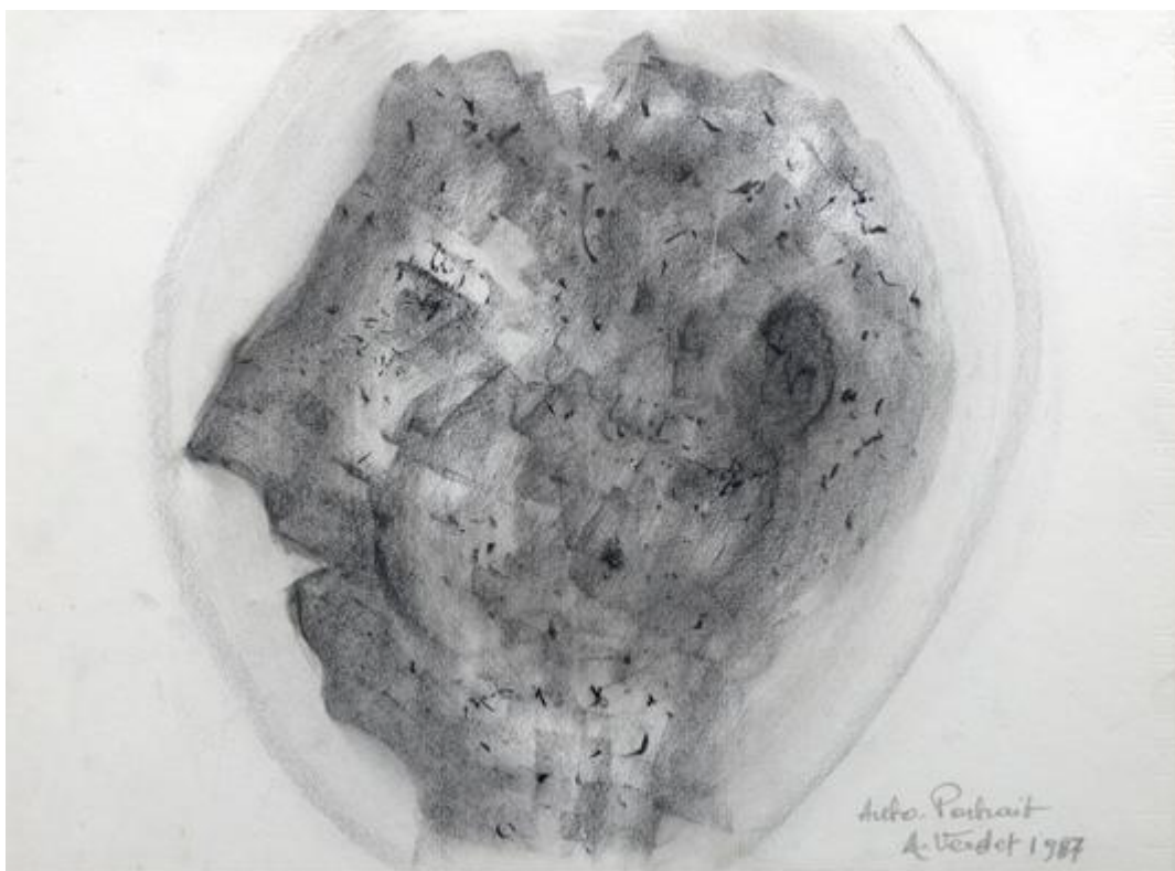
Auto-Portrait, André Verdet, 1987, mine de plomb sur papier, 34 x 46 cm.