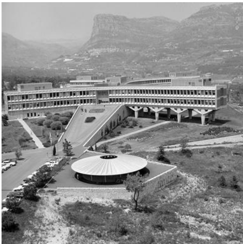
La Gaude. Société IBM (International Business Machine). Vue aérienne. daté du 30/06/1965