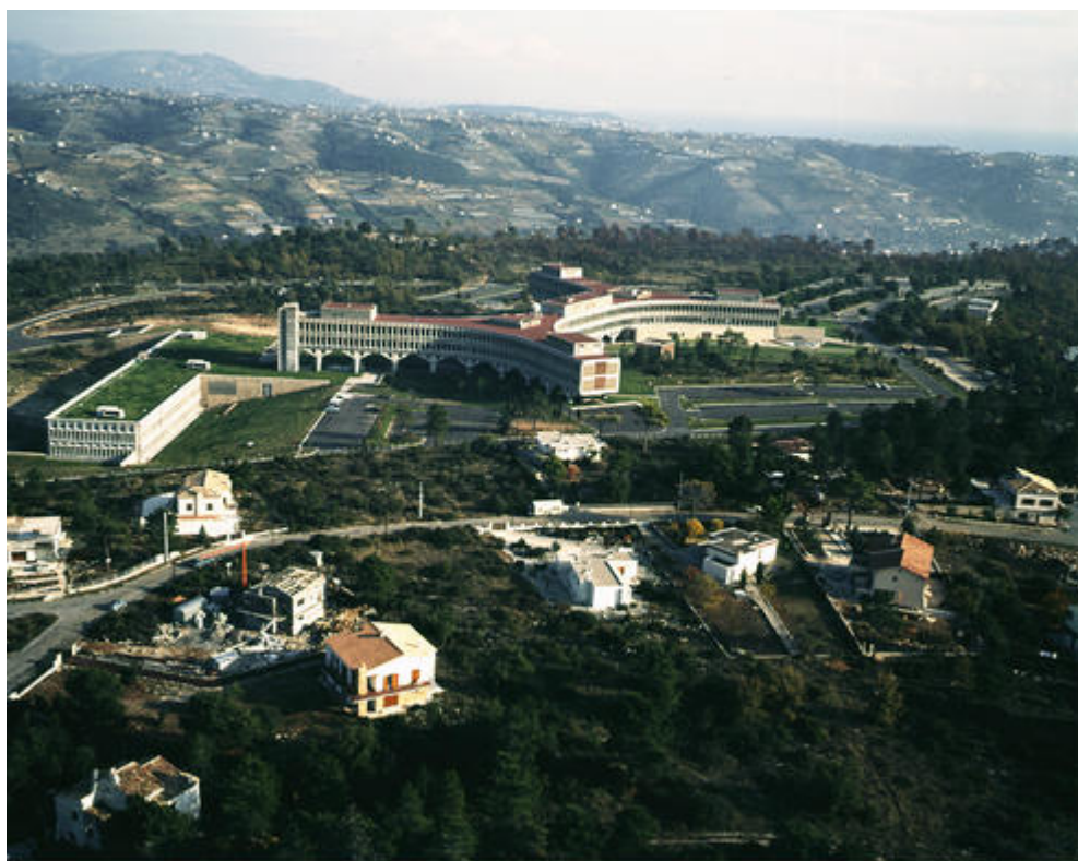
La Gaude. Centre d'études et de recherches IBM, vue aérienne, janvier 1971