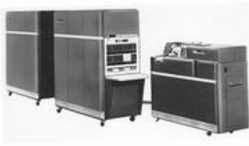
The Basic 650 Configuration. Premier ordinateur de l'entreprise commerciale d'IBM. 1955

Avec la calculatrice électronique 650, le règne des ordinateurs démarre, même si à l'époque, la taille des machines est conséquente. Le transistor permet de gagner en vitesse et en taille. Face à une croissance extraordinaire, IBM s'installe entre autre à La Gaude. Pour les télécommunications.