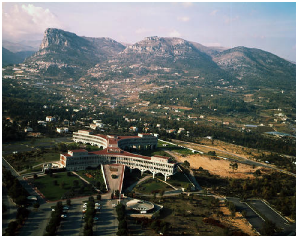
La Gaude. Centre d'études et de recherches IBM, vue aérienne, janvier 1971