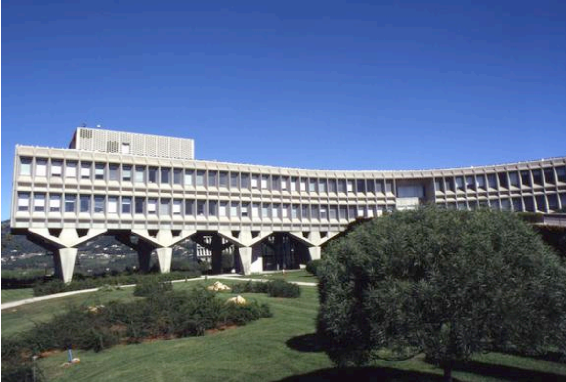
Le bâtiment d'IBM à La Gaude, architecte Marcel Breuer

IBM, fondée en 1911, est une multinationale américaine présente dans l'informatique. Inauguré en 1962, le Centre d'étude et de Recherche IBM La Gaude est un important laboratoire de recherche d'IBM. Réalisé par Marcel Breuer, grand architecte designer, le bâtiment est labellisé "Patrimoine du XX e siècle". Le site, devenu un centre de présentation de «Solutions Métiers IBM», déménage vers la future métropole de Nice fin 2015, début 2016.