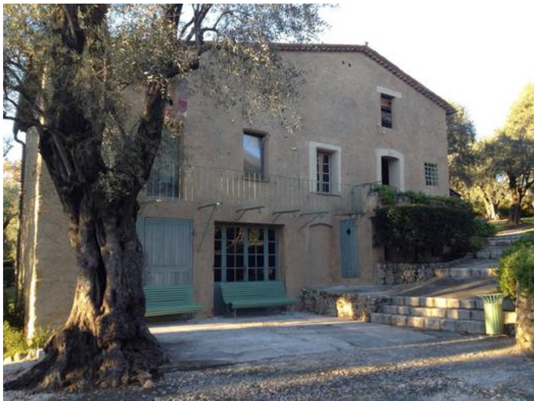
La ferme des Collettes à Cagnes-sur-Mer