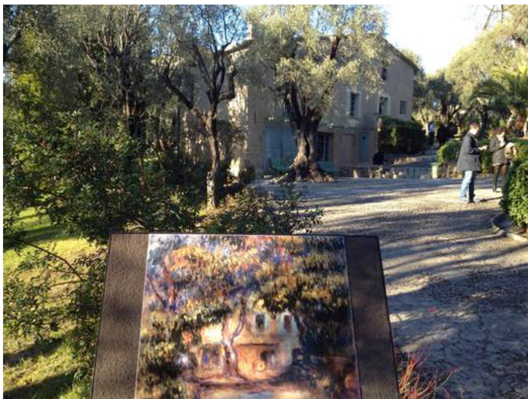
La ferme des Collettes à Cagnes-sur-Mer et une reproduction d'un tableau de Renoir en situation