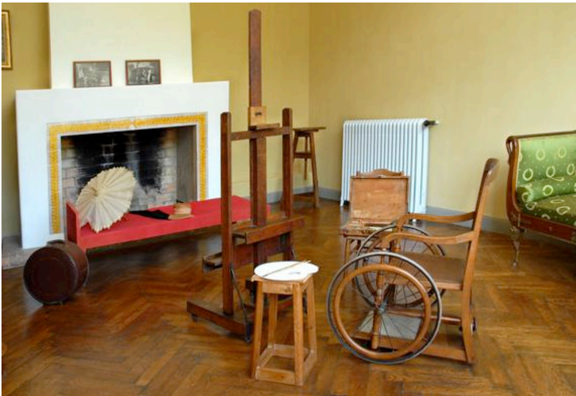
Vue de l'atelier du peintre dans la maison des Collettes