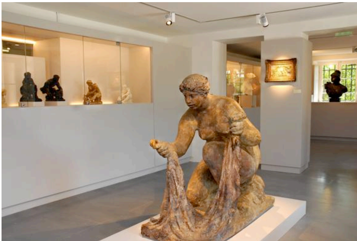
La salle des sculptures de l'artiste au musée Renoir Les Collettes