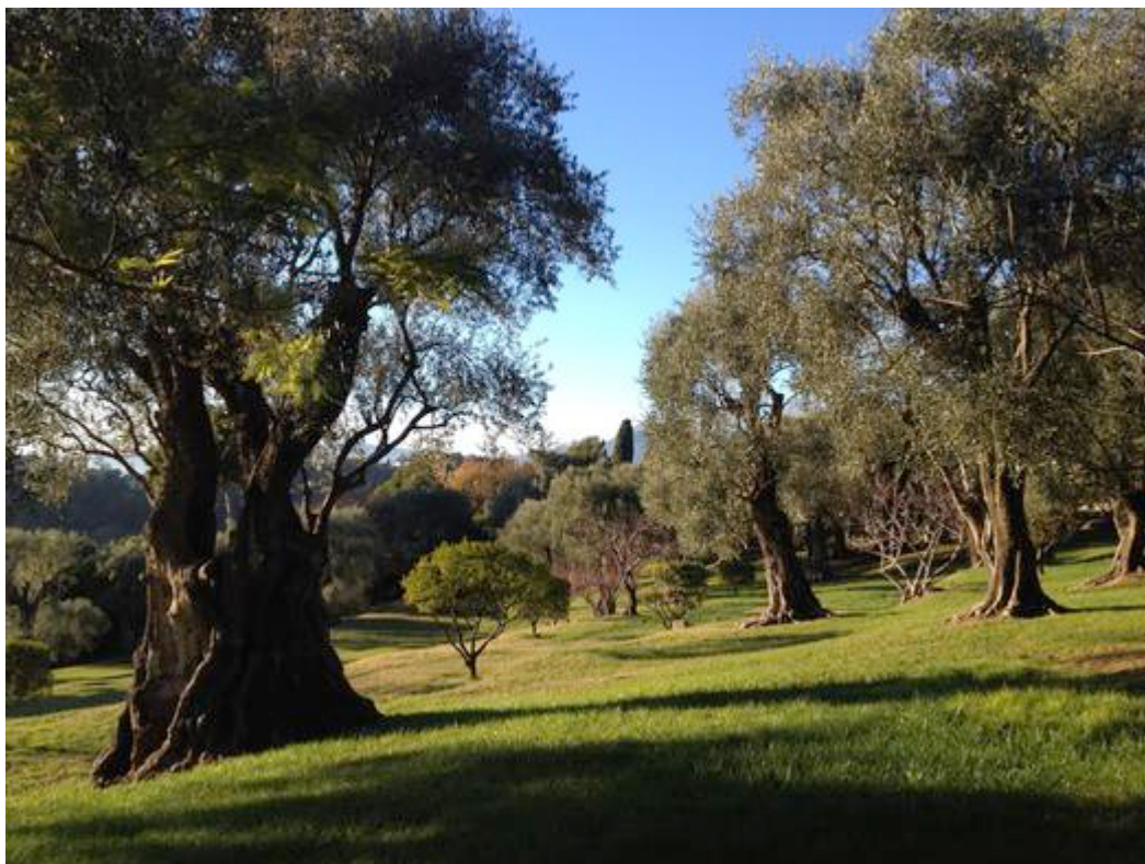
Le jardin des Collettes, l'oliveraie