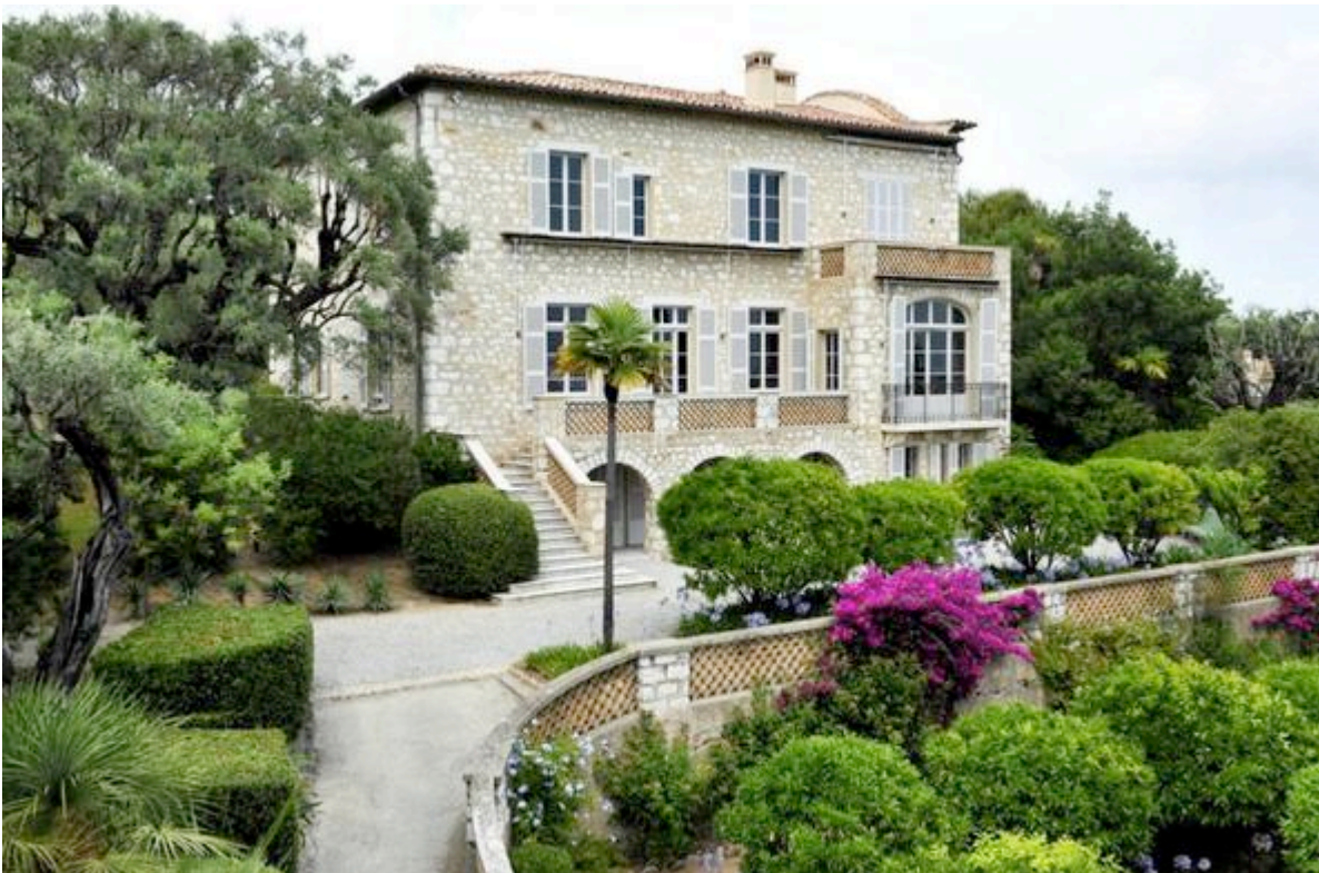
La maison des Collettes à Cagnes-sur-Mer

Les « Collettes » sont une entité à part entière : la maison, la ferme et le parc des oliviers contribuent tous ensemble à promouvoir la personnalité de Renoir.