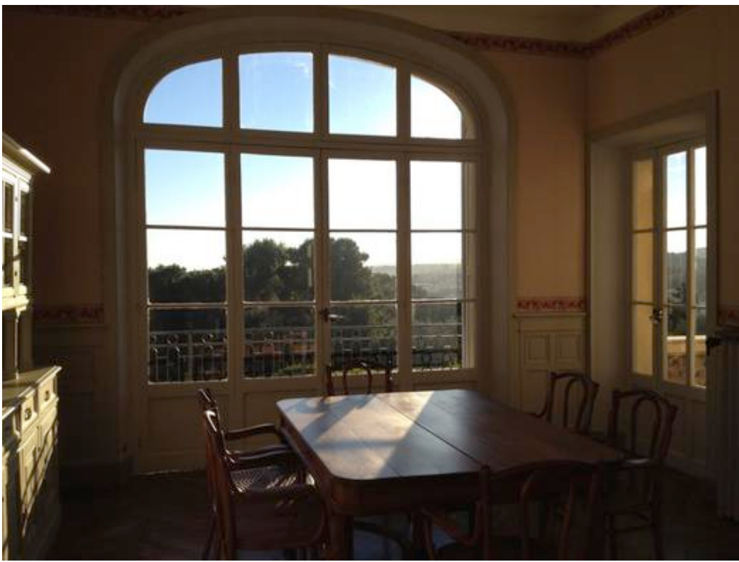
Vue de l'intérieur de la maison des Collettes