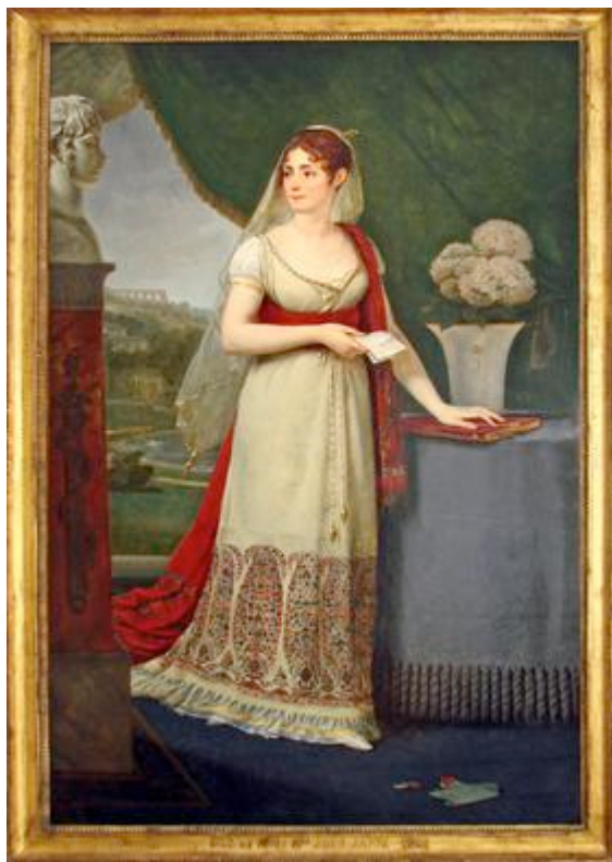
L'Impératrice Joséphine, huile sur toile de Antoine-Jean Gros, 1808