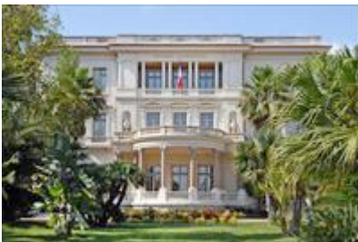
La façade sud du musée Masséna et la partie centrale du jardin

C'est en 1898 que la famille Masséna décide de la construction d'une magnifique villa sur le littoral azuréen. Celle-ci était plus particulièrement destinée à être la résidence hivernale de Victor Masséna, prince d'Essling, petit-fils du maréchal d'Empire niçois André Masséna.