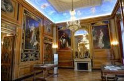
Grand Salon de la Villa Masséna

À la mort de Victor Masséna, son fils, qui hérite de la villa, décide de la léguer à la ville de Nice, à condition que celle-ci soit transformée en musée dédié à l'histoire locale. Le musée Masséna est inauguré en 1921.