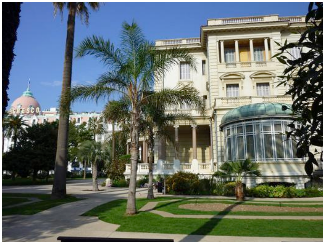
La Villa Masséna, au second plan l'Hôtel Négresco