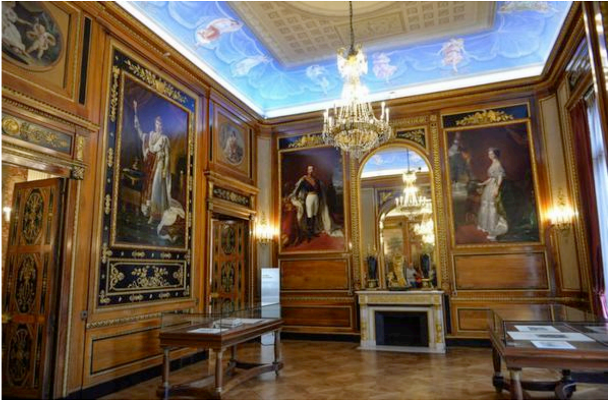
Grand Salon de la Villa Masséna