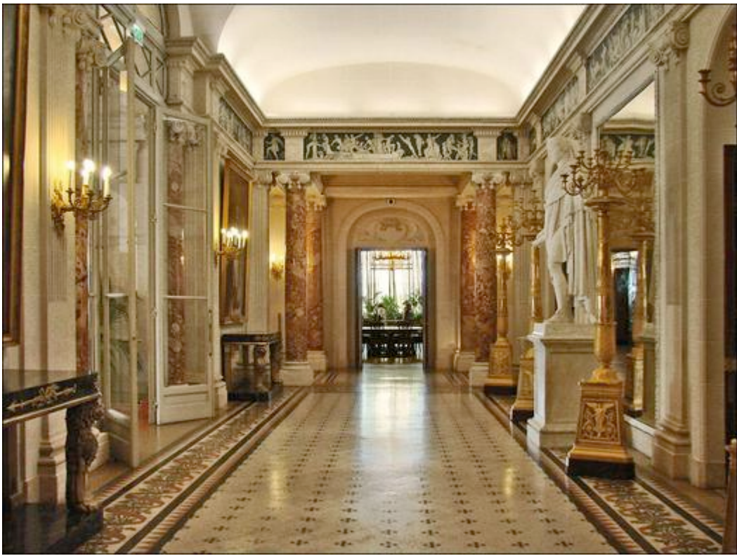
La grande galerie de la villa Masséna