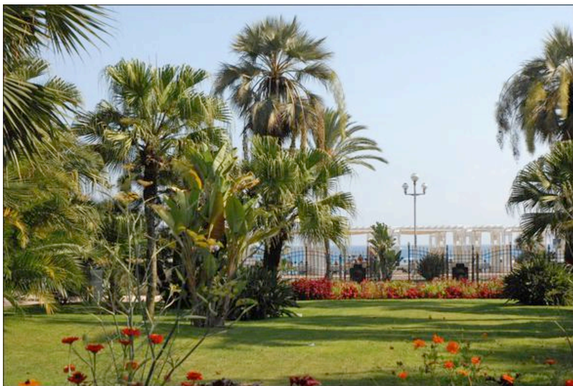
La partie centrale du jardin