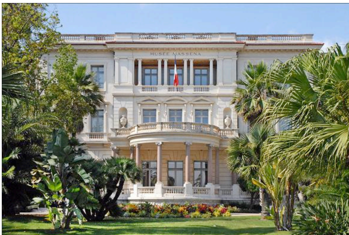
La façade sud du musée Masséna et la partie centrale du jardin

Installé dans une magnifique villa du XIX ème siècle située sur la Promenade des anglais, le musée Masséna, retrace, au travers de ses collections , l'art et l'histoire de la Riviera, de la fin du XVIII ème siècle jusqu'à la fin de la Belle Époque.