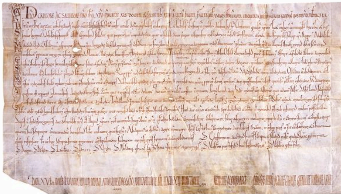
Reproduction photographique d'un parchemin. Donation de l'église Saint-Saturnin de Briançonnet à l'abbaye de Lérins par Constantin et sa femme Isingarde, 1022.