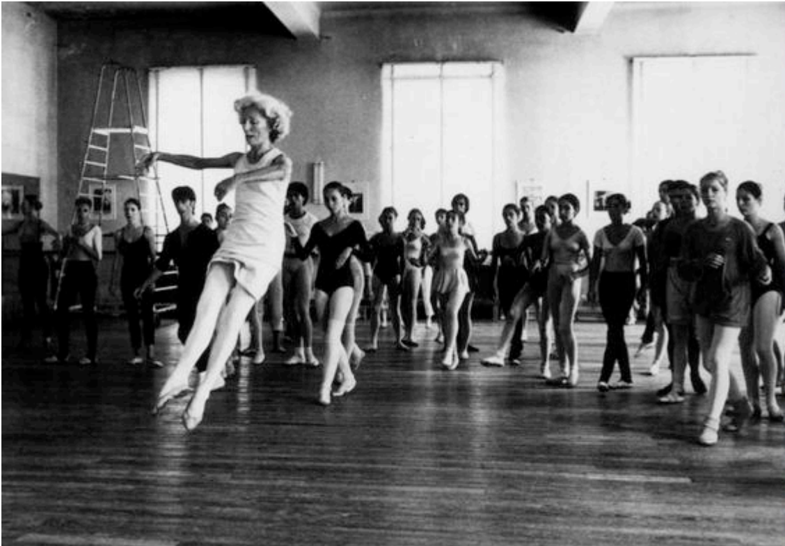
Rosella Hightower donnant un cours au grand studio du Gallia à Cannes

Rosella Hightower est la première ballerine qui ait gagné une place d'élite sur les scènes européennes. Elle est considérée comme l'une des plus célèbres danseuses de son temps. Au début des années 60, Rosella Hightower s'installe à Cannes et le Centre de Danse International Rosella Hightower ouvre ses portes à la rentrée 1961. En quelques années, l'école devient un centre de formation unique au monde. L'école fait partie aujourd'hui des plus grands centres de formation de danse dans le monde en classique, contemporain et Jazz .