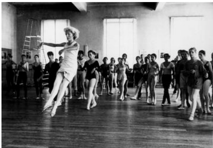
Rosella Hightower donnant un cours au grand studio du Gallia à Cannes