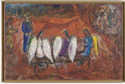
Abraham et les trois anges Marc Chagall 1952-1953, Huile sur toile

En 1966, Chagall fait don à la France de la série des grands tableaux du « Message Biblique », inspirés de la Genèse , de l' Exode et du Cantique des Cantiques . Cette série représente la synthèse de la réflexion spirituelle de Chagall : après les épreuves de la seconde guerre mondiale, de la Shoah et de l'exil, le peintre décrit un « rêve » qui n'est pas « celui d'un seul peuple, mais de l'humanité ».