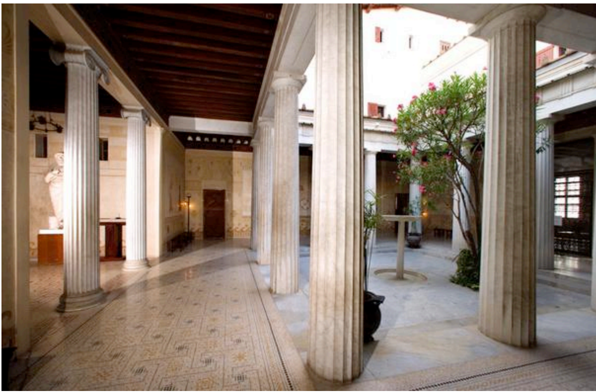
Le péristyle , villa Kerylos