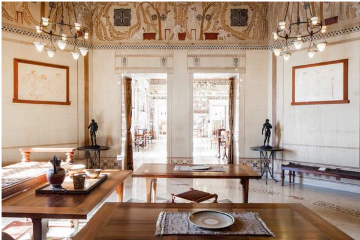
Le Triklinos, villa Kerylos