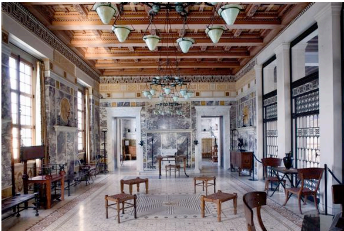
L'Andron, villa Kerylos