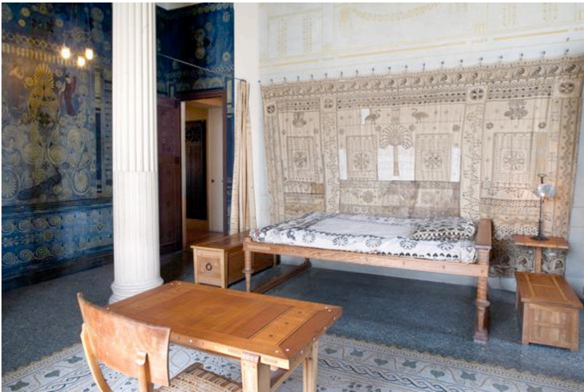
L'Ornithès, la chambre, signifie les oiseaux. Villa Kerylos