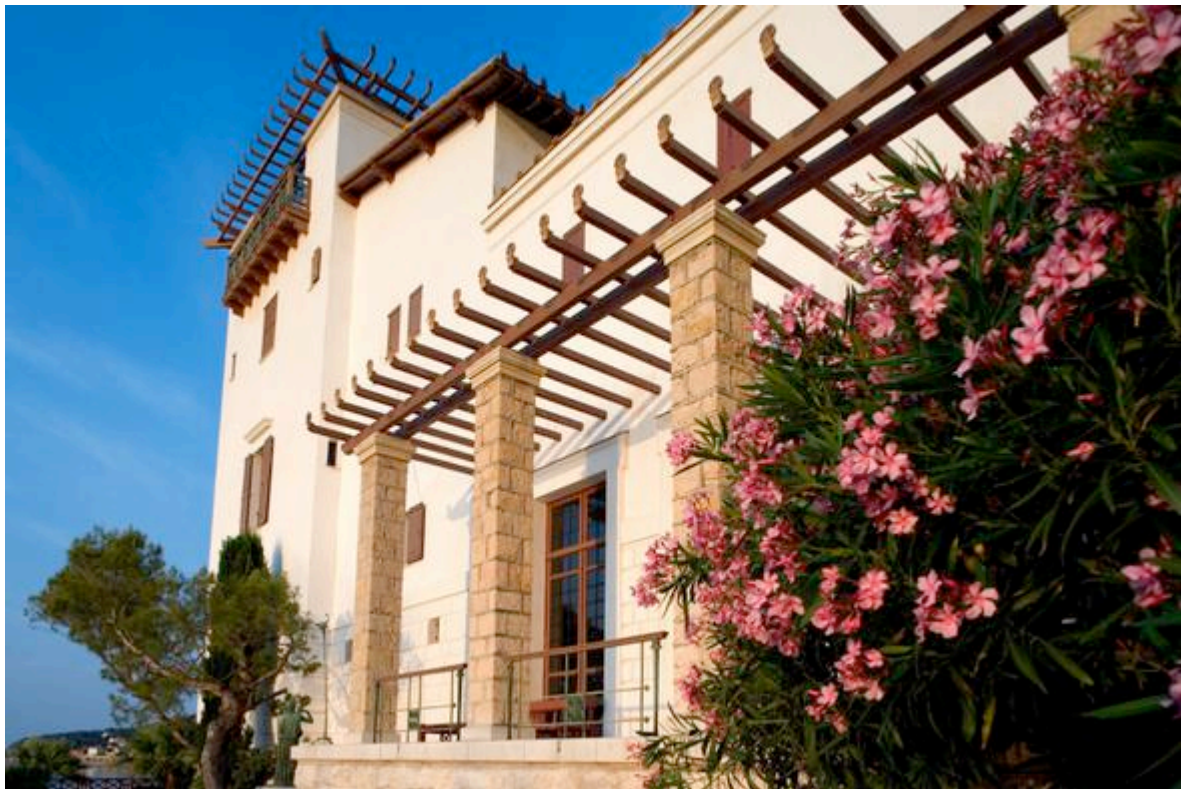
Vue extérieure, villa Kerylos