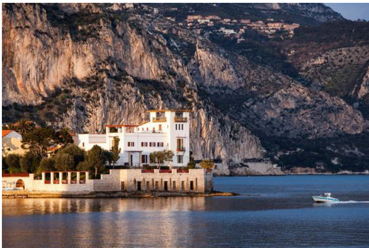
La villa Kerylos à Beaulieu-sur-Mer

Édifiée à la Belle Époque, La Villa Kerylos constitue l'un des monuments atypiques de la Côte d'Azur. Située à Beaulieu-sur-Mer, elle est la reconstitution originale d'une demeure grecque de l'Antiquité.