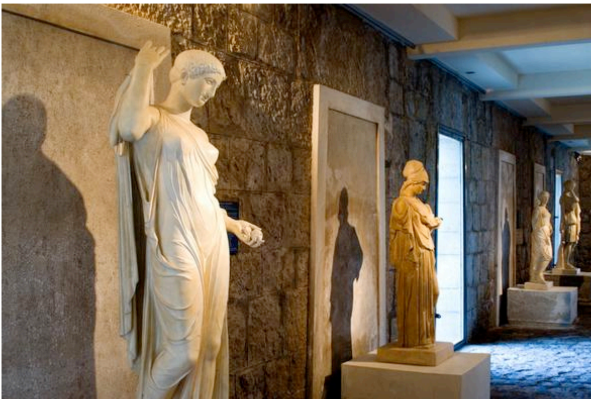
Galerie des antiques, villa Kerylos