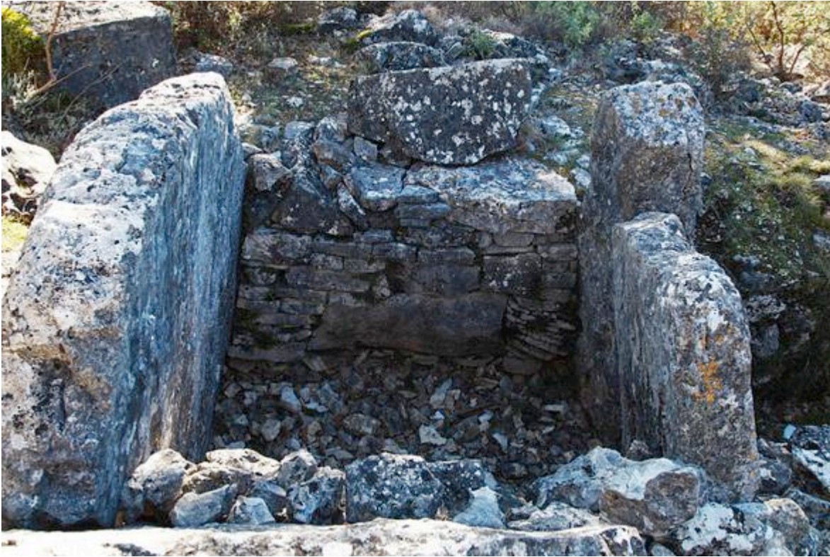
Dolmen des Puades , Saint-Cézaire-sur-Siagne

C'est au V ème millénaire avant J-C, sur la façade atlantique de l'Europe, qu'apparaissent les sépultures sous dalles, les tumulus longs, les tombes à couloir. Dans le sud-est de la France, ces sépultures prennent la forme de dolmens .