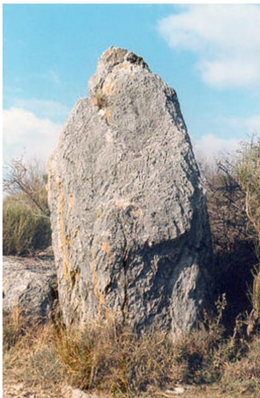
Menhir des Courmettes, Tourettes-sur-Loup

Agriculteurs, pasteurs et métallurgistes