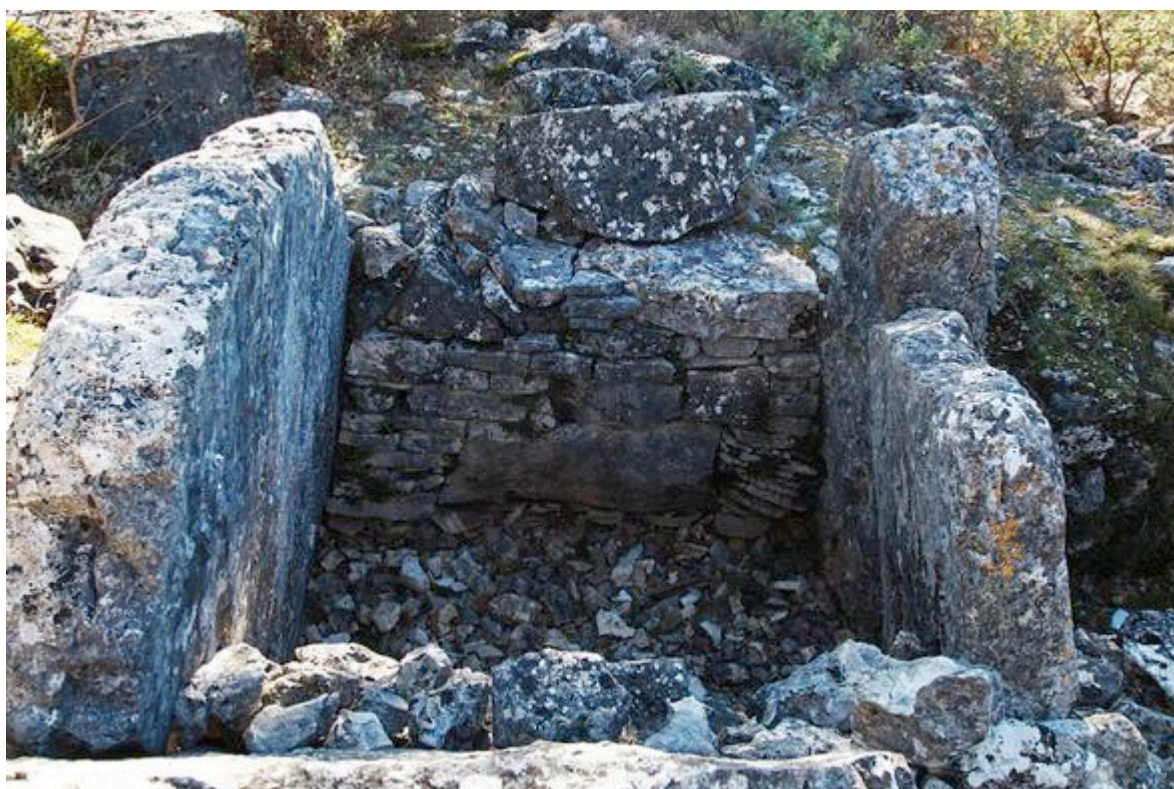
Dolmen des Puades , Saint-Cézaire-sur-Siagne

C'est au V ème millénaire avant J-C, sur la façade atlantique de l'Europe, qu'apparaissent les sépultures sous dalles, les tumulus longs, les tombes à couloir. Dans le sud-est de la France, ces sépultures prennent la forme de dolmens .