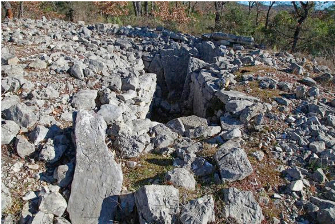
Dolmen de Mauvans sud, Saint-Cézaire-sur-Siagne