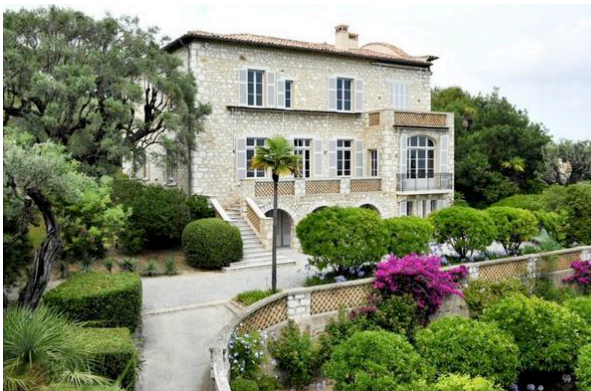
La maison des Collettes à Cagnes-sur-Mer

Les « Collettes » sont une entité à part entière : la maison, la ferme et le parc des oliviers contribuent tous ensemble à promouvoir la personnalité de Renoir.