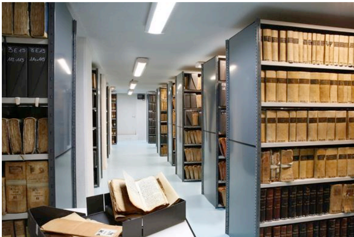
Un magasin d'archives dans le bâtiment des Archives départementales.

Les Archives départementales des Alpes-Maritimes, service du conseil départemental, conservent le patrimoine documentaire, écrit, iconographique et oral du département.