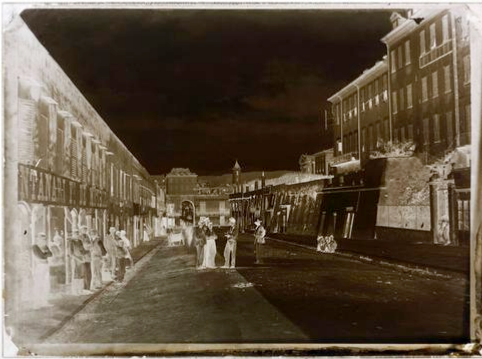
Reproduction photographique d'une plaque photographique en négatif. Plaque de verre représentant le quartier des Ponchettes à Nice, 1863-1865.