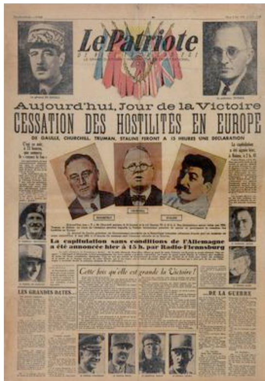
Reproduction photographique d'une page de journal. Une du journal Le Patriote , 8 mai 1945.