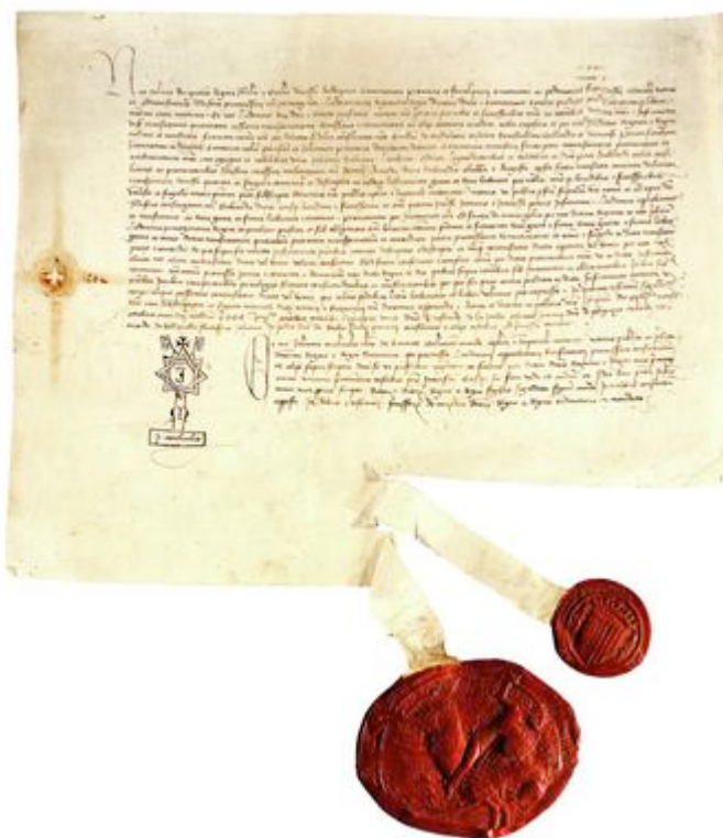
Reproduction photographique d'un parchemin. Acte de ratification par la reine Yolande et le roi Louis III du traité conclu avec le Duc de Savoie Amédée VIII lui reconnaissant la possession de Nice et des terres neuves de Provence, 1419.