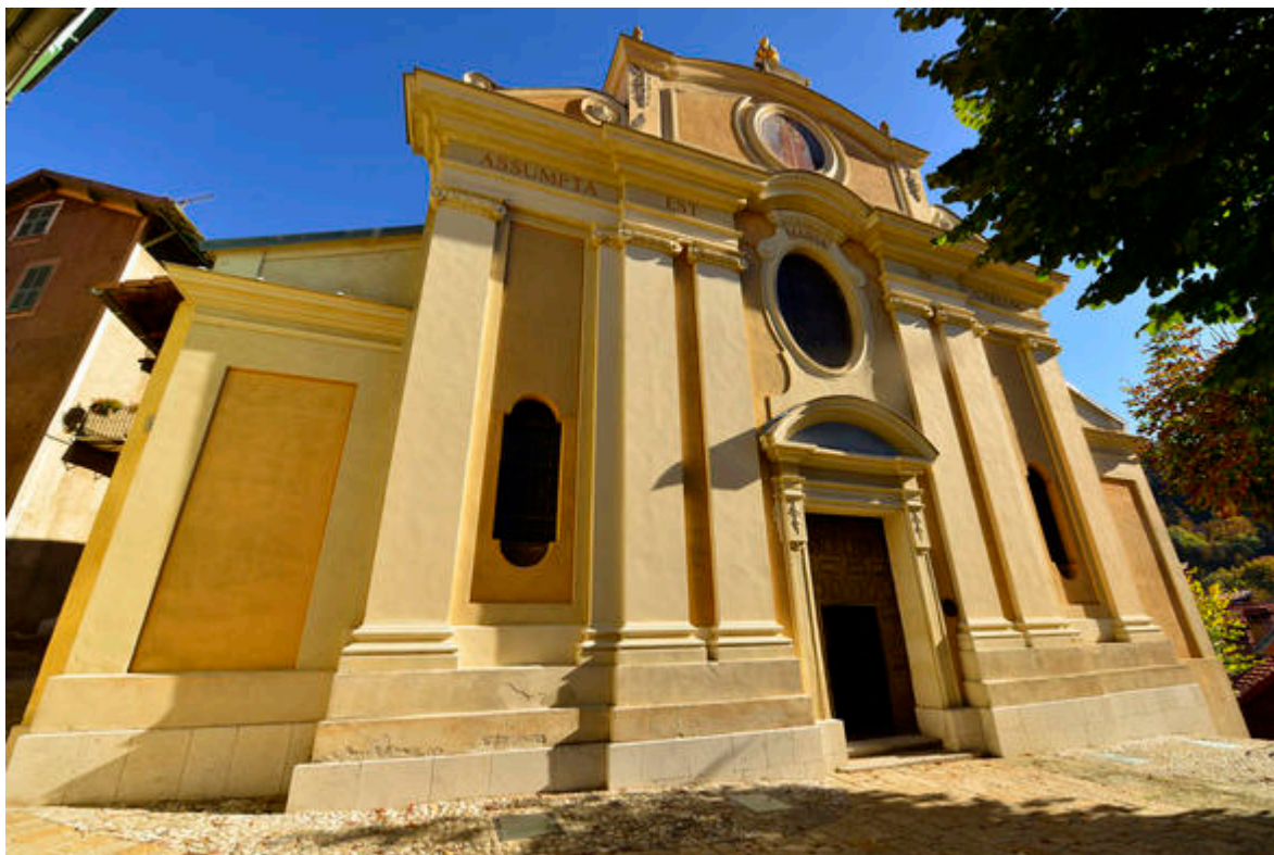
Vue de la façade