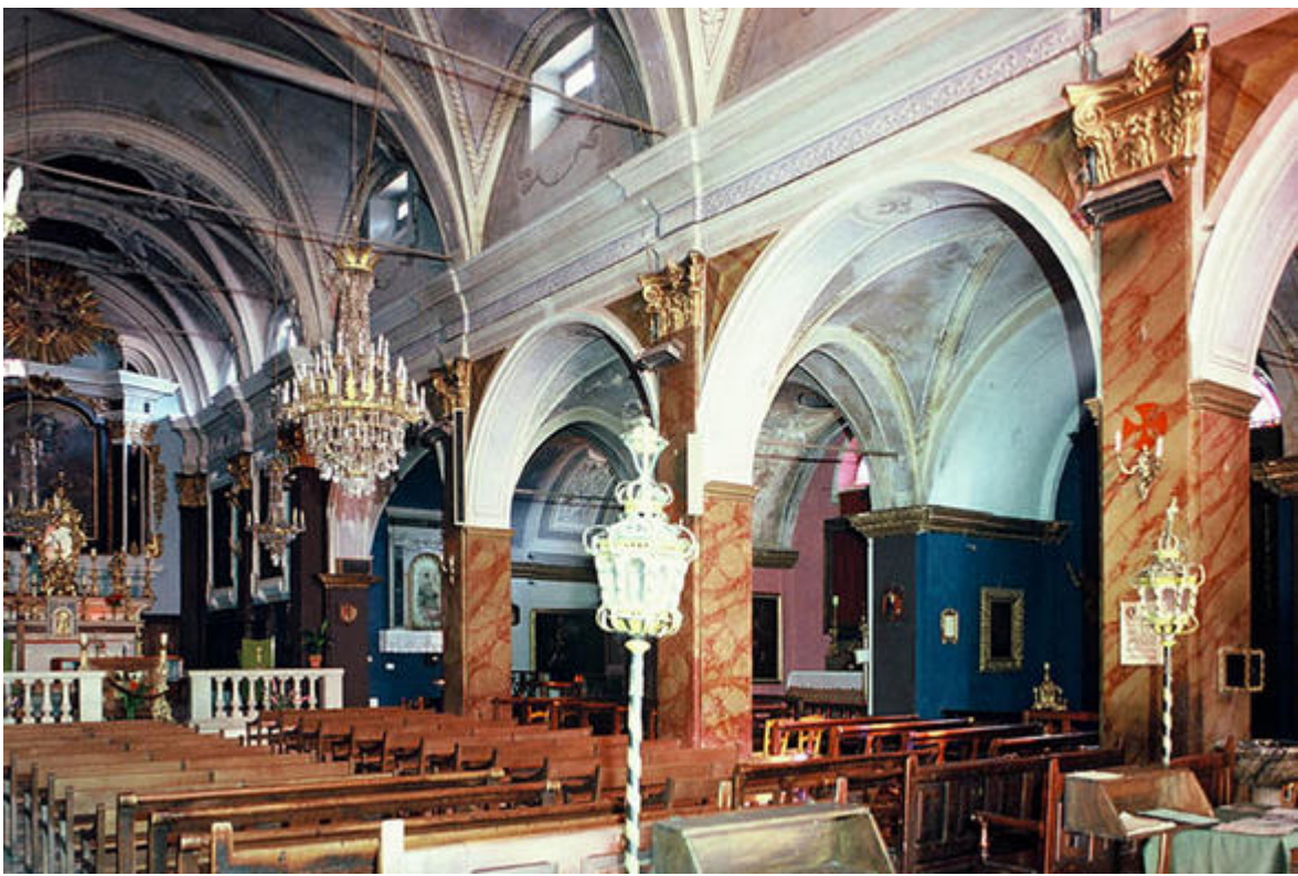
Vue du chœur et des nefs latérales