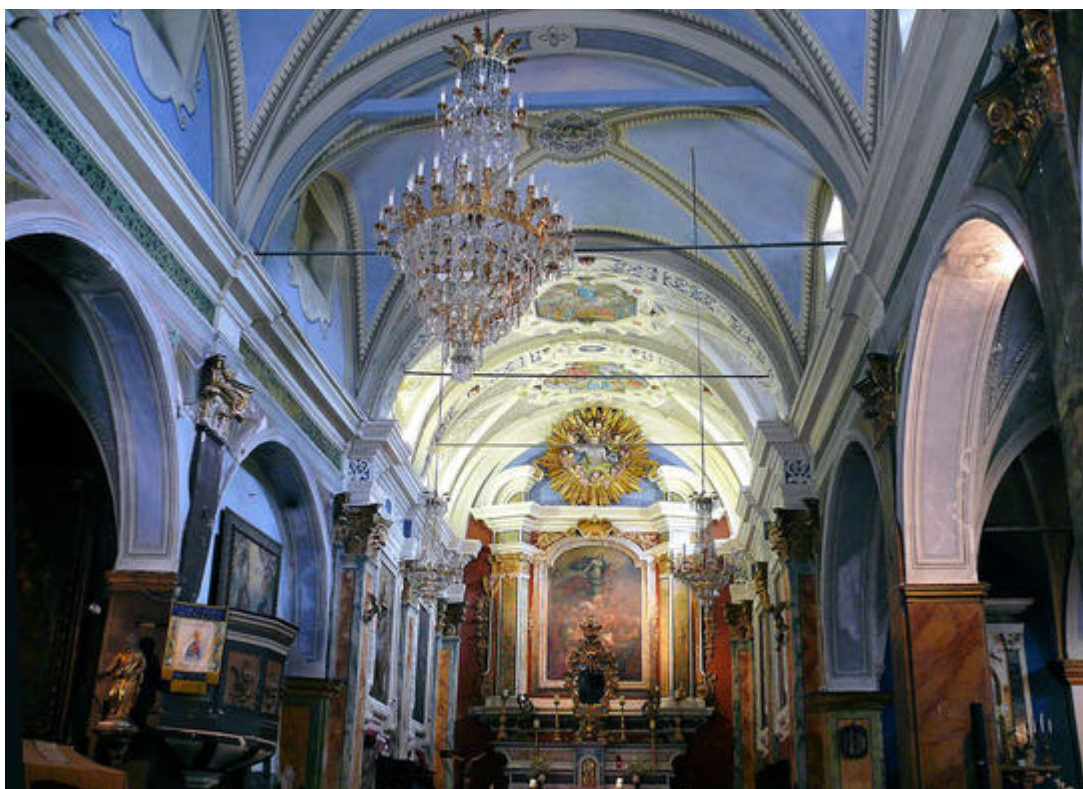
Vue de la n ef centrale