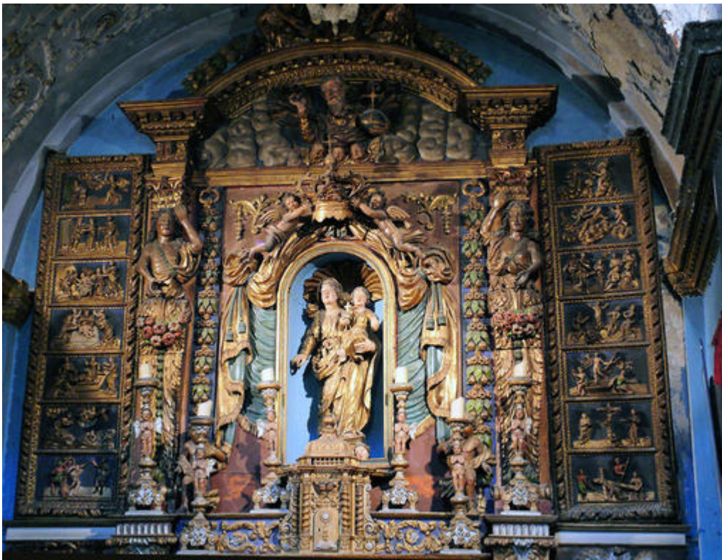
Retable du rosaire en bois sculpté, XVII e siècle, chapelle de Gubernatis dans l'église