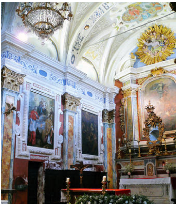
Vue du chœur