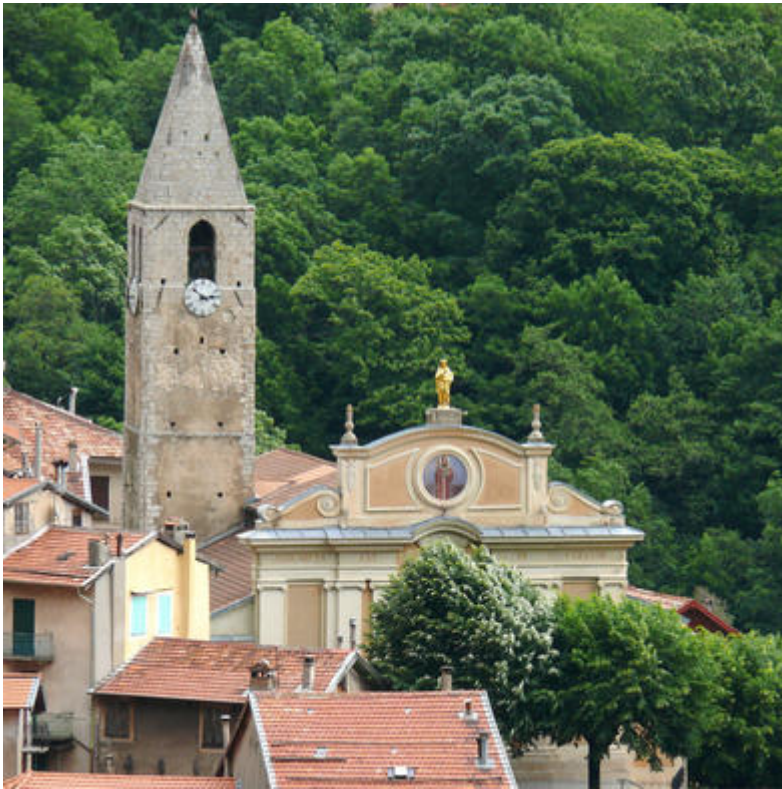
Vue de l'église

Les nombreuses églises de la Vésubie affirment la présence du sacré dans cette vallée et proposent un ensemble roman, gothique et baroque , du XIV e au XVIII e siècle. L'église Notre Dame de l' Assomption à Saint-Martin-Vésubie en est un exemple remarquable.