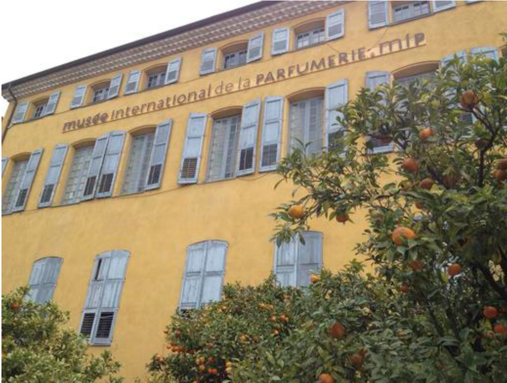
Le Musée International de la Parfumerie de Grasse

Créé en 1989 le Musée International de la Parfumerie, permet au visiteur de découvrir au travers d'une collection exceptionnelle, l'histoire du parfum de l'Antiquité à nos jours. Le musée se situe à Grasse, ville qui occupe une place primordiale dans le développement de la parfumerie contemporaine et de l'industrie de luxe du parfum depuis plus de deux siècles.