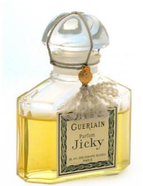
Jicky, créé par Aimé Guerlain en 1889, considéré comme le premier parfum "moderne" ( collection du Musée International de la Parfumerie).