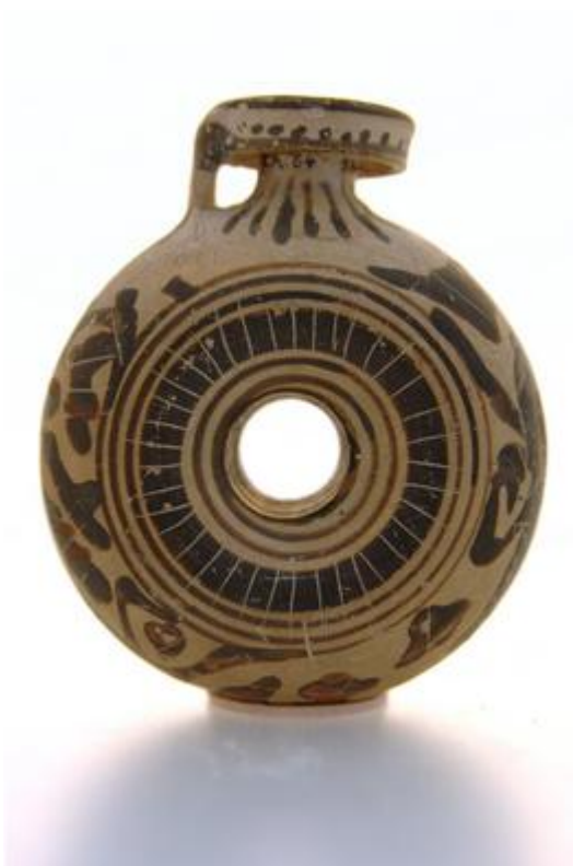
Aryballe (ou vase à parfum), VI e siècle av. J-C., Rhodes, utilisé notamment par les athlètes grecs pour stocker l'huile parfumée destinée aux soins du corps. Collection du Musée International de la Parfumerie.