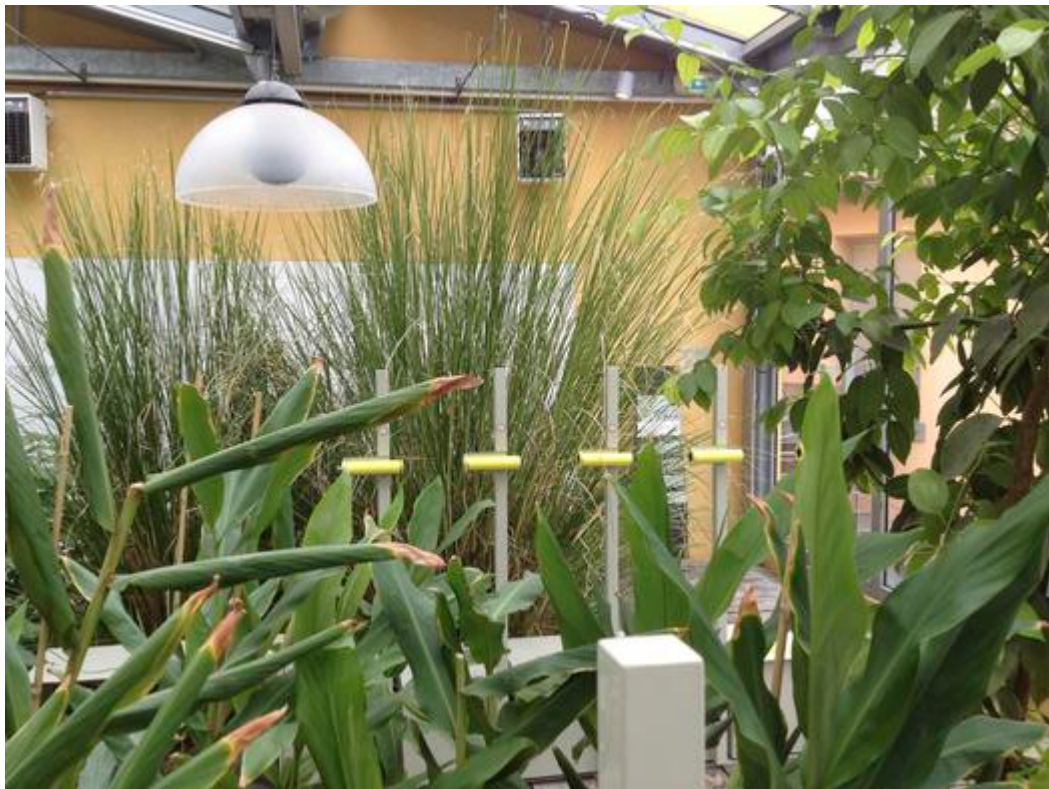
Vue de la serre intérieure du musée