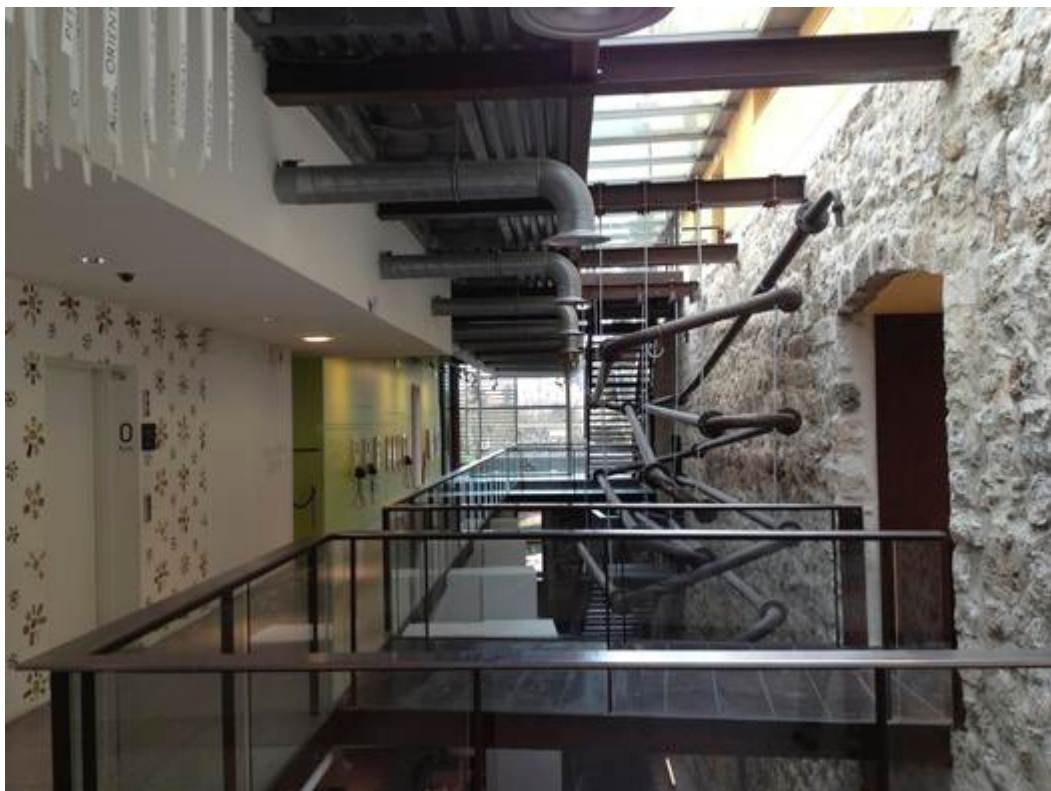
Vue intérieure du musée