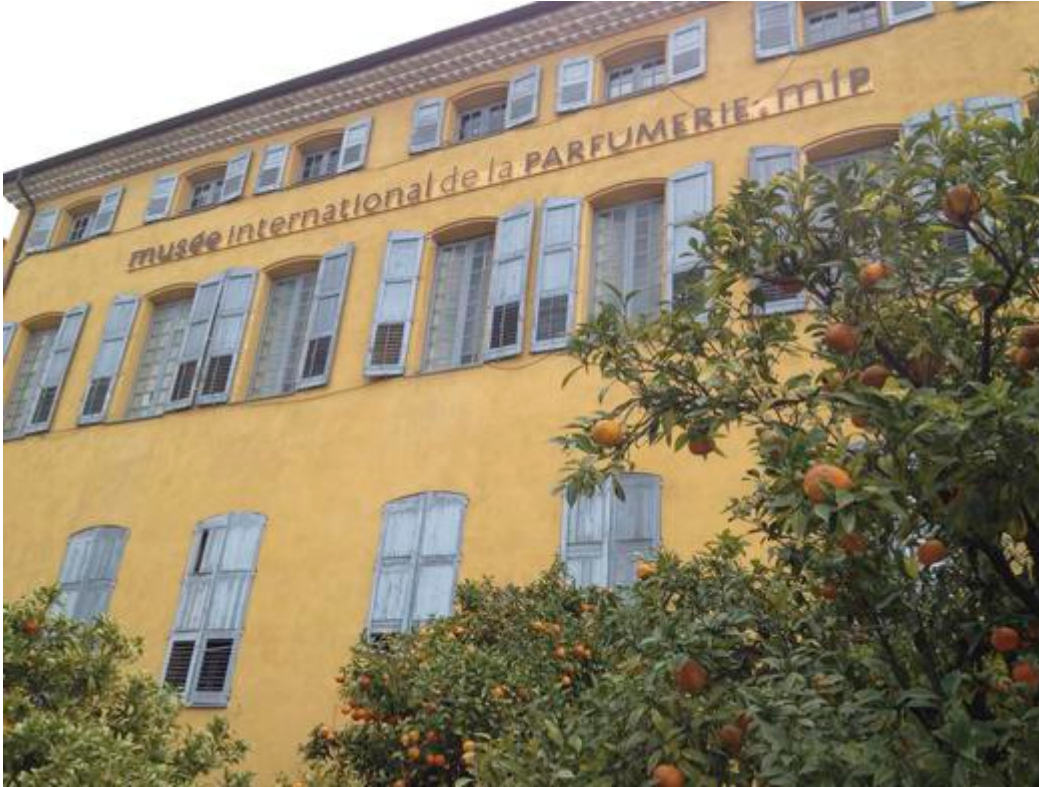
Le Musée International de la Parfumerie de Grasse

Créé en 1989 le Musée International de la Parfumerie, permet au visiteur de découvrir au travers d'une collection exceptionnelle, l'histoire du parfum de l'Antiquité à nos jours. Le musée se situe à Grasse, ville qui occupe une place primordiale dans le développement de la parfumerie contemporaine et de l'industrie de luxe du parfum depuis plus de deux siècles.