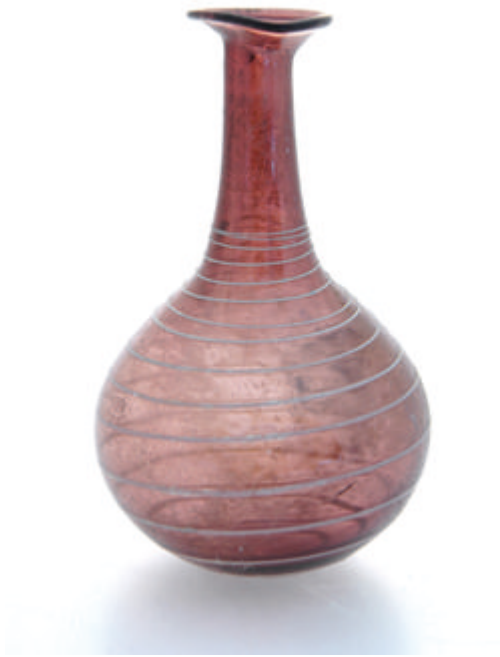
Flacon piriforme, Ile - Ille s, Syrie, Verre soufflé, Musée International de la Parfumerie de Grasse