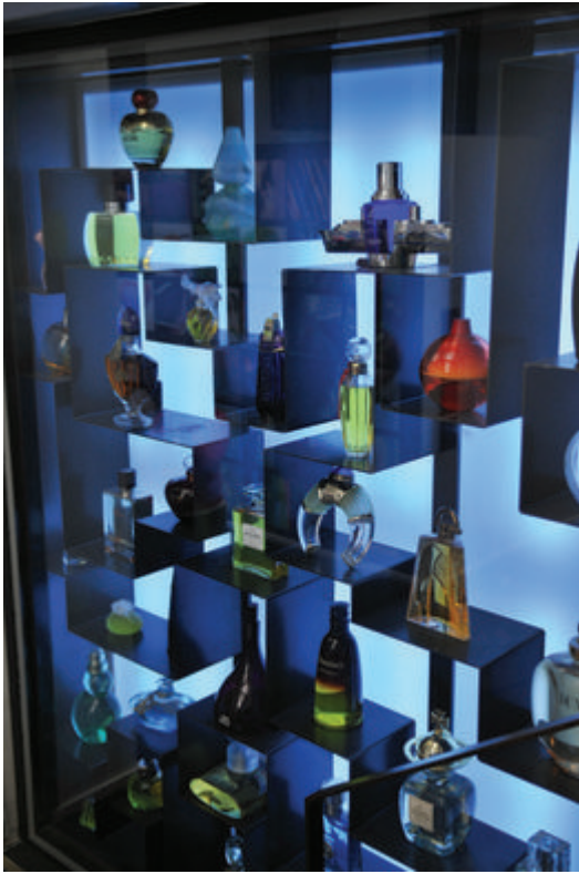
Vue intérieure, Musée International de la Parfumerie de Grasse