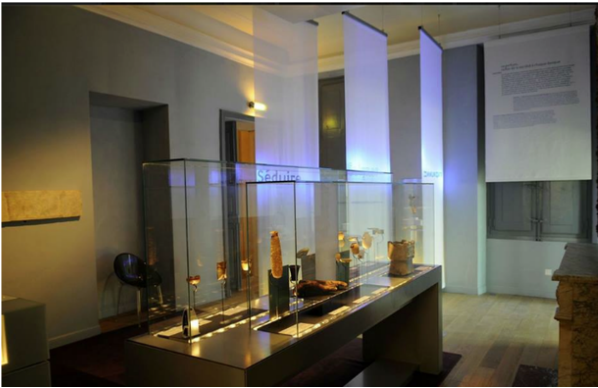
Les collections du musée