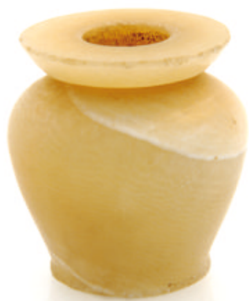
Pot à onguent, Moyen Empire, Egypte, Albâtre taillé, poli, Musée International de la Parfumerie de Grasse