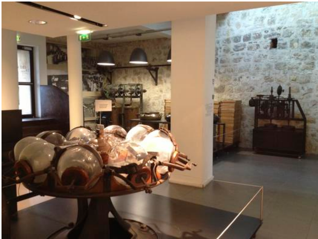
Les collections du musée