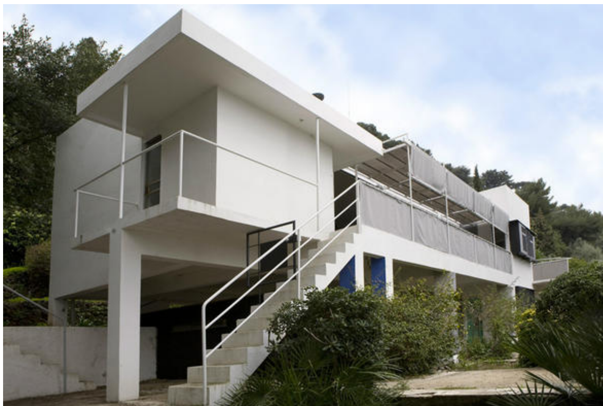
Vue générale de la villa E1027, © Conseil général des Alpes-Maritimes.

Sur la Riviera française, entre Menton et Monaco, la commune de Roquebrune-Cap Martin a la chance de compter, sur son territoire, deux Monuments Historiques, tous deux devenus des icônes du patrimoine architectural du XX e siècle : le cabanon de Le Corbusier (en passe d'être classé « patrimoine de l'humanité » par l'Unesco) et la villa E 1027 d'Eileen Gray.