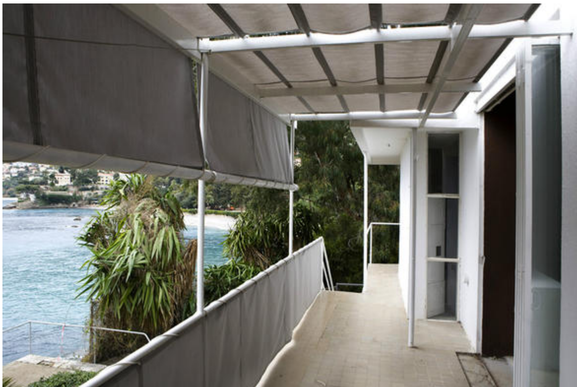
Terrasse extérieure du salon de la villa E1027. Elle est située côté mer. On distingue la baie vitrée ouverte en accordéon du salon.