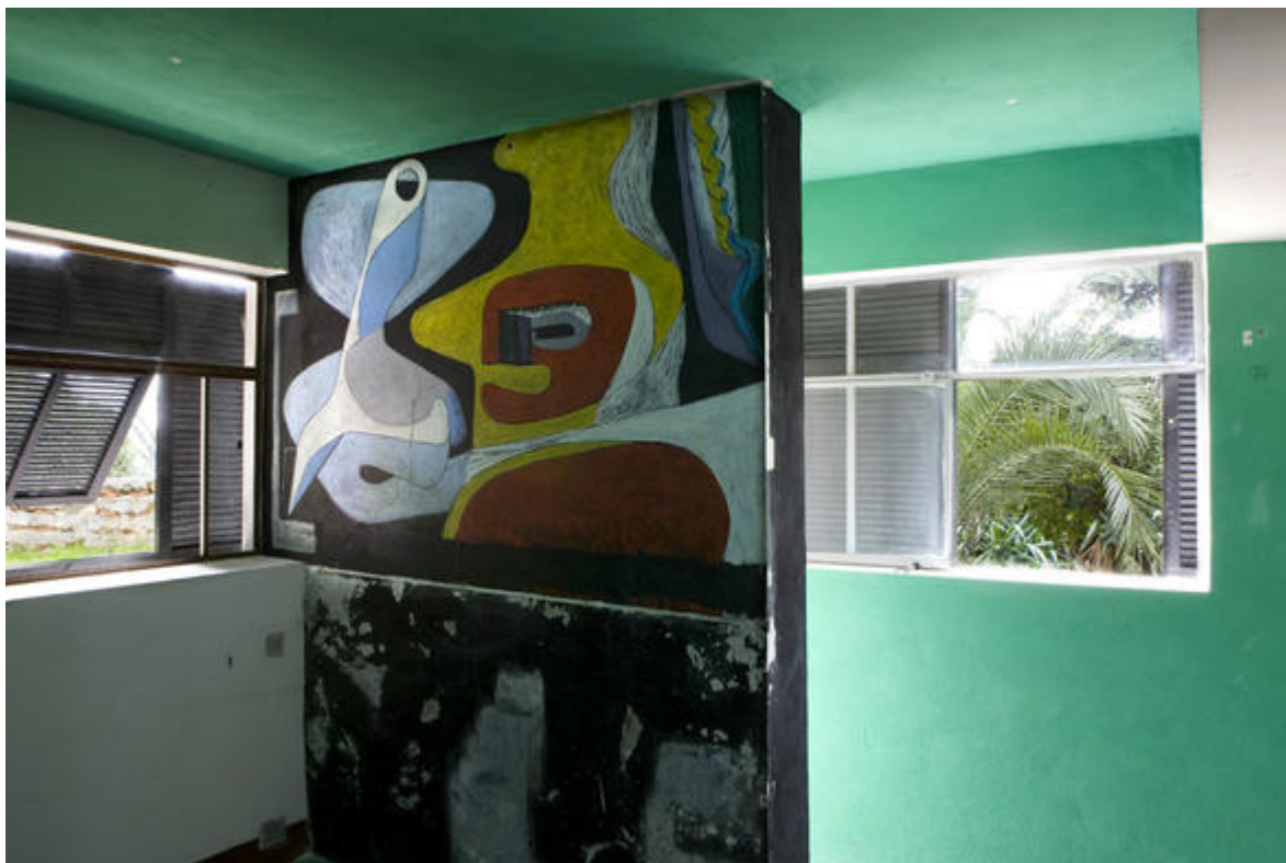
Grande chambre située au rez-de-chaussée de la villa E1027. Vue sur la fresque de Le Corbusier. Elle donne sur le jardin de la villa.