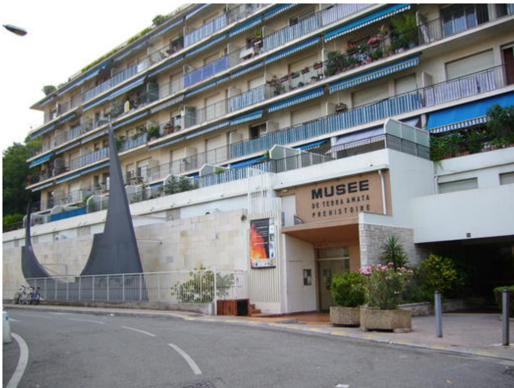
Entrée du Musée de Terra Amata