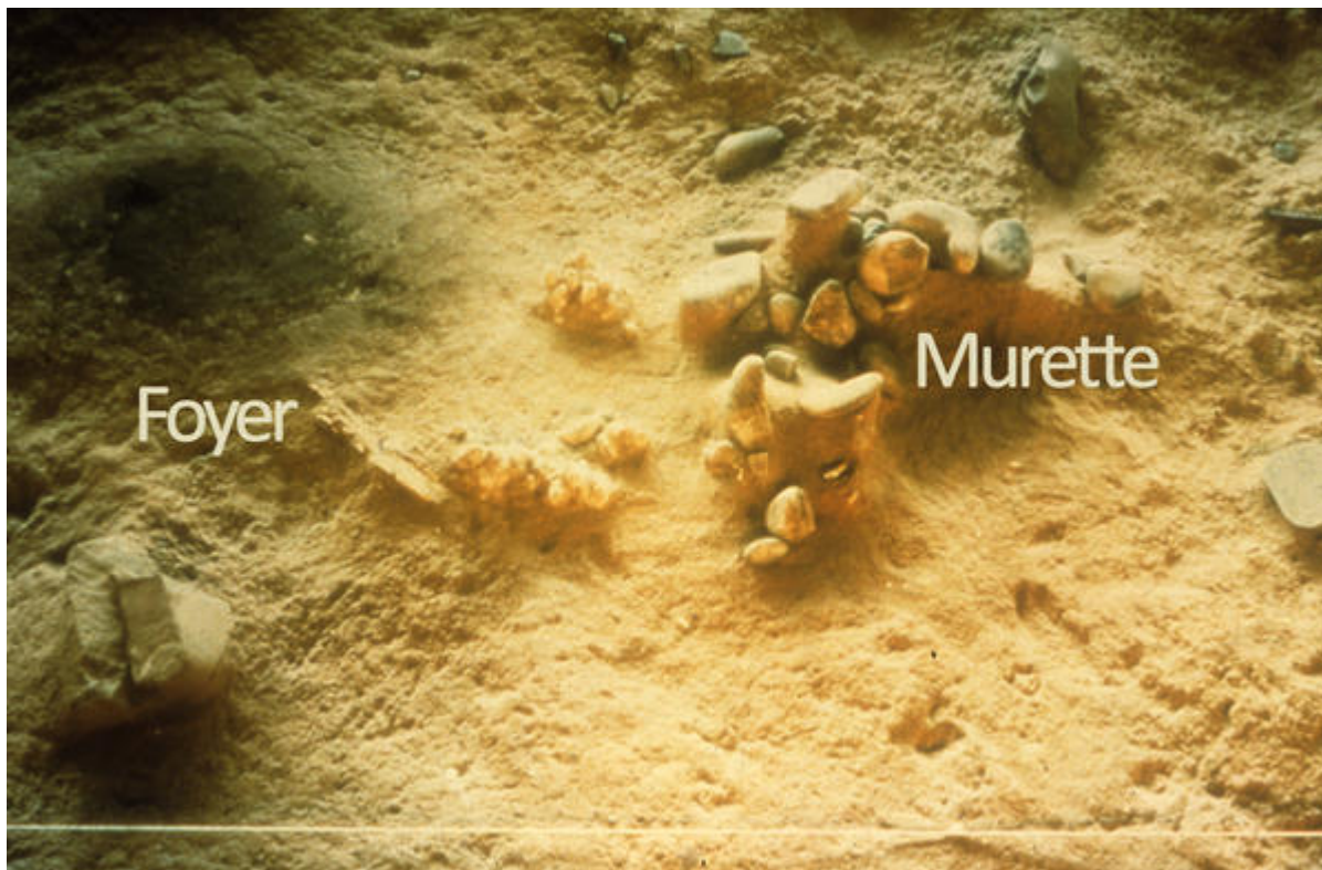
Détail du sol de la grotte (foyer / murette)