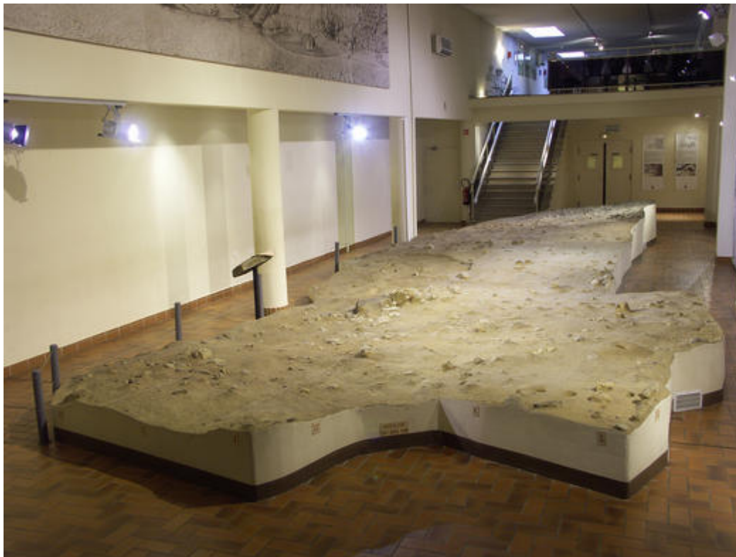
Moulage du sol de la grotte exposé au musée de Terra Amata