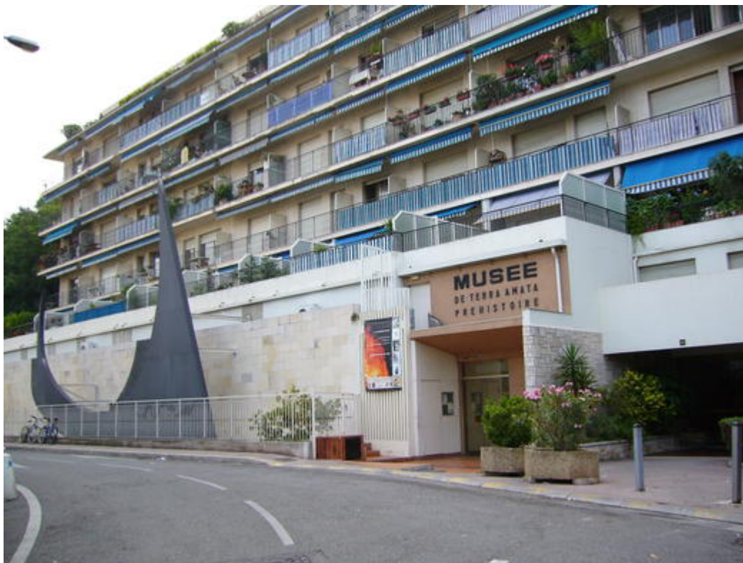
Entrée du Musée de Terra Amata