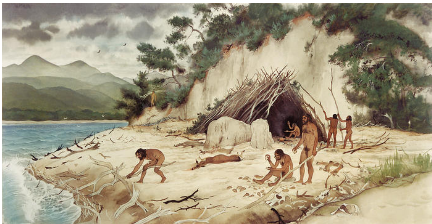
Dessin illustrant le campement préhistorique de Terra Amata

L'espace muséal de Terra Amata est installé sur le lieu même de la fouille du site du même nom, qui a livré les plus anciens foyers de l'histoire de l'humanité, datant de 400 000 ans.