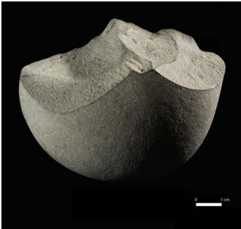
Outil, collection Musée de Terra Amata