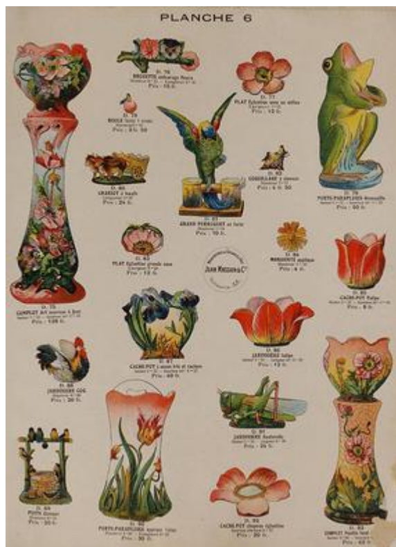
Planche d'un catalogue de vente de la fabrique Jean Massier, fin du XIX ème siècle, Musée Magnelli, Musée de la Céramique, Vallauris