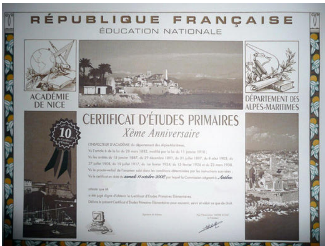
Musée de l'école d'Antibes