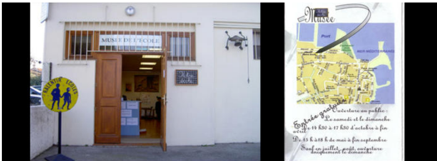
Musée de l'école d'Antibes