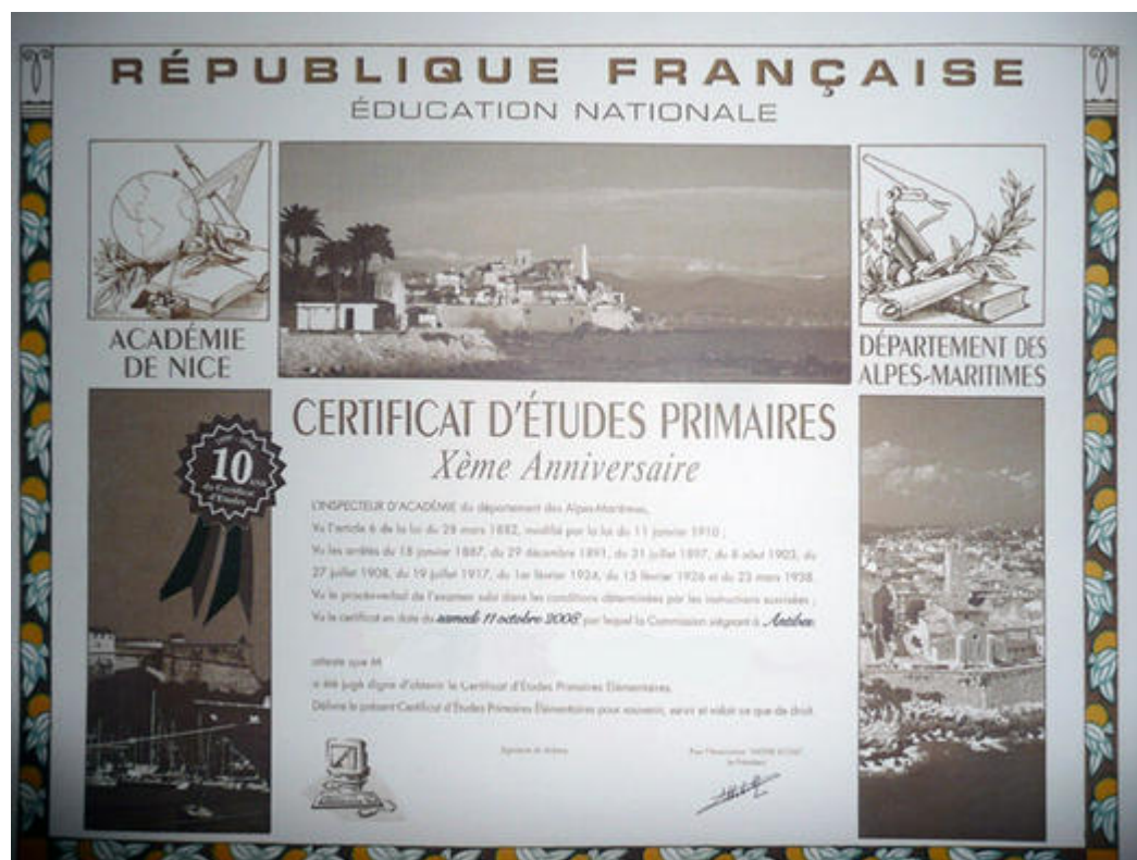
Musée de l'école d'Antibes