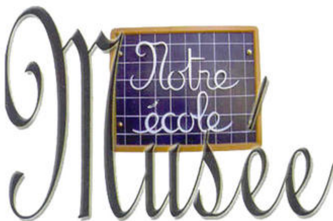
Musée de l'école d'Antibes

Le musée de l'école d'Antibes c'est une page d'histoire de l'école: la salle de classe, le matériel scolaire familier et désuet et l'ambiance de leur vieille classe. Le musée propose un parcours fait de découvertes, d'actions et d'échanges et recèle un patrimoine riche en documents, et propose collection de photos de classes et initiation à l'écriture à la plume et à l'encre violette sur les anciens pupitres.