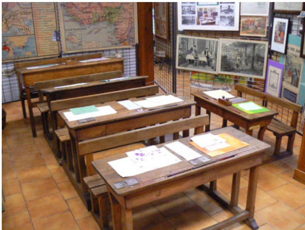
Musée de l'école d'Antibes