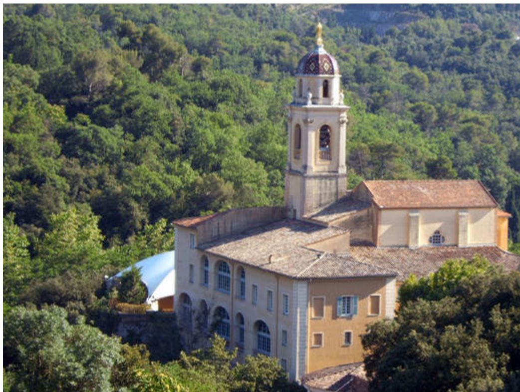
Vue dominante sur le sanctuaire de Laghet

Laghet, de l'italien: Laghetto, est un hameau dépendant de la commune de La Trinité dans le département des Alpes-Maritimes. Notre-Dame-de-Laghet est l'association du nom de la Vierge Marie et de ce petit village.