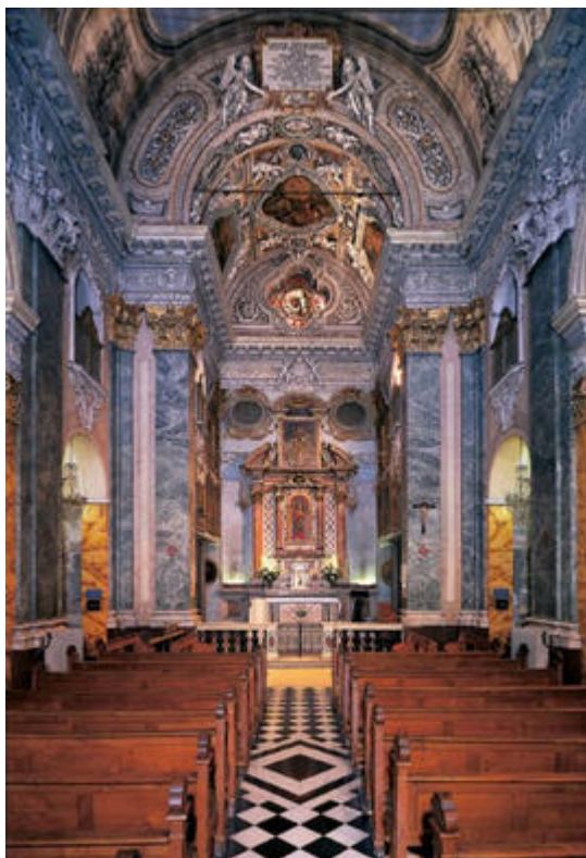
Vue de la nef centrale, le choeur et son maître- autel , au fond, la statue de la Vierge.