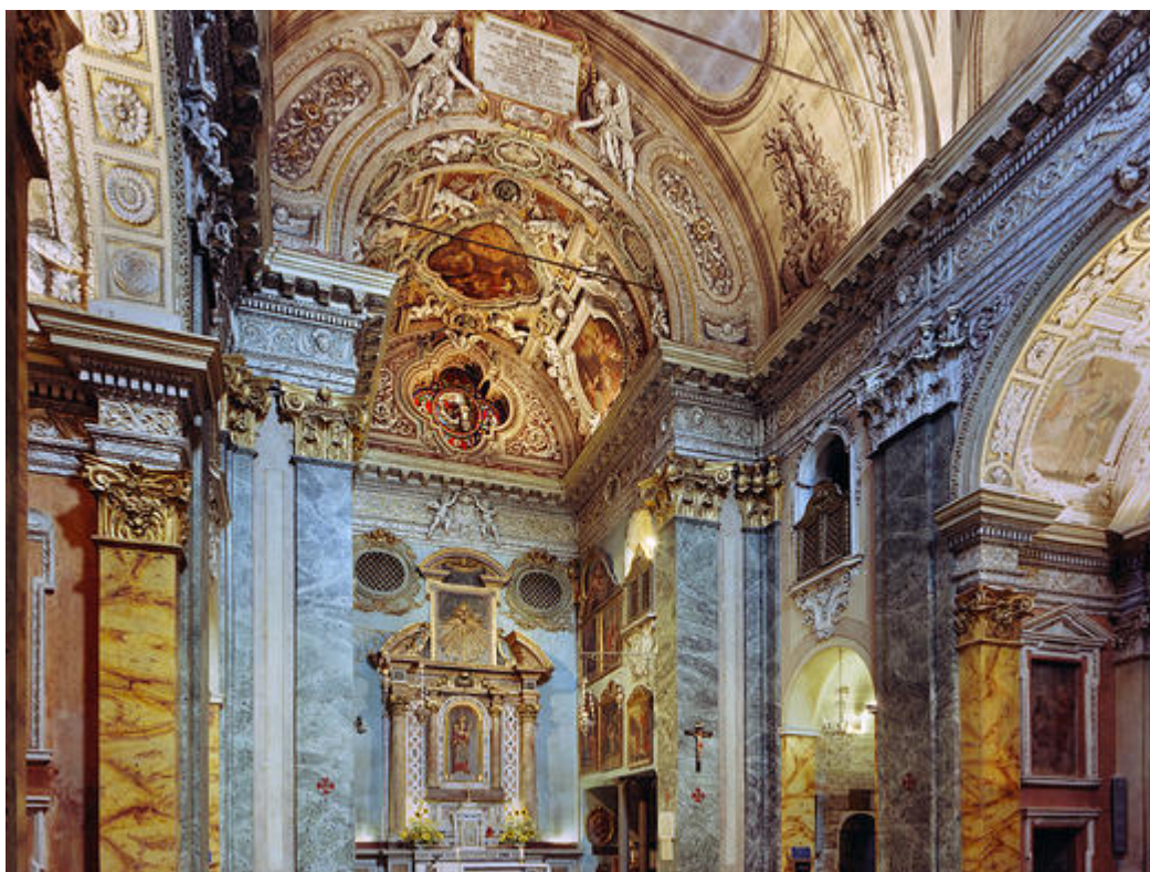
Détails du choeur avec le maître- autel et la statue de la Vierge