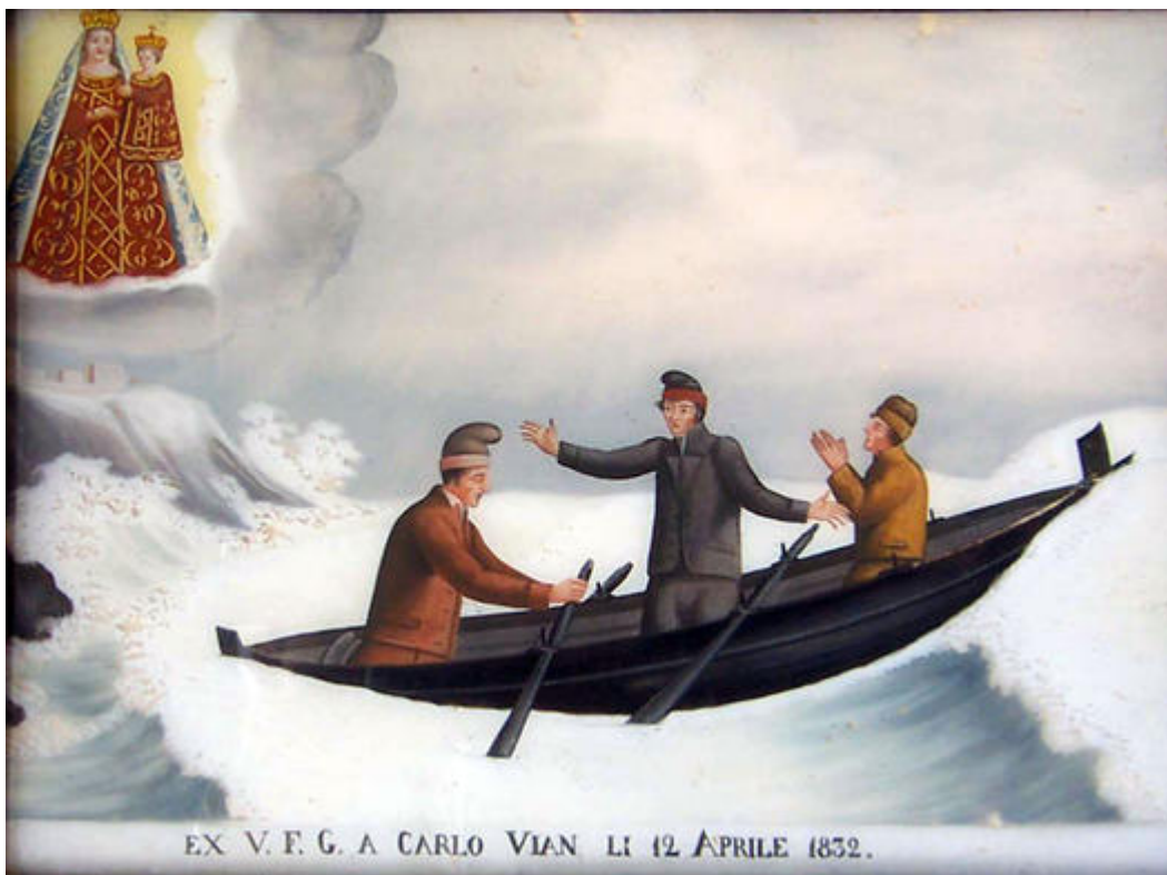
Ex-voto le naufrage. En bas, le nom du bénéficiaire du miracle avec la mention VFGA (votum fecit, gratiam accepit : a fait un vœu, a obtenu une grâce).