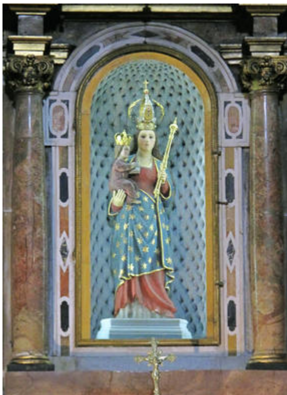
Statue de la Vierge, à la chapelle de Laghet, sculptée dans un tronc de sorbier par un artiste parisien, Pierre Moise, et ornée de peintures polychromes par l'artiste niçois, Jean Rocca.