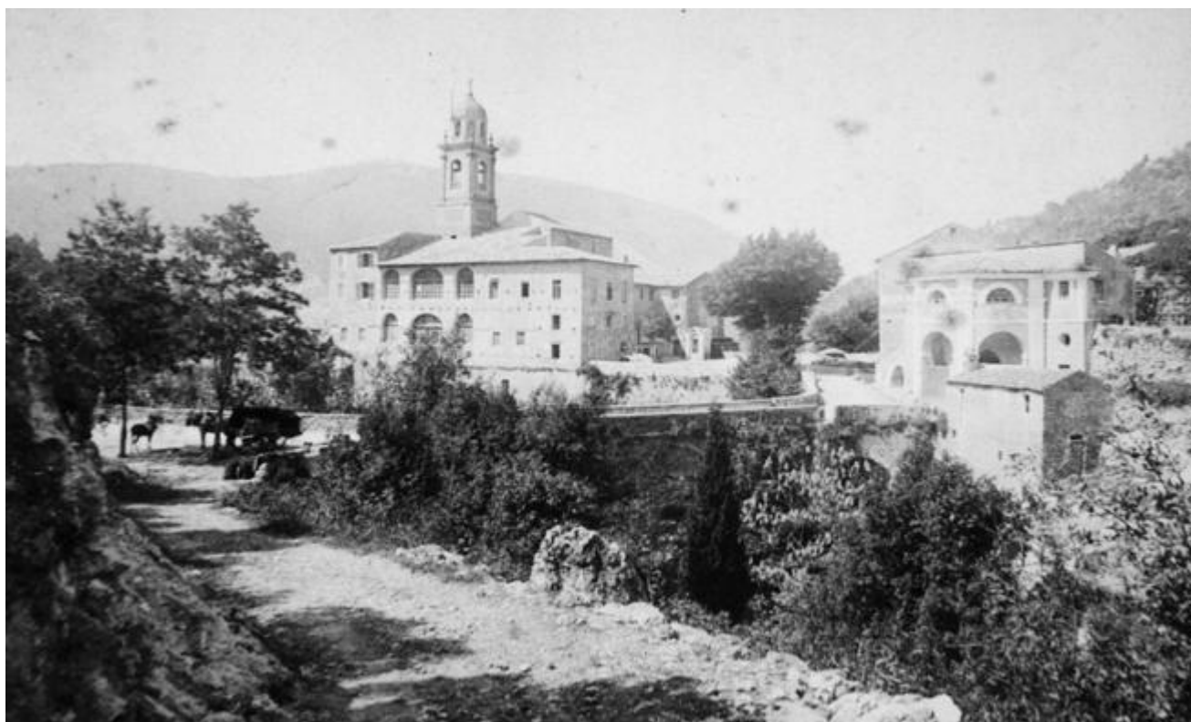
Sanctuaire de Notre-Dame de Laghet