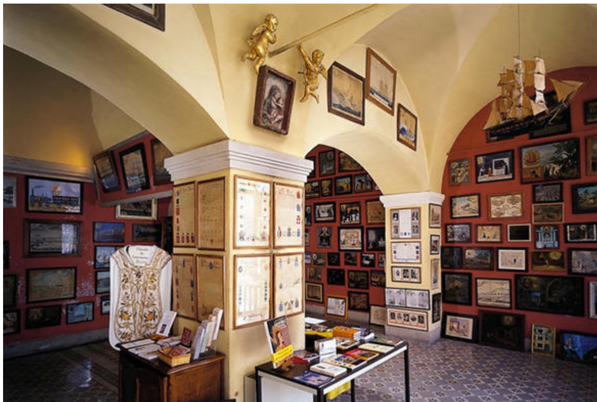
La salle Don Jacques Fighiera et ses ex-voto