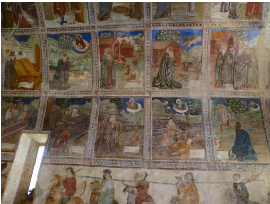
Fresques de Saint-Antoine l'ermite, chapelle Saint-Antoine à Clans