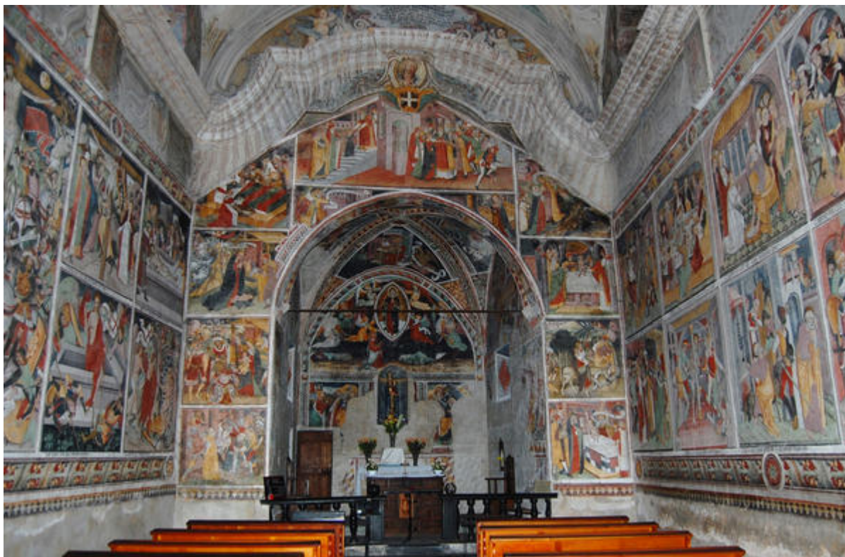
La chapelle Notre-Dame-des-Fontaines, la Brigue