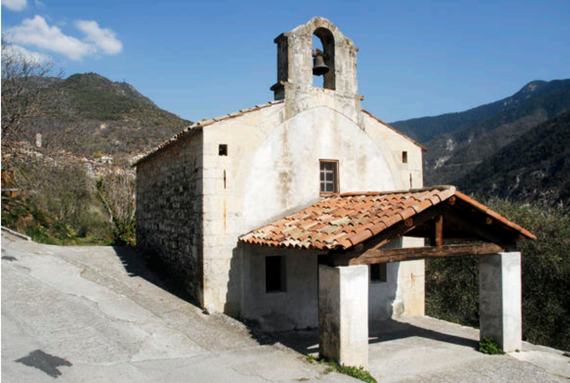
La chapelle Saint-Antoine, Roure

Patrimoine longtemps méconnu, les chapelles peintes des Alpes-Maritimes suscitent, à juste titre, un regain d'intérêt depuis plusieurs décennies. Elles reflètent la vitalité de la région en matière d'art sacré, y compris dans les vallées de l'arrière-pays, pendant la période charnière du Moyen Âge et de la Renaissance .