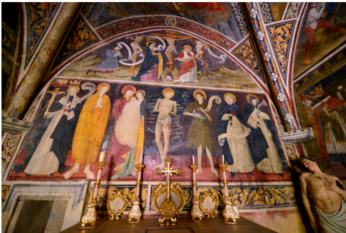
Chapelle Saint Sébastien, Saint-Etienne-de-Tinée