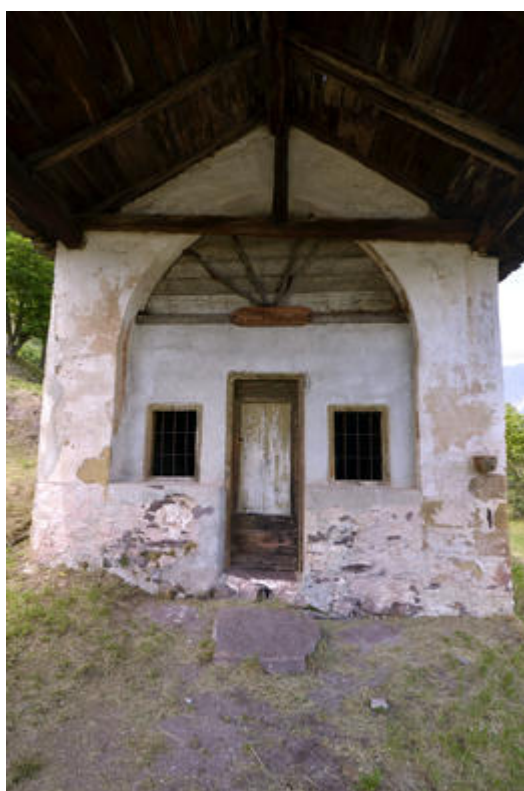
Chapelle Saint Sébastien et Saint Bernard, Roure