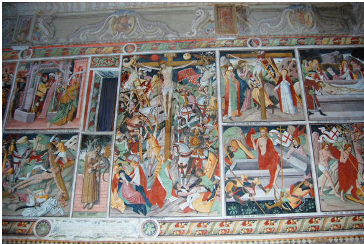
La chapelle Notre-Dame-des-Fontaines à la Brigue, vue des fresques latérales