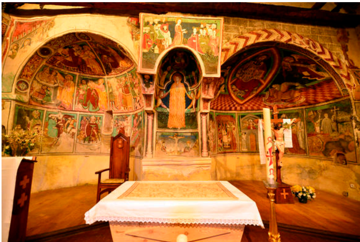
Chapelle Saint Erige, Hameau d'Auron Saint-Etienne-de-Tinée