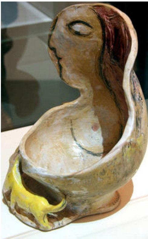
Vase sculpté, Marc Chagall, 1952