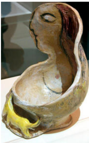
Vase sculpté, Marc Chagall, 1952