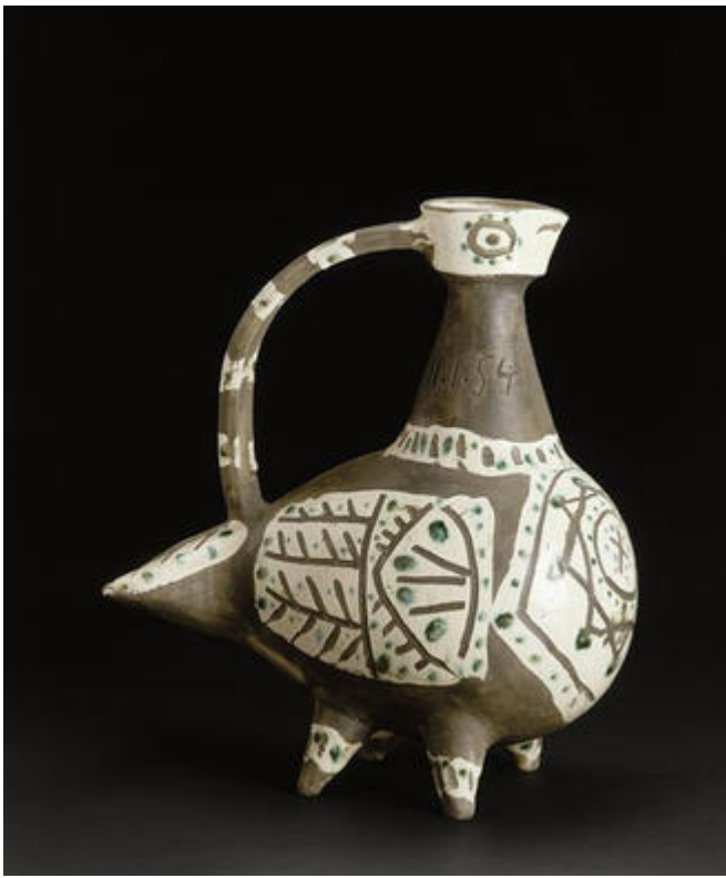
Vase zoomorphe , Pablo Picasso, 1954, musée Magnelli, musée de la Céramique, Vallauris © Succession Picasso 2020