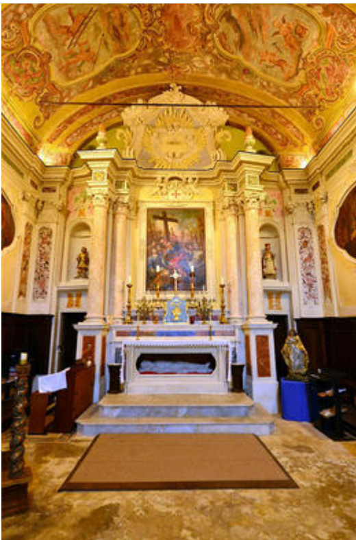
Le choeur et le maître- autel de la chapelle des Pénitents blancs