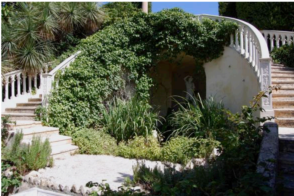
Le jardin florentin de la Villa Ephrussi