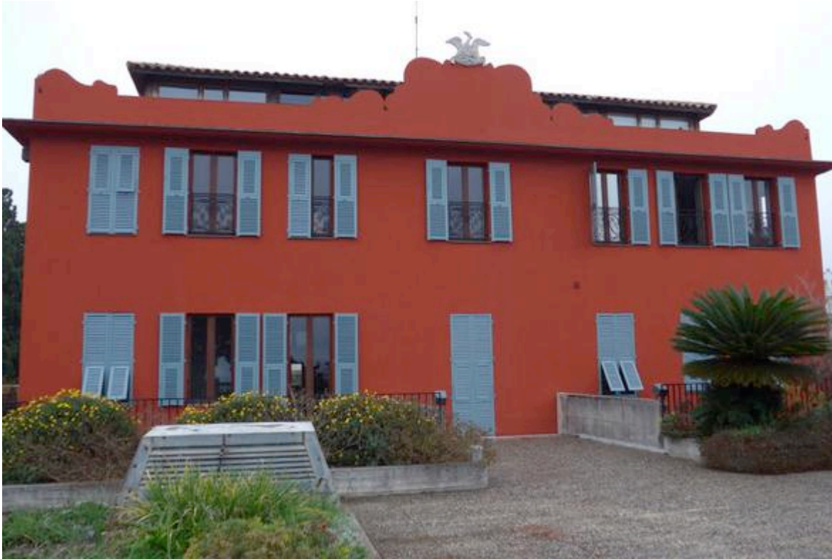
L'ancienne Villa ocre (rouge de Gênes), aujourd'hui restaurée

Créée en 1972, la Villa Arson est une institution nationale dédiée à l'art et à la création contemporaine. Réunissant une école supérieure d'art, un centre d'art et une bibliothèque spécialisée, elle accueille également une résidence d'artistes. La Villa Arson a pour missions la formation artistique, le soutien à la création et la diffusion de l'art contemporain