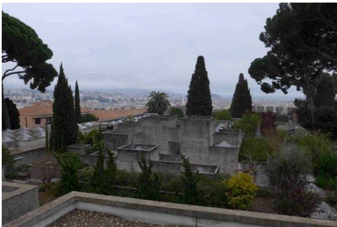
Vue des toits-terrasses