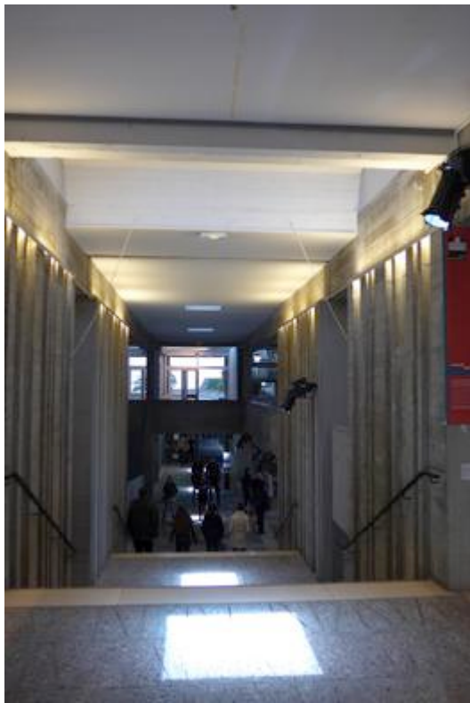
Puit de lumière