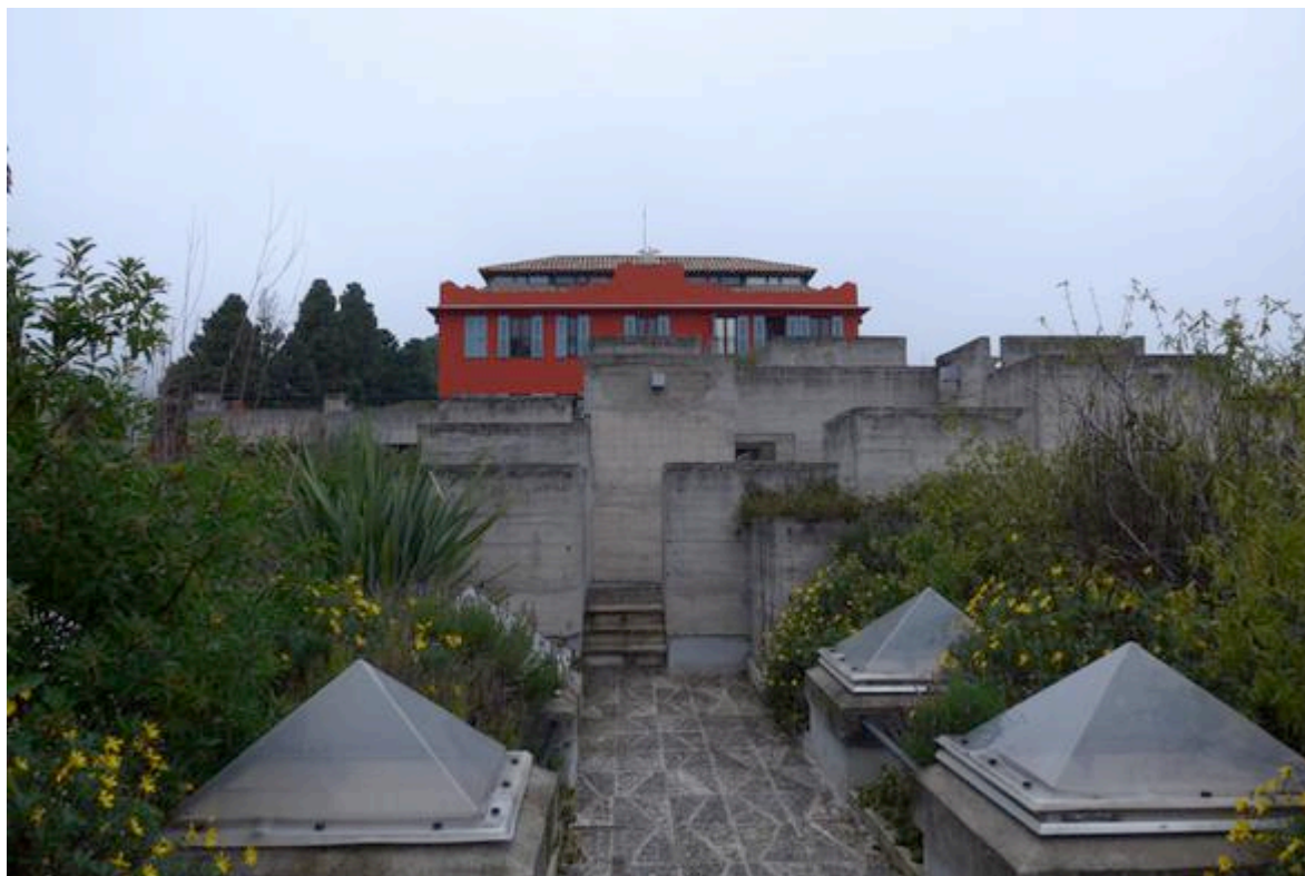
Pavement des toits-terrasses