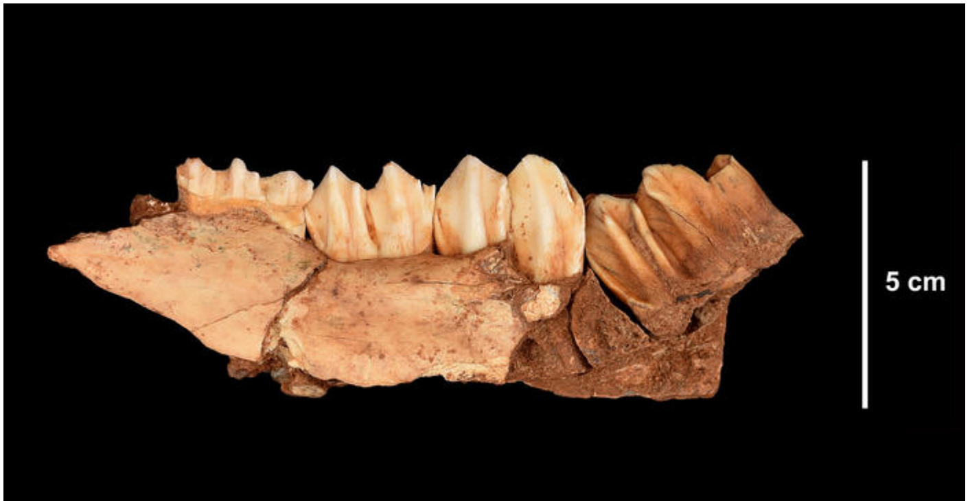
Mandibule droite de cerf de la grotte du Lazaret