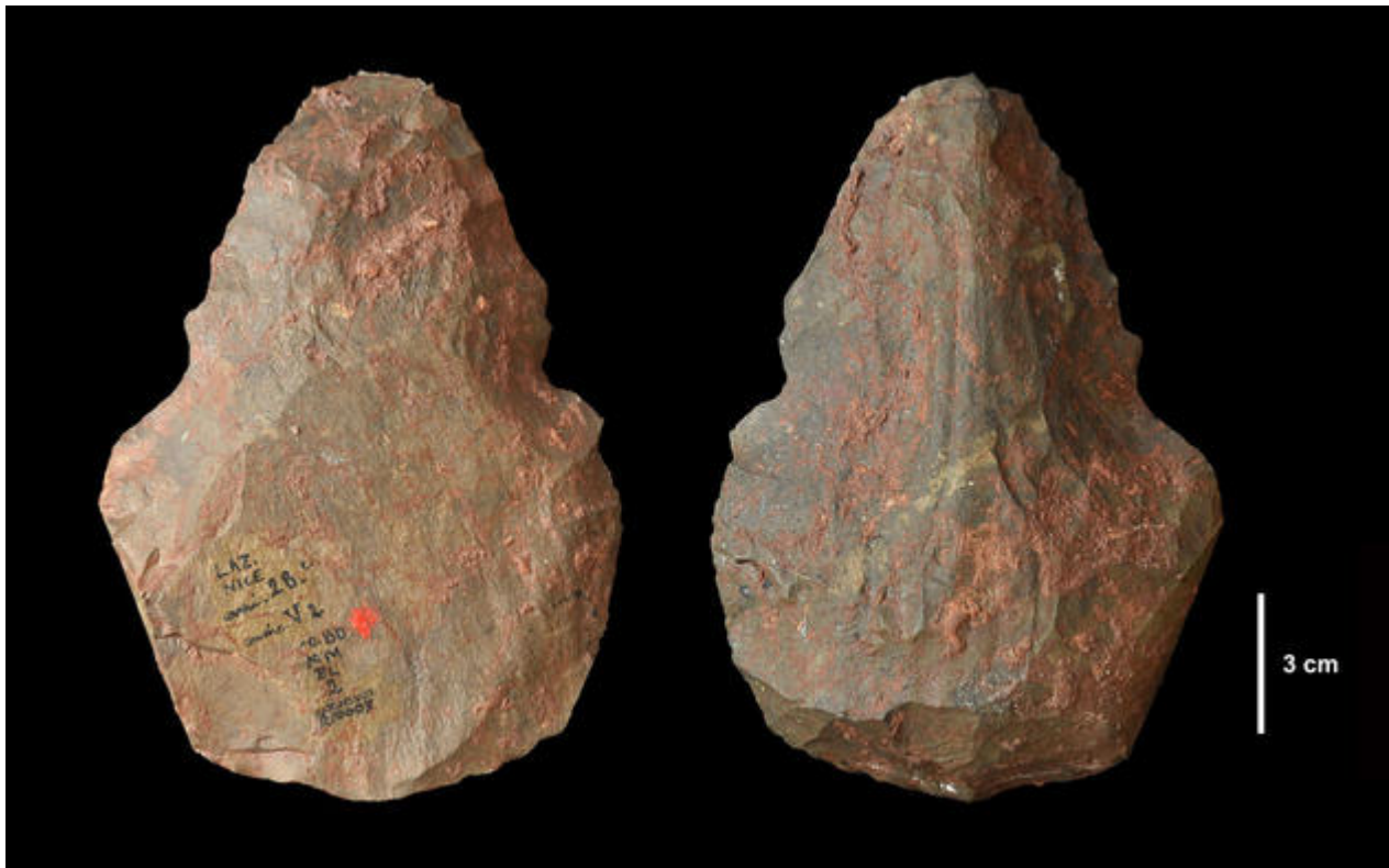
Biface de la grotte du Lazaret