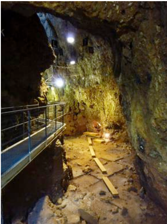
Fouilles en cours à l'intérieur de la grotte du Lazaret.

La période des derniers Homo erectus est connue grâce au site de Carros-le-Neuf et surtout au gisement du Lazaret, à Nice. A cette époque, la culture est encore attribuée, comme à Terra Amata, à l' Acheuléen , une industrie riche en bifaces .