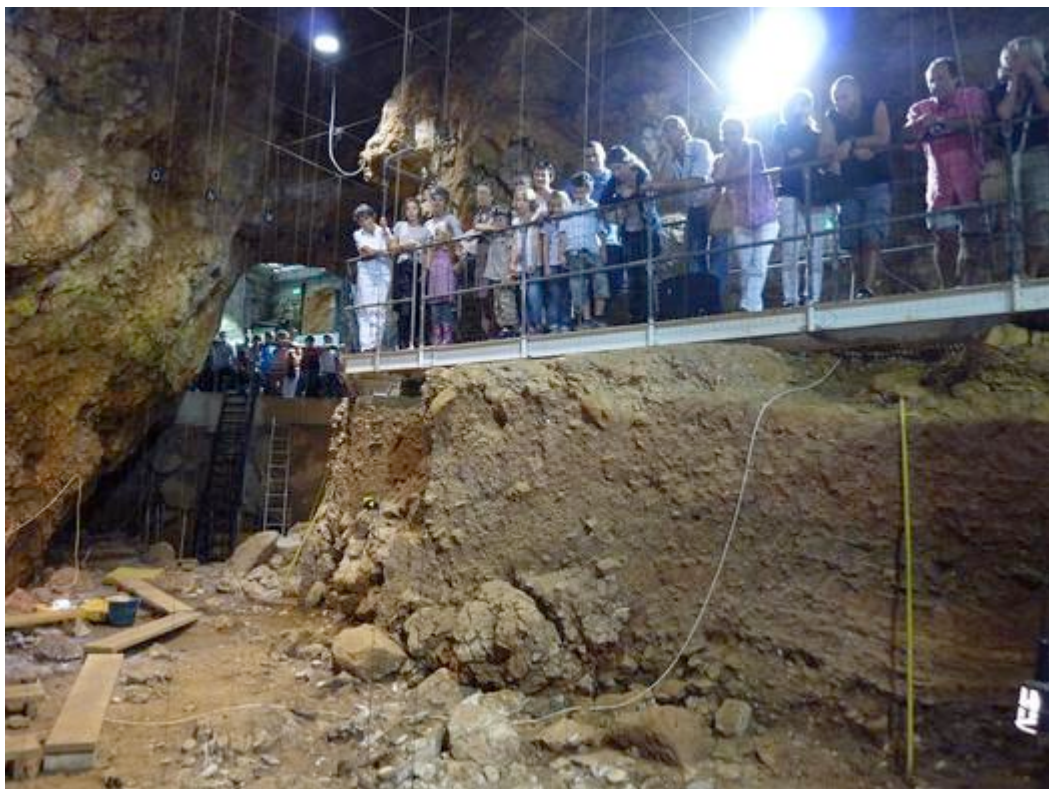
Visite de la grotte du Lazaret, lors des Journées Européennes du Patrimoine 2011.