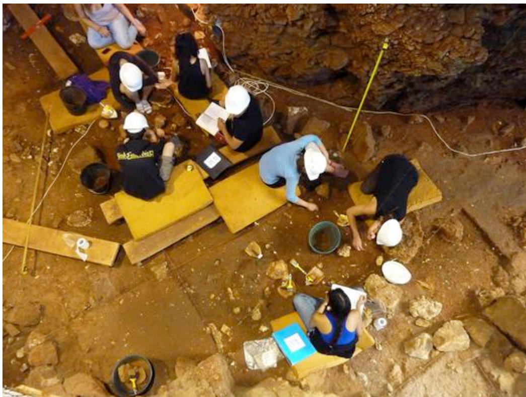
Fouilleurs à l'intérieur de la grotte du Lazaret.