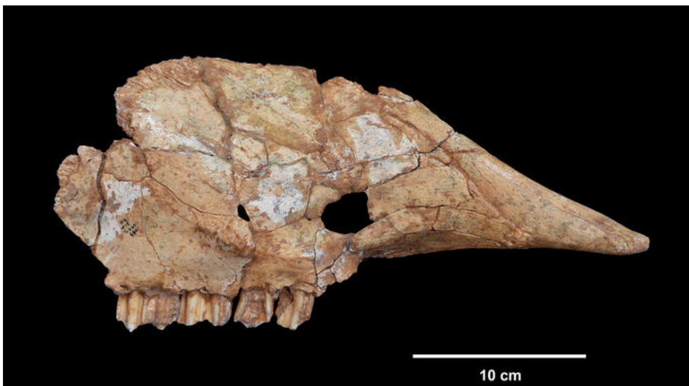
Maxillaire droit d'aurochs de la grotte du Lazaret