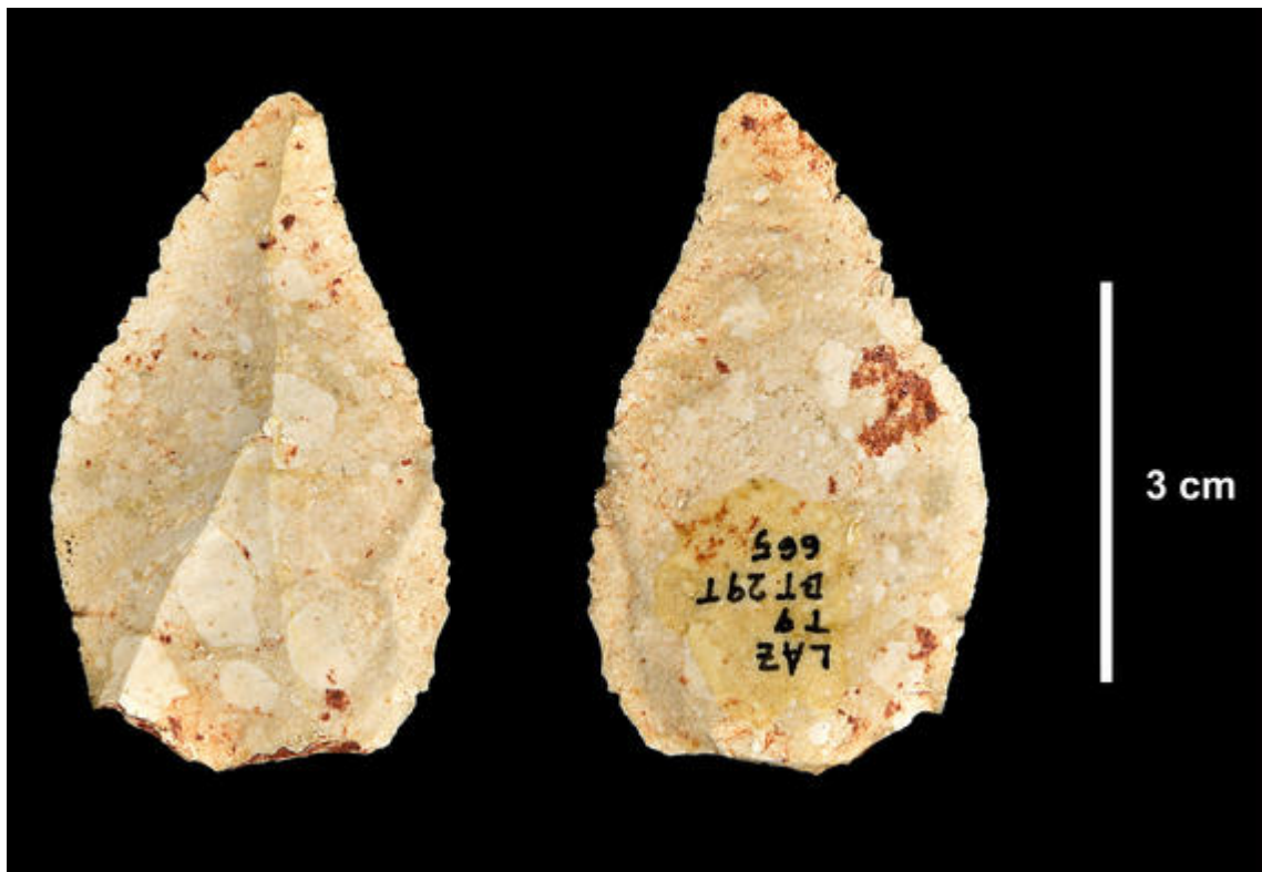
Éclat de type lavallois de la grotte du Lazaret