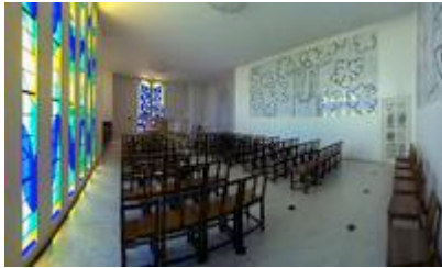
Vue intérieure de la chapelle du Rosaire de Vence

Trois ensembles de céramique blanche décorent les murs de la chapelle : une représentation monumentale de Saint-Dominique , dont l'économie de traits n'ôte rien à l'expressivité ; une Vierge à l'Enfant , pareillement stylisée et entourée de fleurs-nuages et du mot AVE ; un Chemin de Croix , fait, semble-t-il au premier regard, de la combinaison de signes élémentaires.