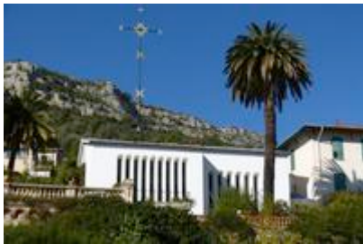
Vue extérieure de la chapelle du Rosaire de Vence