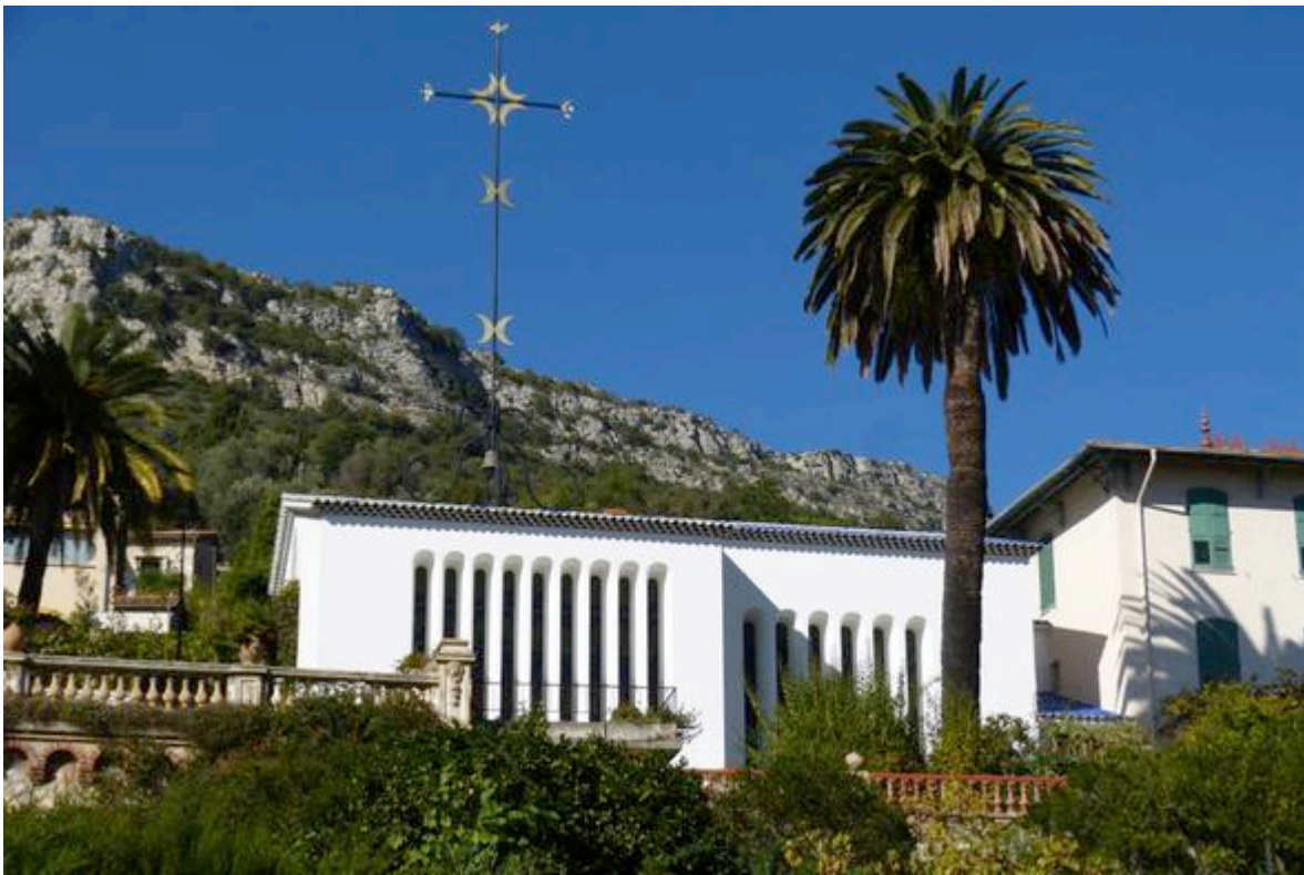
Vue extérieure de la chapelle du Rosaire de Vence