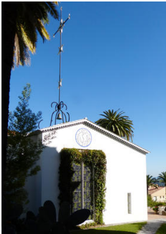
Vue extérieure de la chapelle du Rosaire de Vence