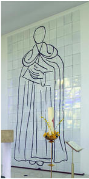
Céramique d'Henri Matisse, ND du Rosaire, Vence

Des créations en céramique, carreaux de terre cuite émaillée blanche, ornent les murs de la pièce centrale. Peintes de dessins noirs filiformes, elles représentent l'essentiel spirituel et se lisent tel un livre ouvert.