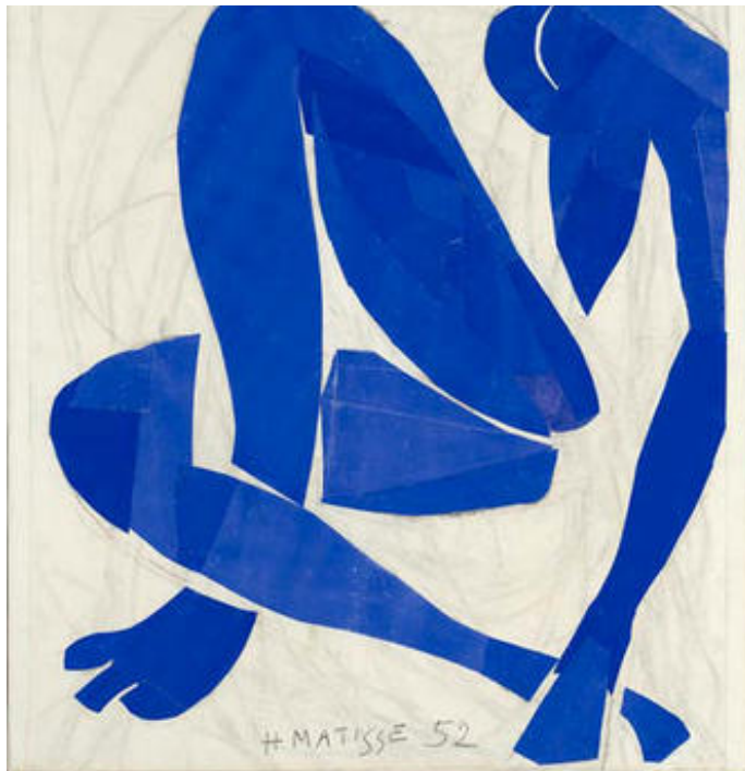
Nu bleu IV , 1952. Gouache découpée d'Henri Matisse, Musée Matisse, Nice