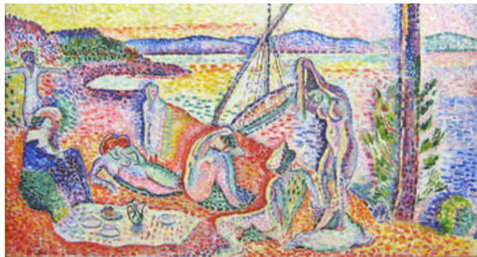
Luxe, calme et volupté , peinture d'Henri Matisse, 1904, Huile sur toile, 0.98m X 1.185 m, musée d'Orsay, Paris