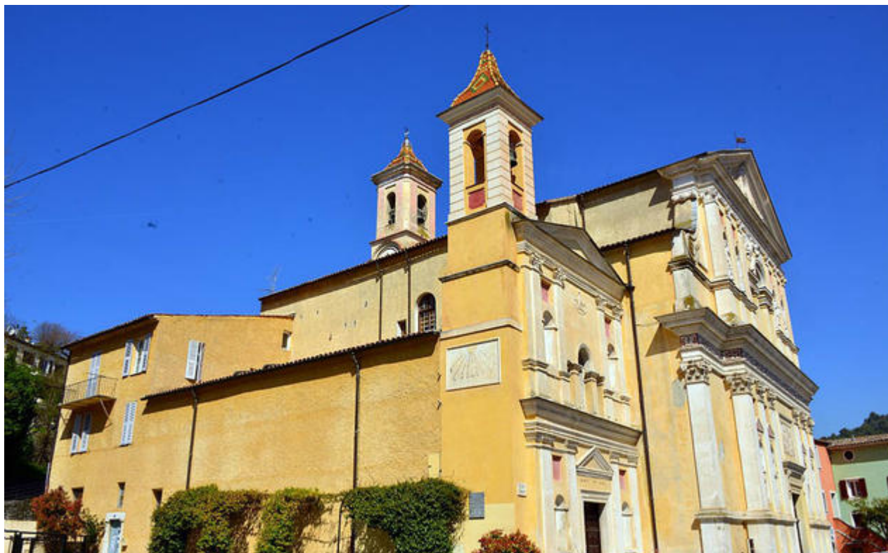
L'église Saint-Pierre vue de côté

Classée Monument historique, l'église se situe au cœur du vieux village de l'Escarène, une étape incontournable sur la route du sel jusqu'au XIX e siècle. L'édifice principal est flanqué de deux chapelles latérales, au nord celle des pénitents blancs, au sud celle des pénitents noirs. L'ensemble constitue un magnifique exemple de baroque nisso-ligure.