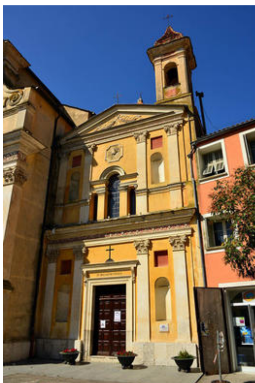
La façade de la chapelle des Pénitents noirs