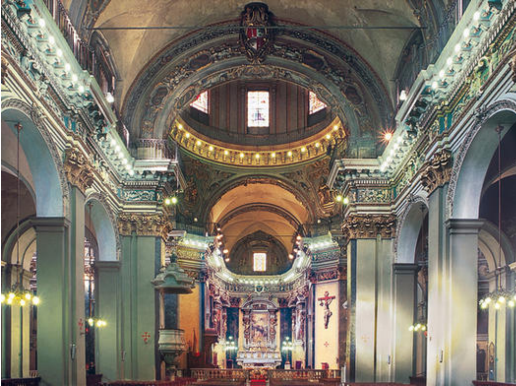
Cathédrale Sainte-Réparate, Nice, 1650-1685