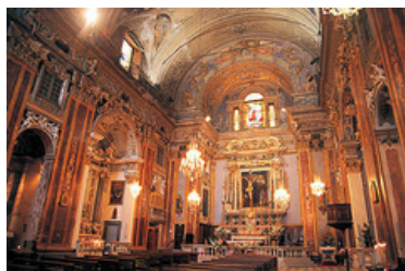
Vue de l'intérieur, la nef , Église du Gesù, 1612-164, Nice