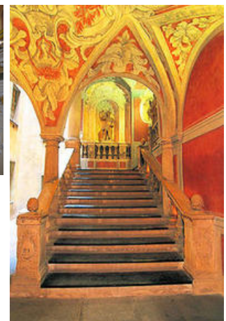
Escalier d' apparat du