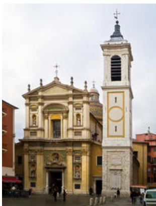
La façade et le campanile de la