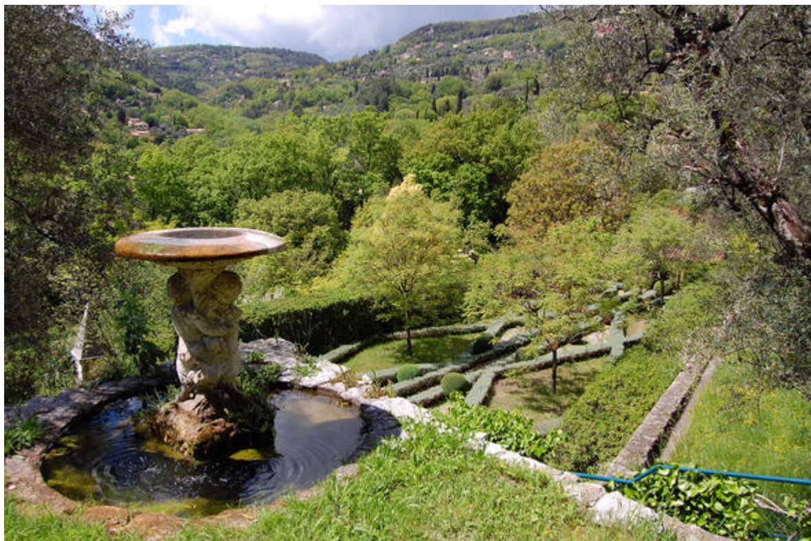
Jardin de la villa Noailles à Grasse