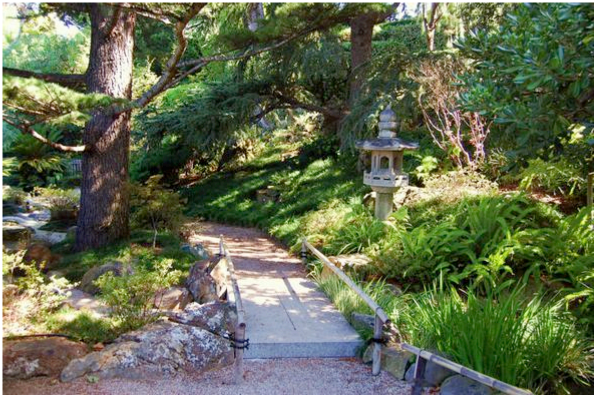
Le jardin japonais de la Villa Ephrussi