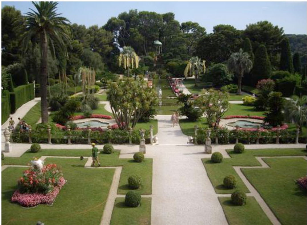
Le Jardin à la Française de la Villa Ephrussi