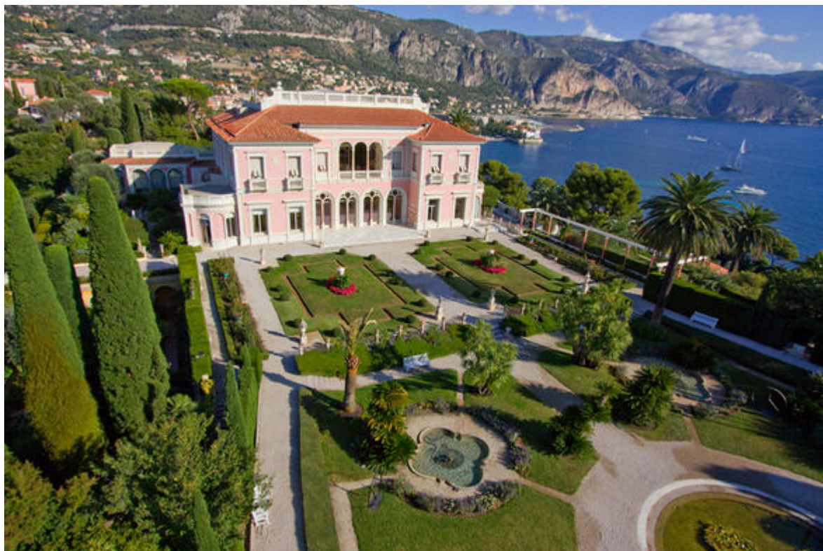
La Villa Ephrussi, facade sud