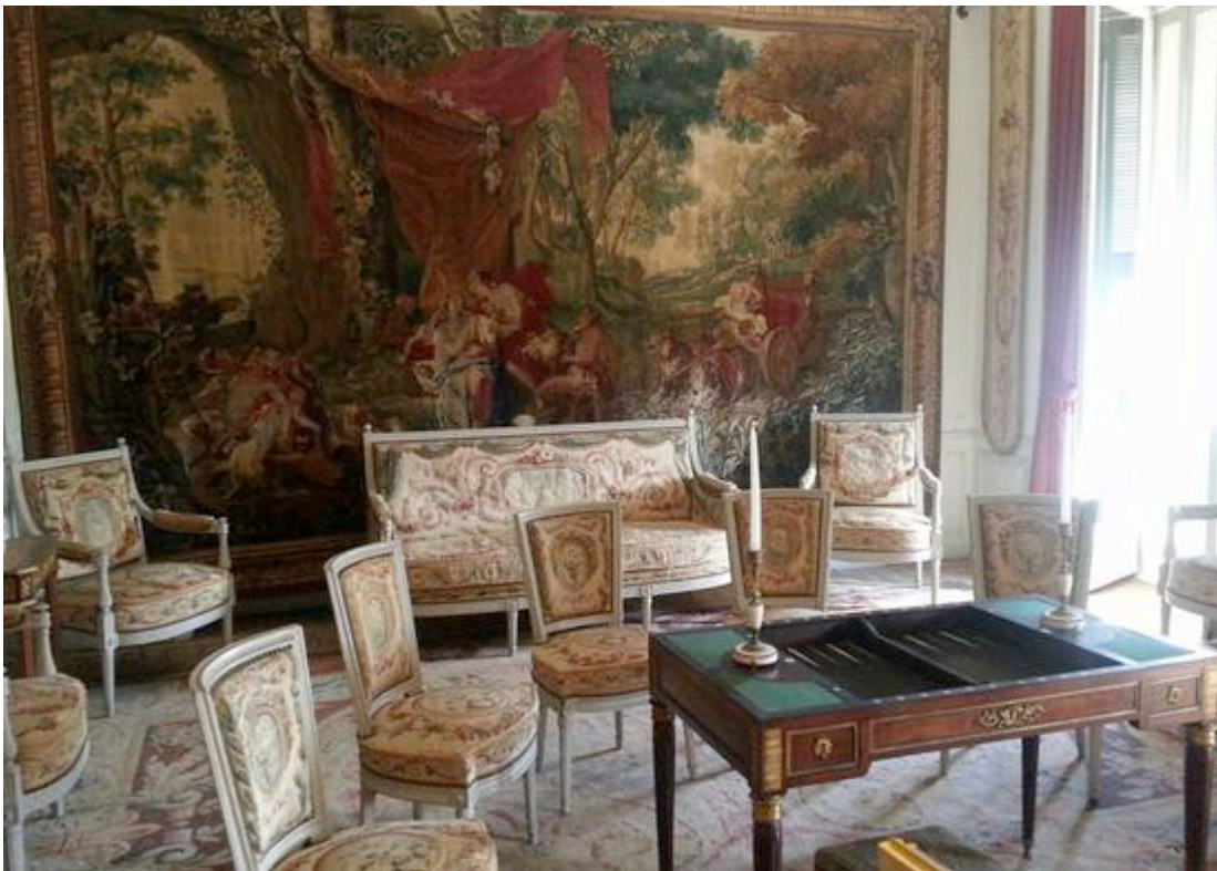
Le salon des tapisseries de la Villa Ephrussi