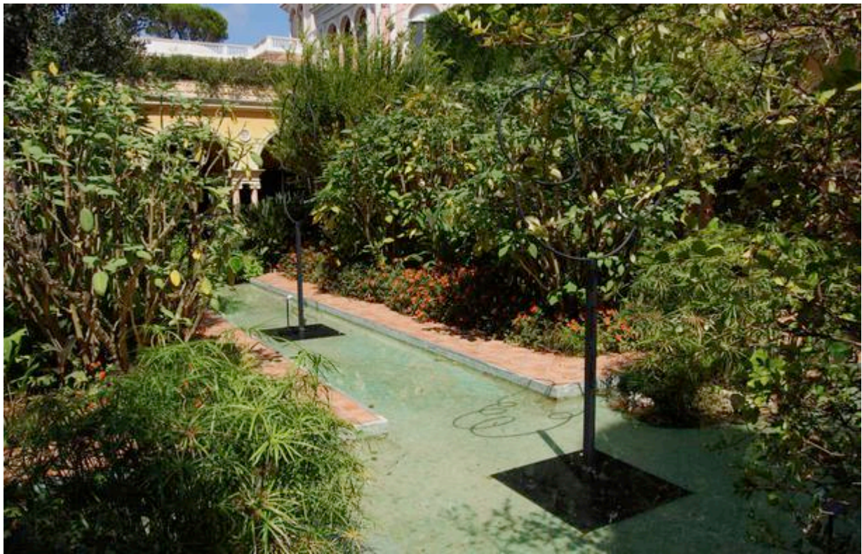
Le jardin espagnol de la Villa Ephrussi