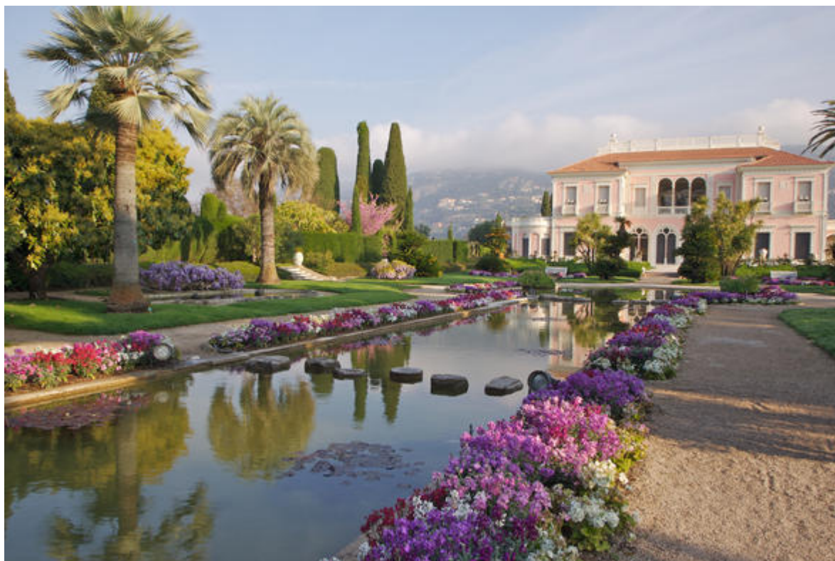
Vue de la façade sud de la Villa Ephrussi

Sur la partie la plus étroite de la presqu'île de Saint-Jean-Cap-Ferrat, au sommet d'un promontoire qui surplombe, à l'ouest la rade de Villefranche et à l'est la baie de Beaulieu, la villa Ephrussi de Rothschild occupe un des sites les plus spectaculaires de la Riviera. Dans ce palais néo- Renaissance , aux étonnants murs roses, sont exposées les collections d'œuvres d'art rassemblées par la baronne Béatrice de Rothschild et son époux, Maurice Ephrussi. Plusieurs jardins à thème, aménagés ultérieurement, servent d'écrin à ce lieu d'exception