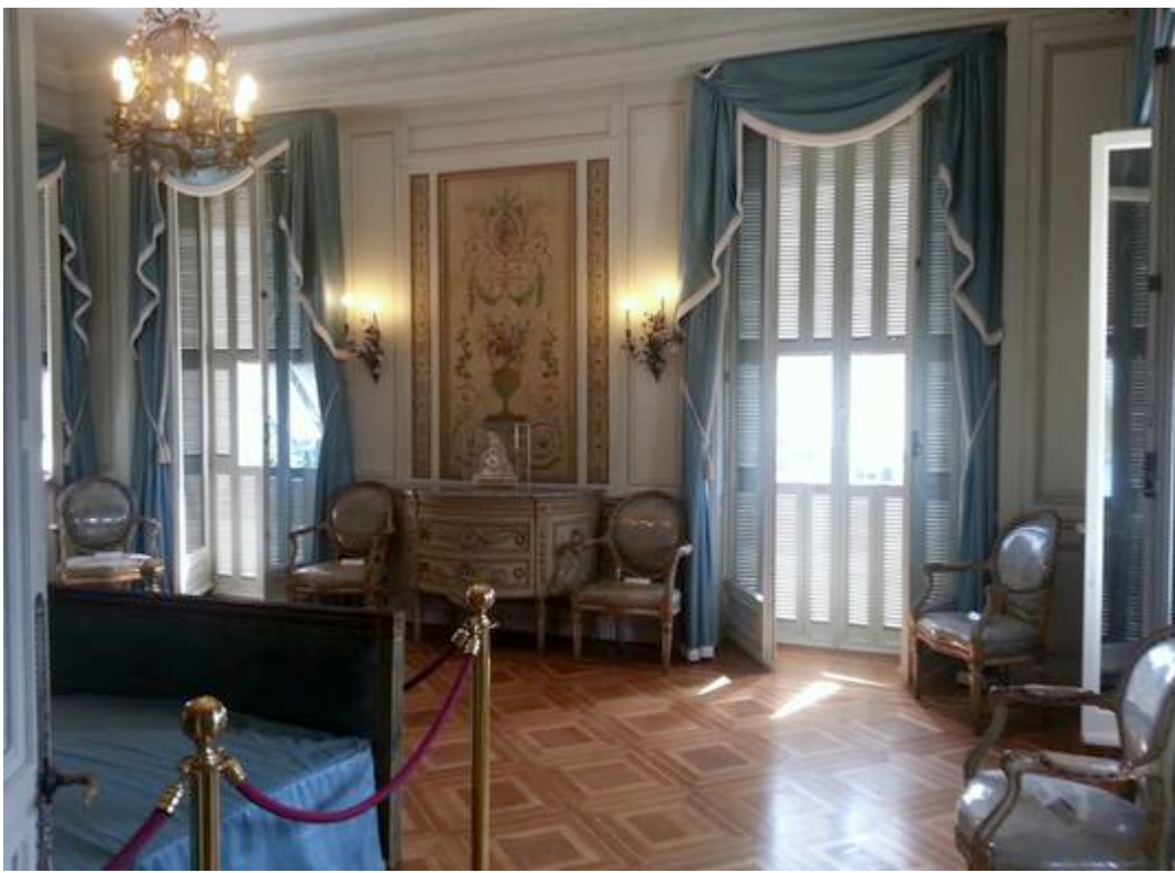
La chambre Bleue de la Villa Ephrussi