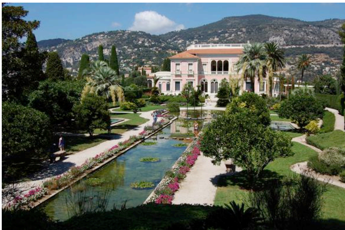
Le jardin à la Française de la Villa Ephrussi