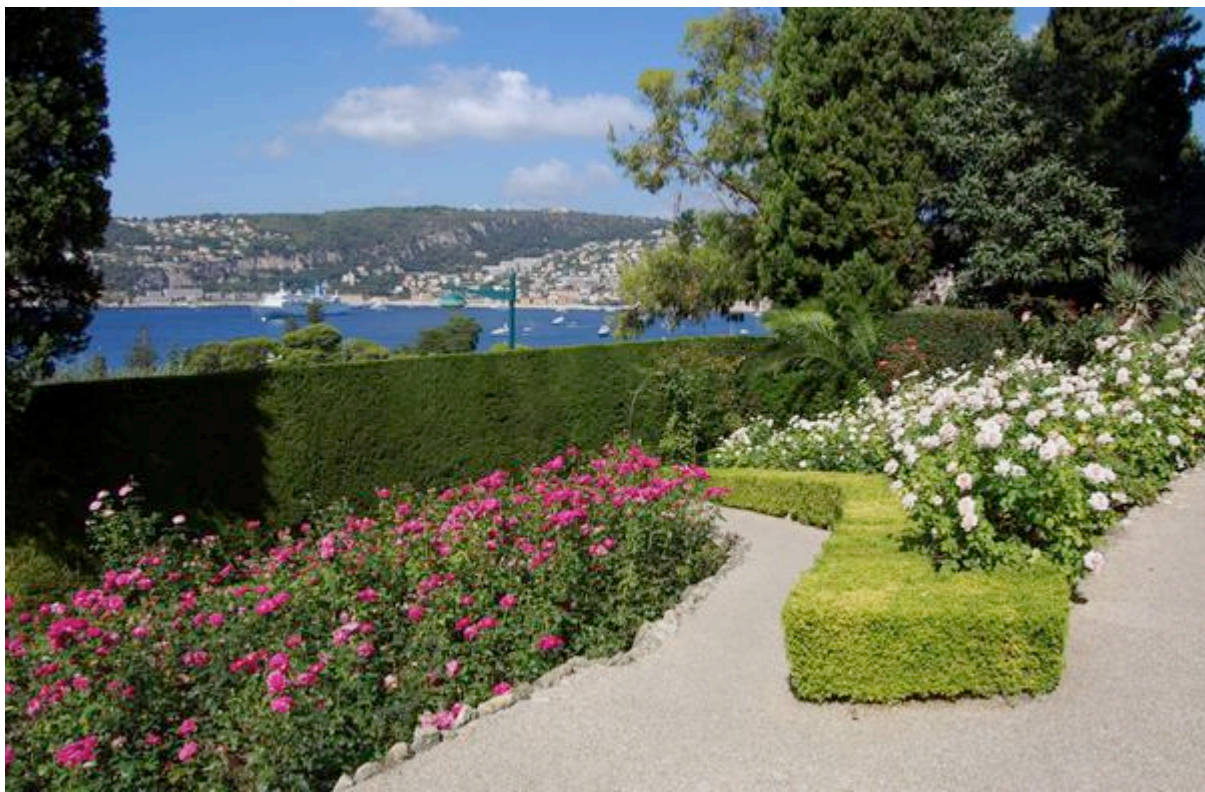
La roseraie de la Villa Ephrussi