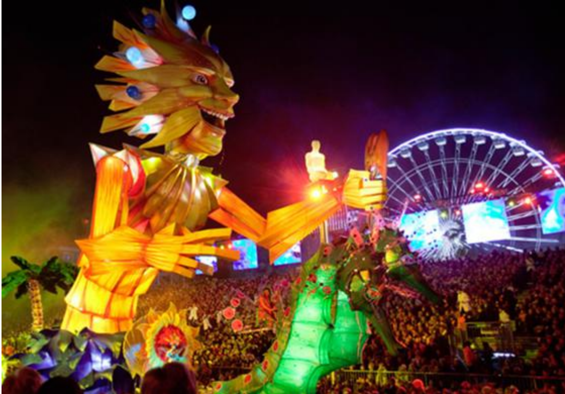
Parade de carnaval avec le char de sa Majesté carnaval (2011)

Se déroulant chaque année pendant le mois de février, il accueille des centaines de milliers de spectateurs qui viennent assister à la fête la plus emblématique de Nice.