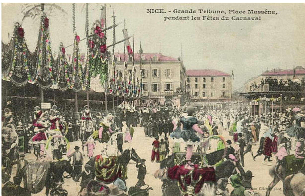
Nice, grande tribune, Place Masséna, pendant les fêtes du carnaval, 1905, carte postale