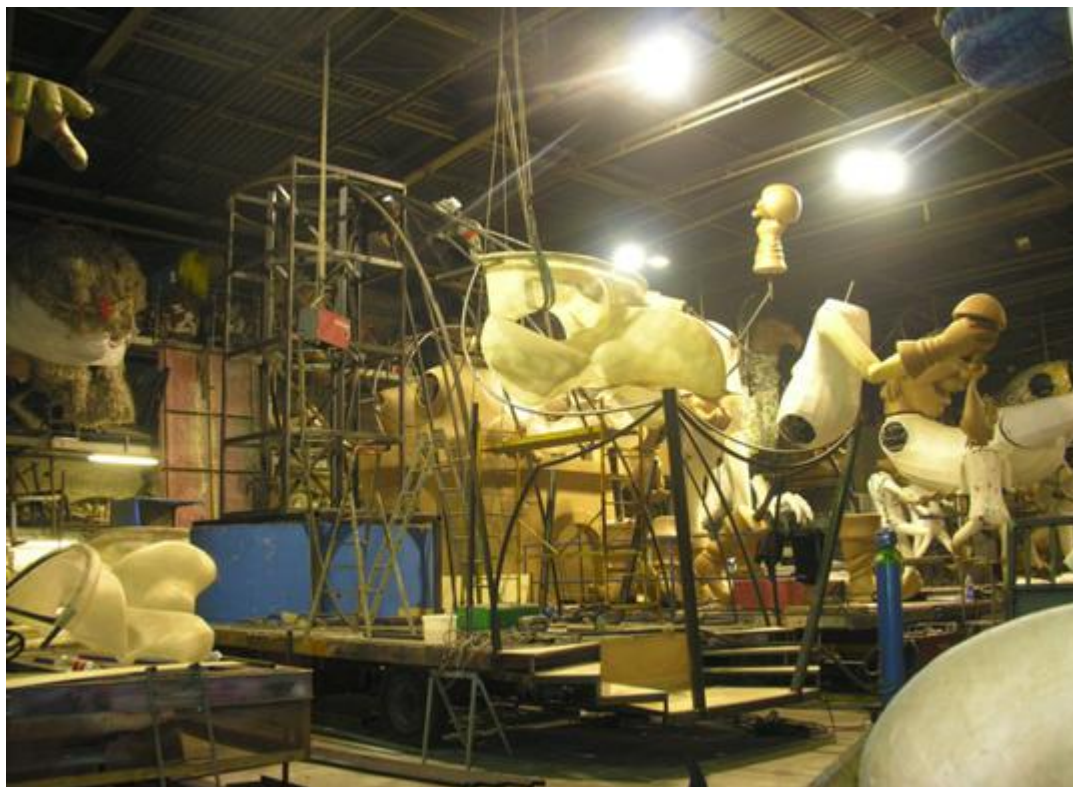
Vue d'atelier, maison du Carnaval