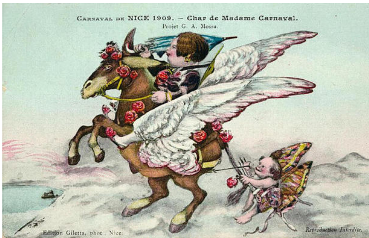
Carnaval de Nice 1909, char de Madame Carnaval, projet Gustave Adolphe Mossa, carte postale