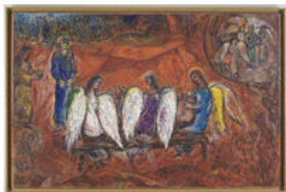
Abraham et les trois anges Marc Chagall 1952-1953, Huile sur toile

En 1966, Chagall fait don à la France de la série des grands tableaux du « Message Biblique », inspirés de la Genèse , de l' Exode et du Cantique des Cantiques . Cette série représente la synthèse de la réflexion spirituelle de Chagall : après les épreuves de la seconde guerre mondiale, de la Shoah et de l'exil, le peintre décrit un « rêve » qui n'est pas « celui d'un seul peuple, mais de l'humanité ».