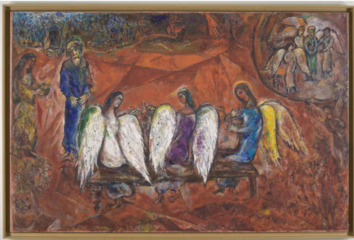
Abraham et les trois anges Marc Chagall 1952-1953, Huile sur toile