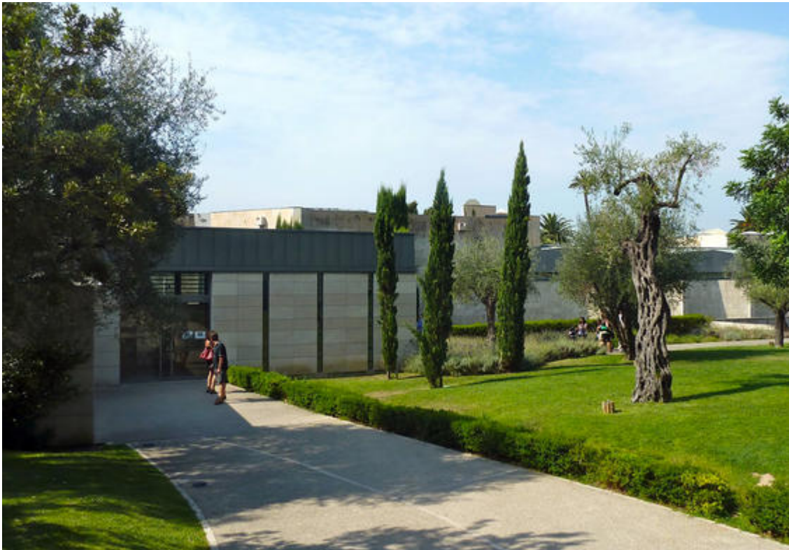
Les jardins et l'entrée du musée national Marc Chagall, Nice

En 1966, Marc Chagall fait don à la France des grands tableaux qui constituent le « Message Biblique ». C'est sur la colline de Cimiez qu'à l'initiative d'André Malraux le premier musée national consacré à un artiste vivant ouvre ses portes en 1973.