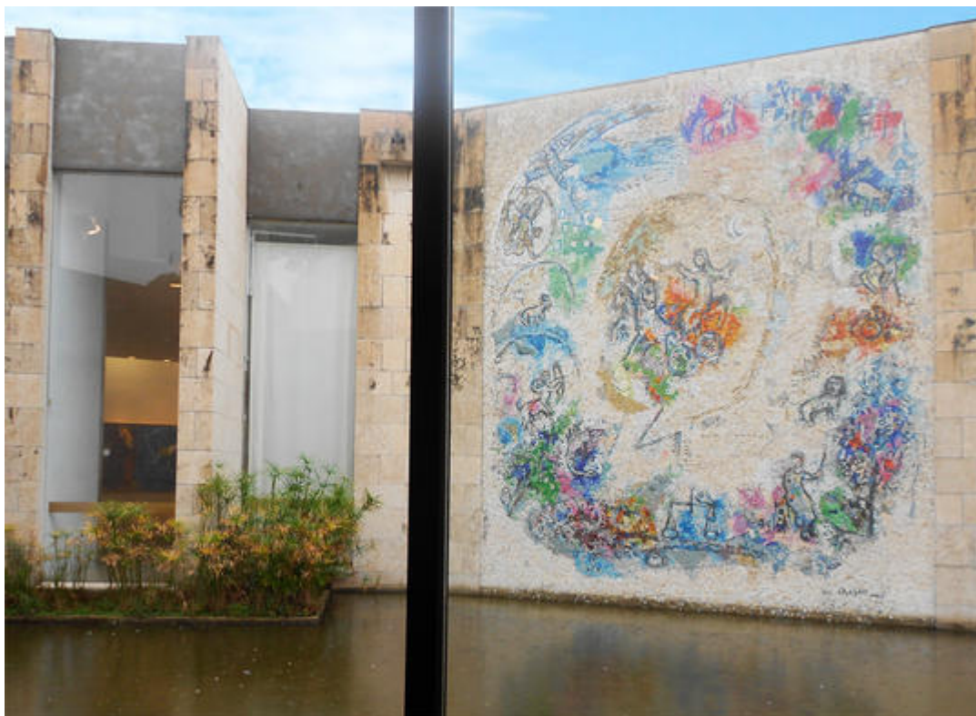
Le prophète Elie , mosaïque de Marc Chagall, 1971