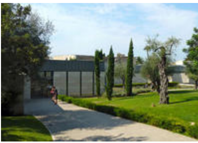
Les jardins et l'entrée du musée national Marc Chagall, Nice

L'architecture d'André Hermant correspond à son idéal de placer au cœur de son œuvre la finalité sociale d'un lieu. Ainsi, c'est bien la fonction du bâtiment qui détermine sa forme : le musée sert à la fois l'exposition des œuvres mais aussi la rencontre du public avec les œuvres. Ce n'est donc pas le bâtiment qui impose la muséographie mais les œuvres imposent la forme du bâtiment. La muséographie, voulue par Chagall, est immuable.