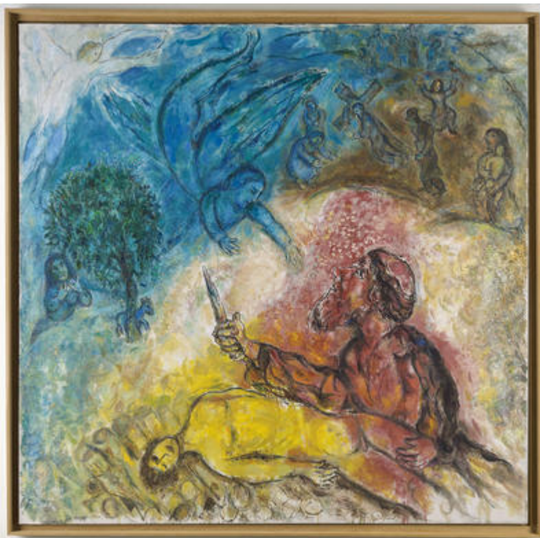
Le sacrifice d'Isaac , Marc Chagall, 1960-1966, Huile sur toile