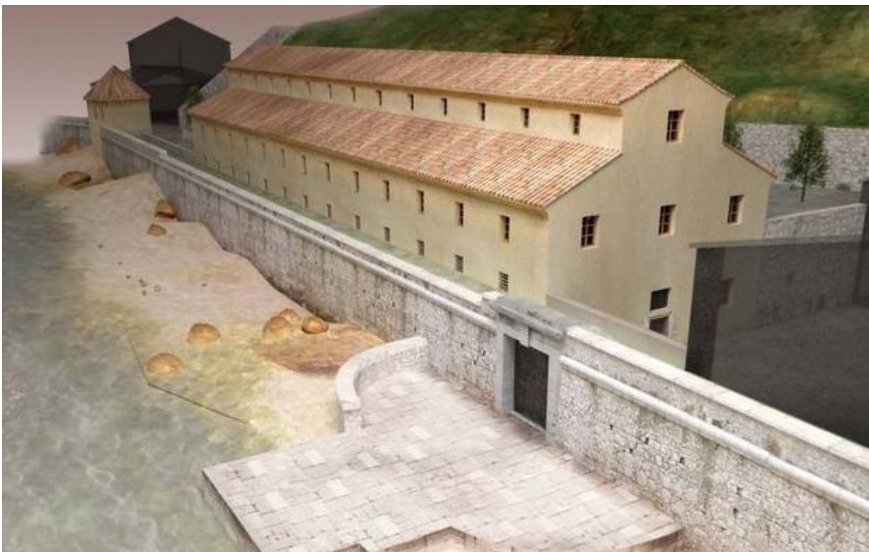
Hôpital des galériens, Darse, reconstitution 3D