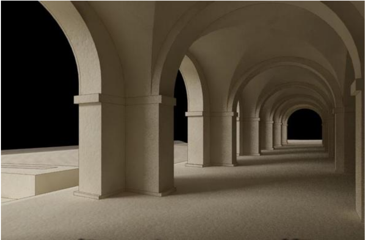
Les voutes de la Darse, reconstitution 3 D (c) ENSA.Marseille