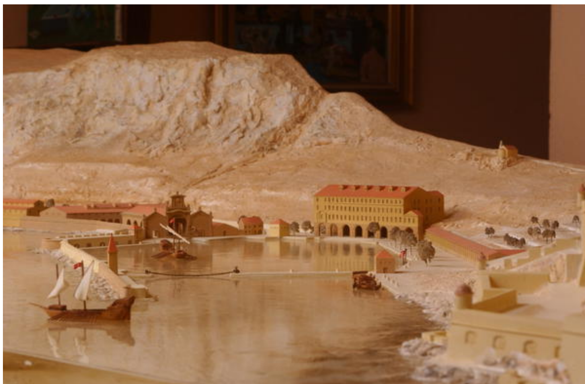
Maquette de La Darse à la fin du XVIII e siècle, détail

La Darse est le nom donné au port militaire de Villefranche-sur-Mer édifié du XVI e au XVIII e siècle. Cet aménagement s'ajoute au port de commerce situé plus au nord (actuel port de la Santé) et complète l'usage maritime de la rade.