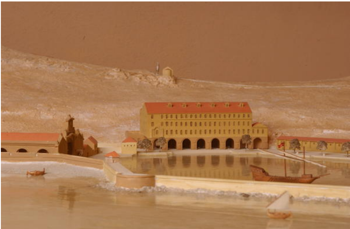
Maquette de La Darse à la fin du XVIIIe siècle, détail