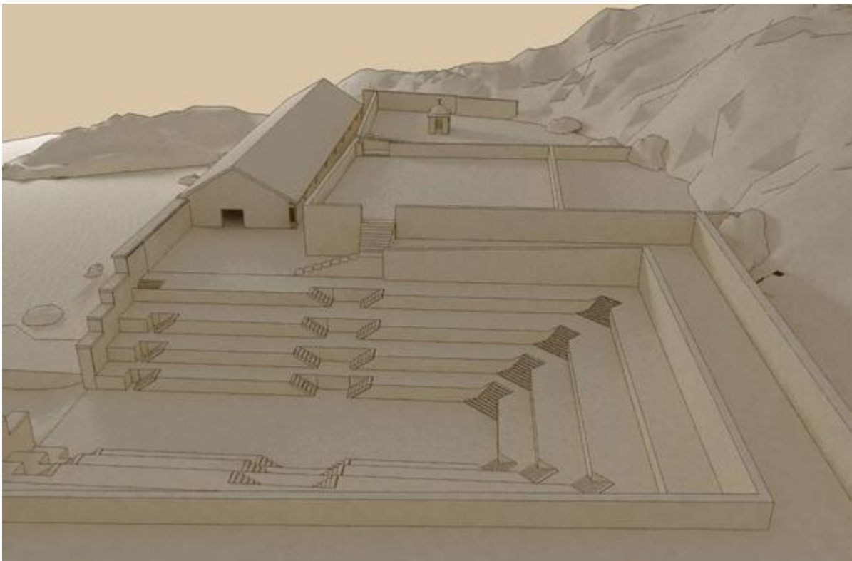
Arsenal des frégates, Darse, reconstitution 3D