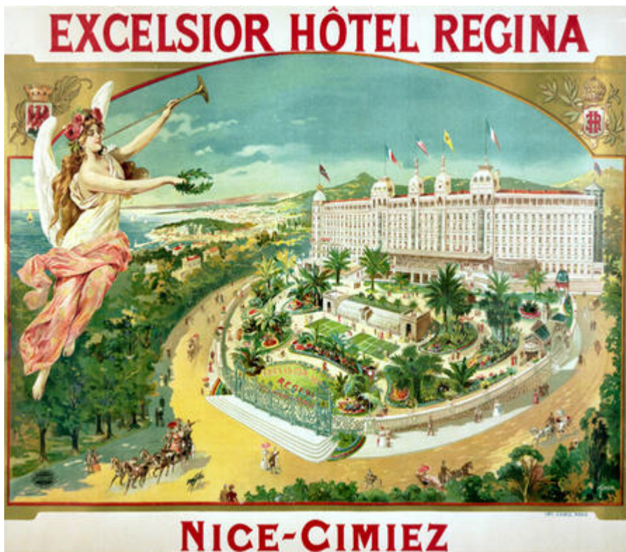
Hôtel Régina, Nice

L'architecture de la Belle Époque sur la Côte d'Azur adopte le style dominant alors en France et en Europe : l' éclectisme . Il consiste à emprunter librement aux styles anciens (classique, roman, gothique , renaissance , baroque ) des éléments pour composer une œuvre nouvelle.