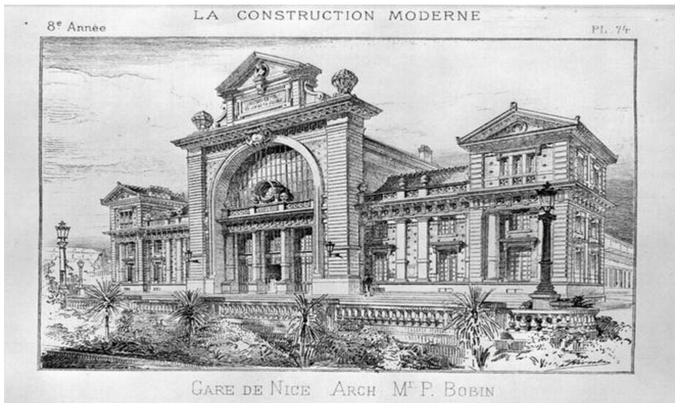
Gare des chemins de fer du Sud de la France à Nice