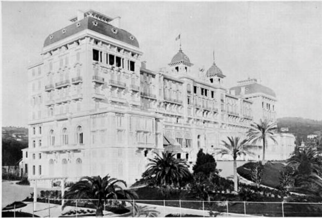
HOTEL GALLIA, A CANNES. — ARCHITECTES : MM. STOCKLIN.