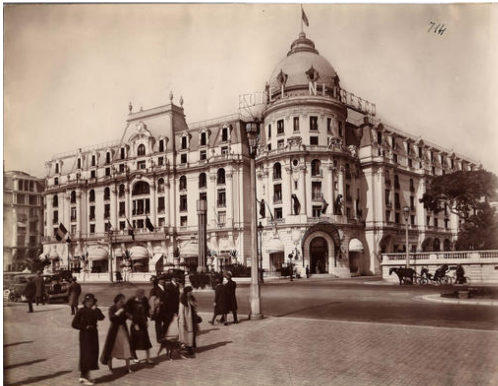
L'hôtel Negresco, Nice.