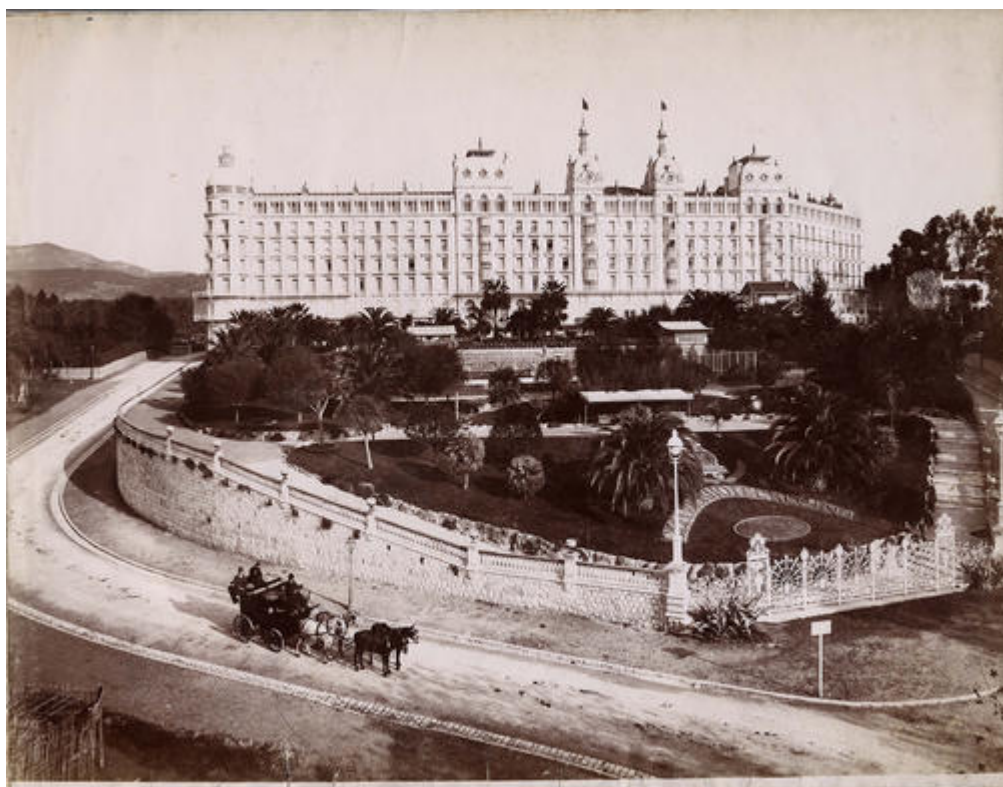
L'Excelsior Hôtel Palace Regina, Cimiez, Nice.