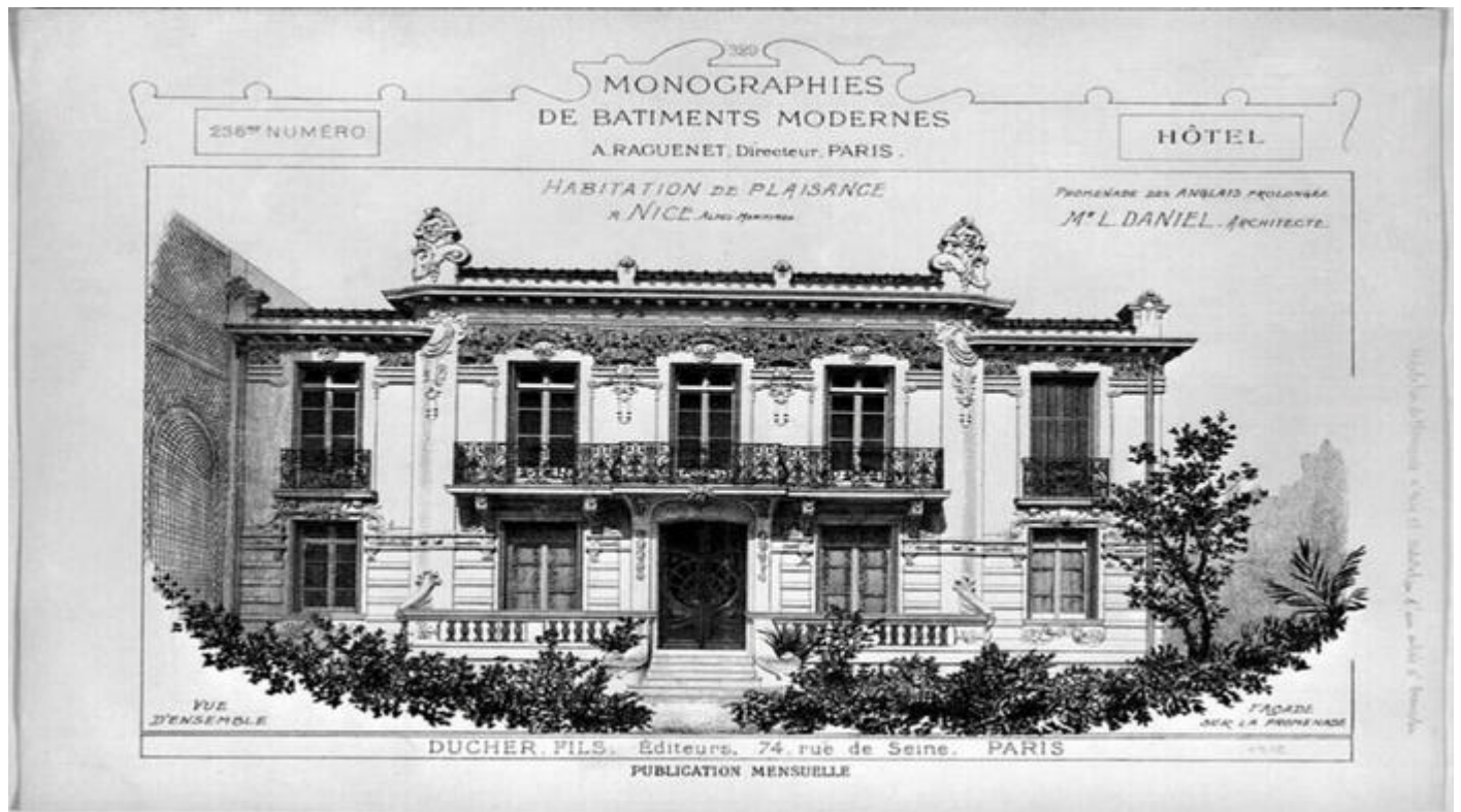
Habitation de plaisance à Nice (Promenade des Anglais)