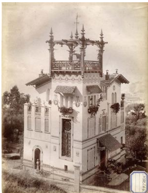
La villa Mon Joujou au mont Boron à Nice.

Nice, bibliothèque de Cessole, fonds Gilletta.