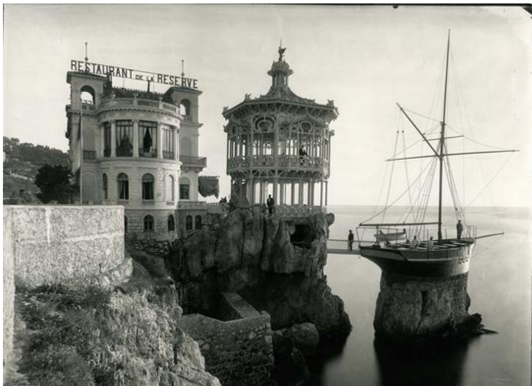
Le restaurant La Réserve au port de Nice.