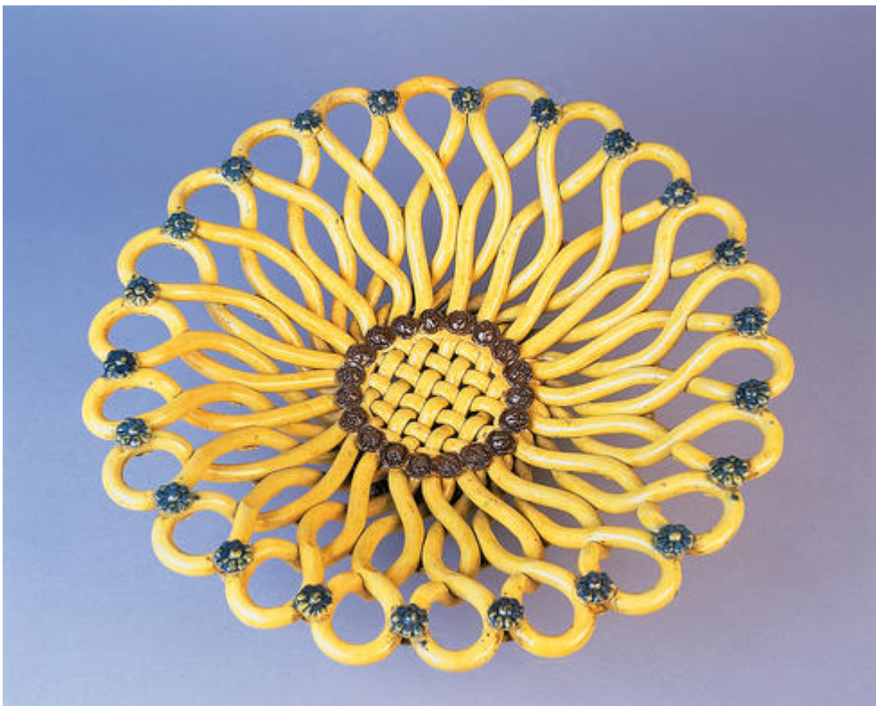
Coupe tressée , attribuée à Foucard-Jourdan, vers 1950, faïence tressée et émaillée, Musée Magnelli, Musée de la Céramique, Vallauris