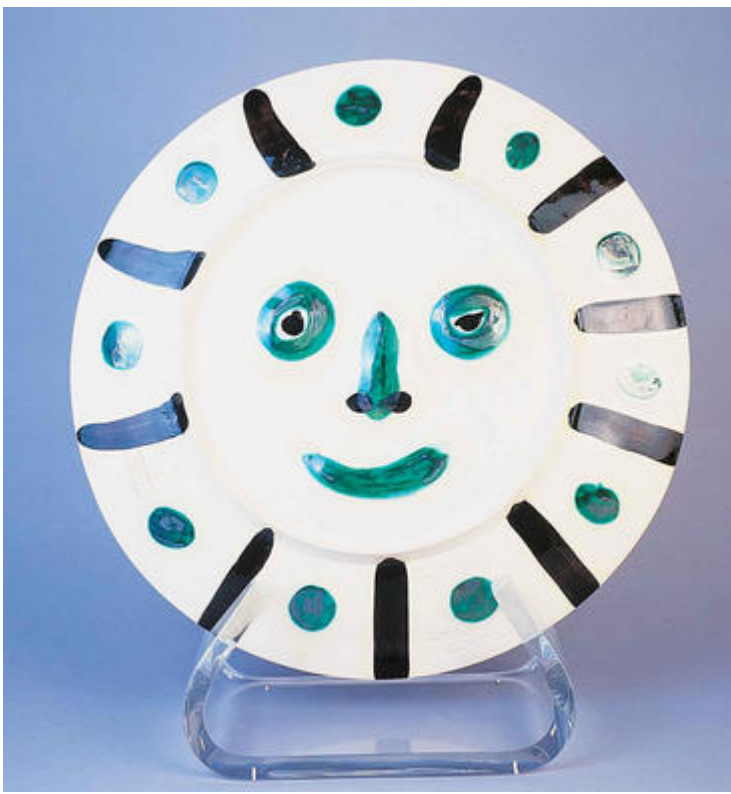
Pablo Picasso, Plat visage aux tâches , 1956, faïence, Musée Magnelli, Musée de la Céramique, Vallauris