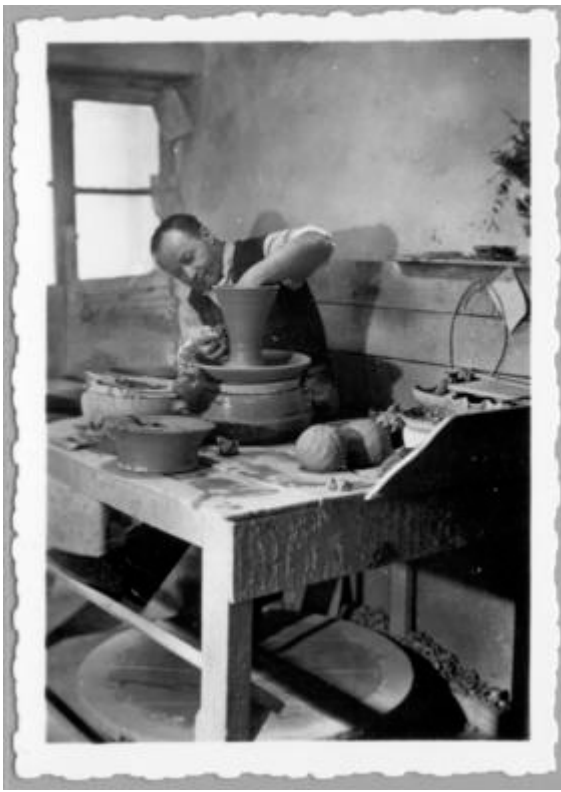
Carte postale montrant un potier tourner une céramique au tour à pied (technique ancestrale et emblématique des savoir-faire de la Ville de Vallauris depuis la Renaissance )