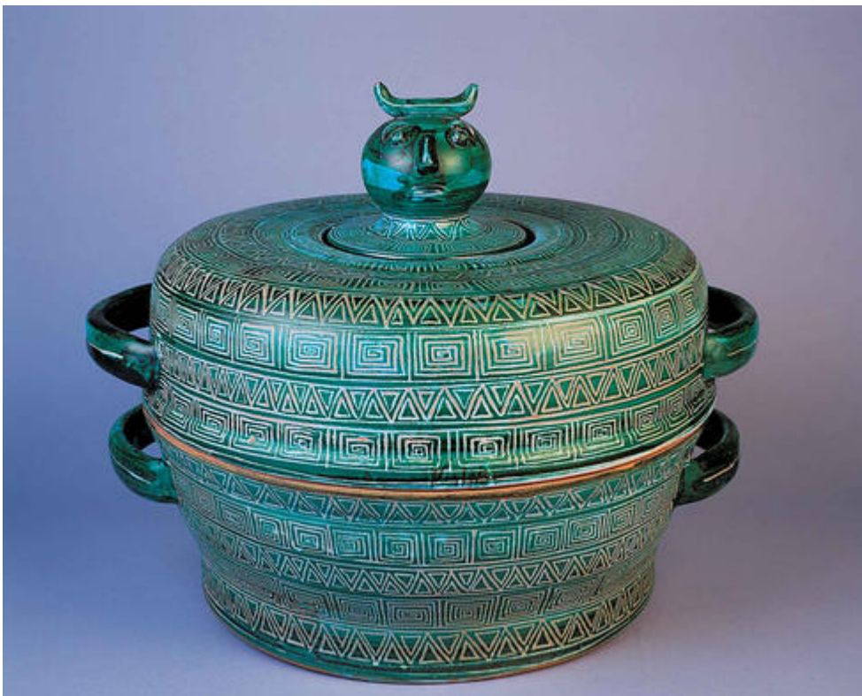
Robert Picault, Four de campagne , vers 1950, faïence émaillée, décor sgraffité, Musée Magnelli, Musée de la Céramique, Vallauris