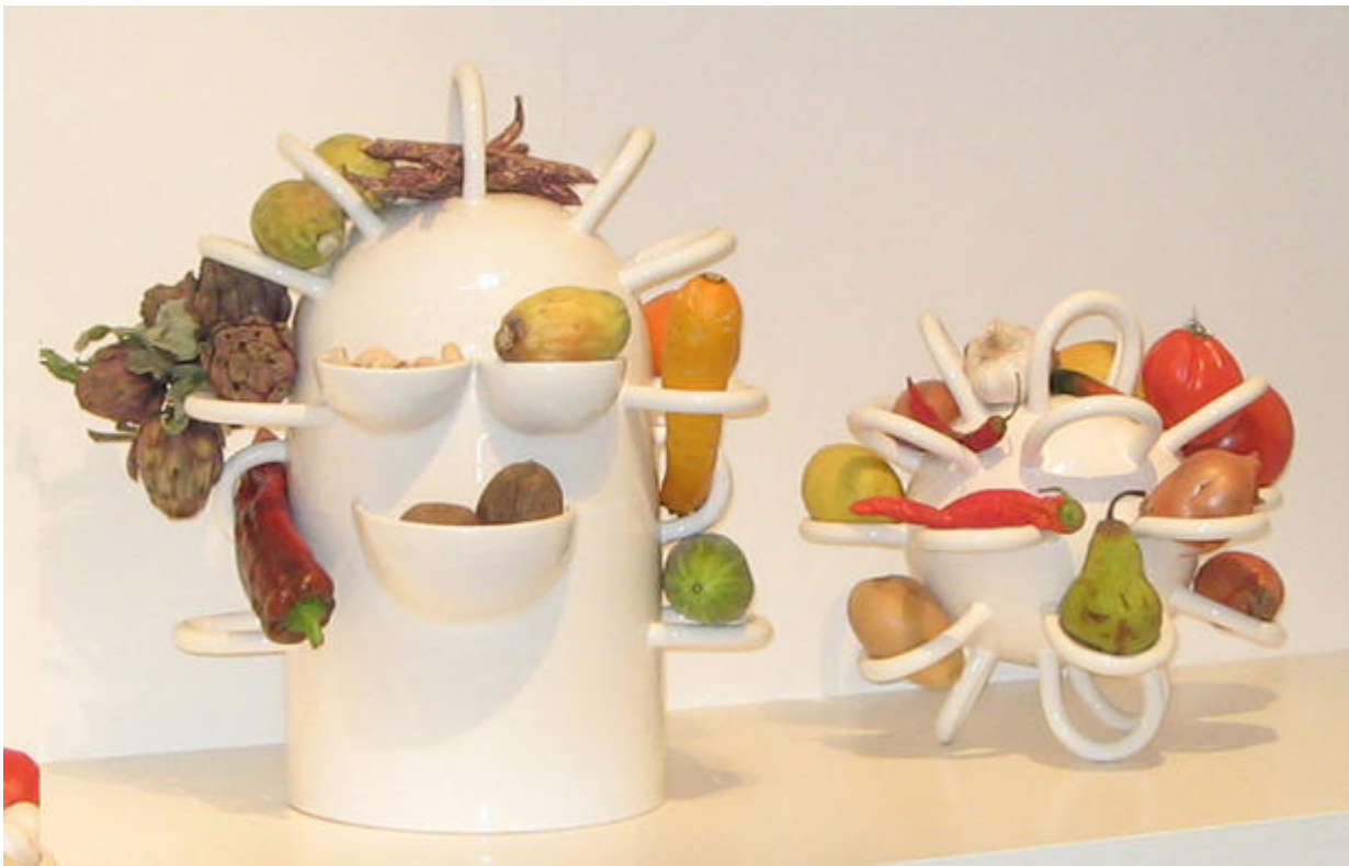
"Robot", porte-fruits et légumes, créé en 2001 sur une invitation de la Direction des Arts-Plastiques. Florence Doléac / RADI Designers à Vallauris , réalisation "Poterie d'Amélie" puis Claude Aiello.