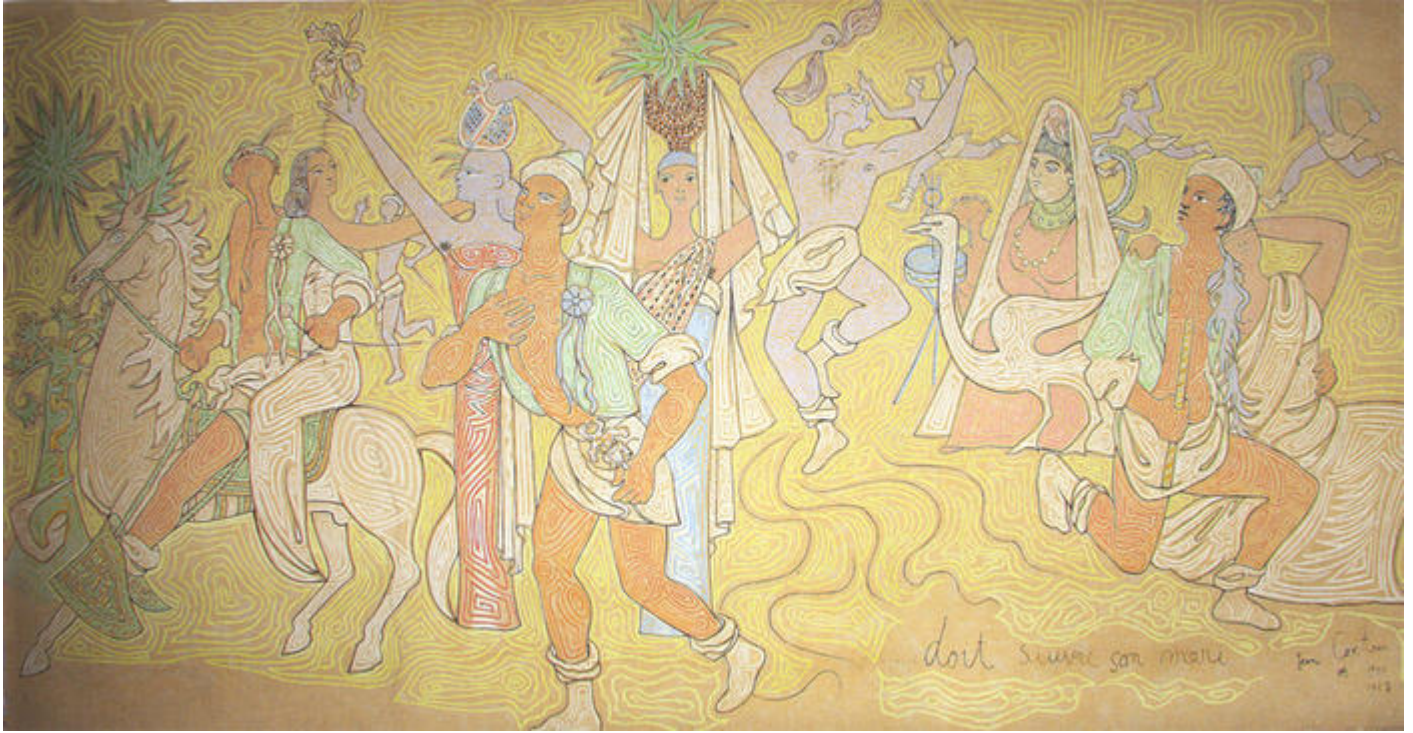
Salle des mariages de Menton- Jean Cocteau. Panneau de gauche, scène de la noce imaginaire.