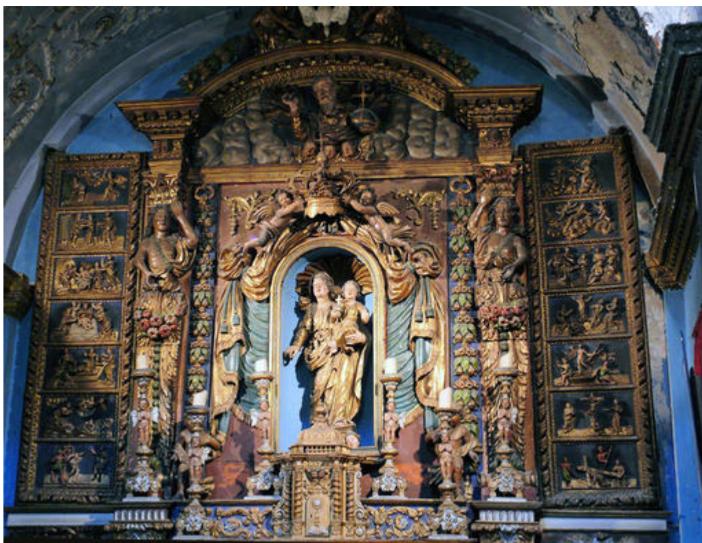
Retable du rosaire en bois sculpté, XVII e siècle, chapelle de Gubernatis dans l'église