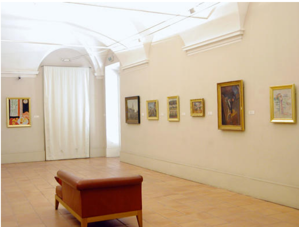
La salle des peintures