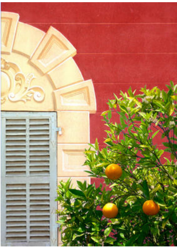
Fenêtre à linteau et moulures en trompe-l'œil du Musée Matisse, parvis des orangers