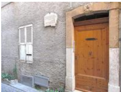
Maison natale de Jacques Audiberti, rue du saint Esprit, Antibes