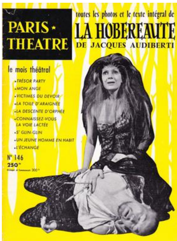
Couverture de la revue Paris Théâtre , 1958