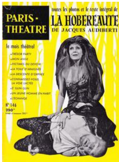
Couverture de la revue Paris Théâtre, 1958

Bien décidé de rompre avec le milieu du journalisme qu'il associe aux périodes difficiles, Jacques Audiberti se consacre entièrement à l'écriture. Les années d'après guerre sont les plus fécondes. En plus des pièces de théâtres et de la peinture qui l'accapare, il écrit un roman par an. L'écriture devient une frénésie, un état second. En parlant de sa pièce de théâtre Le Mal Court (1956), Audiberti écrit : « J'ai écrit en état de transe, comme si Le Mal Court avait été écrit quelque part dans l'espace et que je n'eusse qu'à recopier ce qui était devant moi et au delà de moi. J'ai dû l'écrire en deux heures ... ».